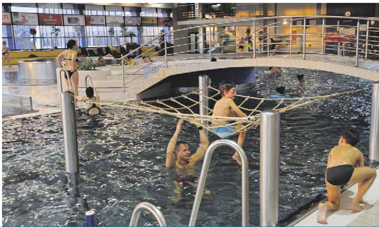
Mostecký Aquadrom funguje od začátku milénia. Od té doby tu prošlo na tři miliony návštěvníků.

Skatepark se uzavře ve dnech od 23. do 27. dubna 2018. Poté budou moci skateboardisté opět park využívat a renovované překážky si užívat plnými doušky. (sol)