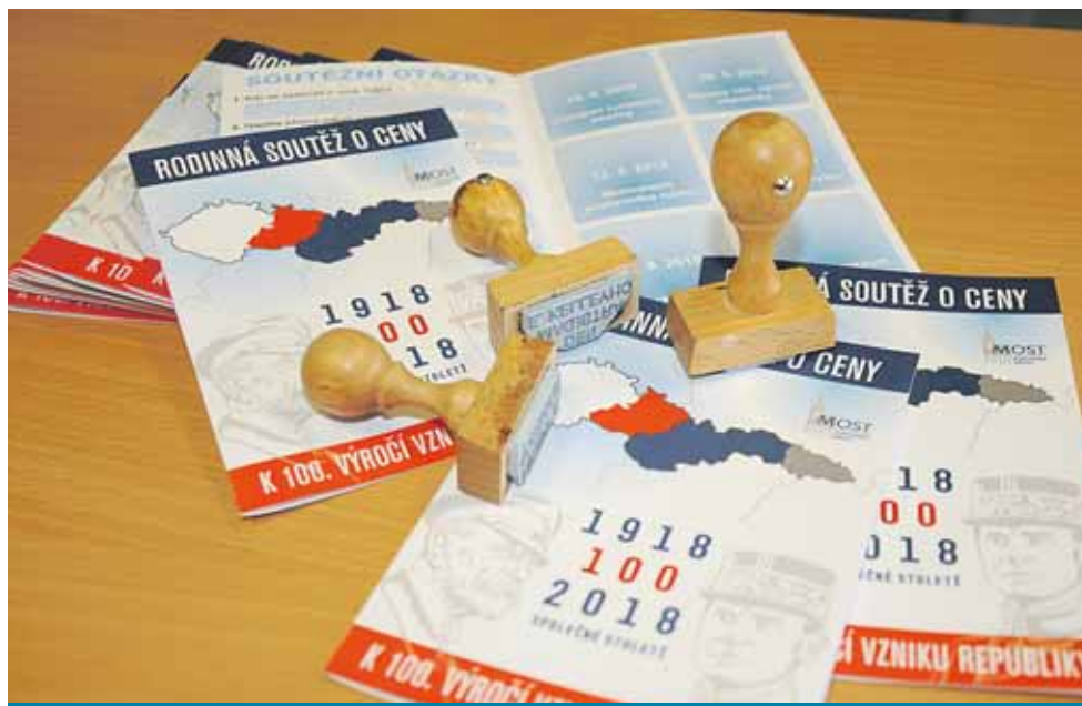
Do soutěžní karty budou moci zájemci sbírat razítka.

„Do slosování zařadíme každou kartu, která bude obsahovat alespoň tři razítka. Podmínkou účasti je i správné zodpovězení na několik otázek z historie, které jsou rovněž uvedeny na soutěžní kartě. Ve hře je tablet a dalších deset vedlejších cen,“ doplnila k soutěži tisková mluvčí. (sol)