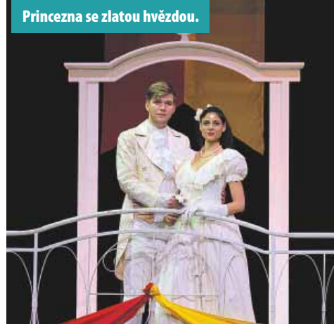
Princezna se zlatou hvězdou.

Noc na Karlštejně vidělo v roce 2016 na 1 600 diváků, vloni už to bylo 1 800 diváků. Ať žijí duchové! vidělo vloni 1 050 diváků. V letošním roce se bude Noc na Karlštejně hrát 8krát. Sluhu dvou pánů může vidět 1 200 diváků v šesti představeních. Jedno volné představení bude mít i Princezna se zlatou hvězdou na čele, pro kterou jsou připravena také tři školní představení. Představení Ať žijí duchové! můžete letos vidět ve dvou volných termínech, pro školy je určeno pět představení.