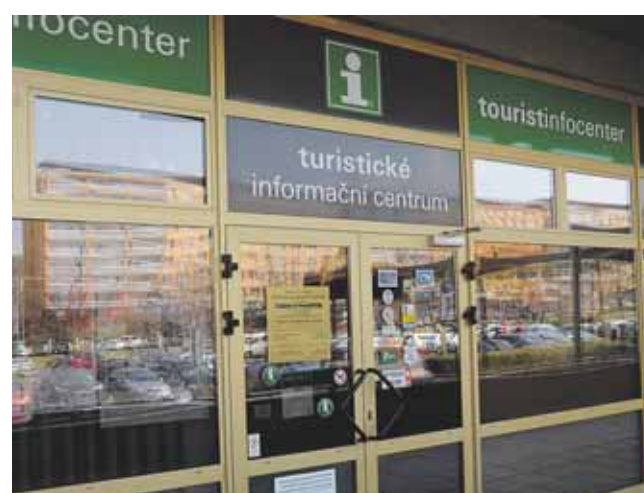
Turistické informační centrum je otevřeno od pondělí do pátku od 9 do 17 hodin. O května pak i v sobotu od 9 do 14 hodin.

centru vyzvedávat soutěžní karty. Karty obsahují volných šest políček. Pět z nich zahrnuje městské akce, konkrétně Zahájení turistické sezony 22. dubna, Oslavy 100. výročí vzniku republiky 26. května, Miniveletrh cestovního ruchu 12. června, Den magistra Kelleyho 16. června a Mosteckou slavnost 8. září. „Šesté políčko je určeno pro oblastní muzeum, které mohou soutěžící navštívit kdykoliv v jeho provozní době, stejně jako Dílnu magistra Kelleyho, kam mohou