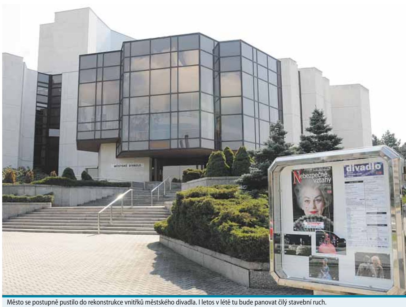
Město se postupně pustilo do rekonstrukce vnitřků městského divadla. I letos v létě tu bude panovat čilý stavební ruch.