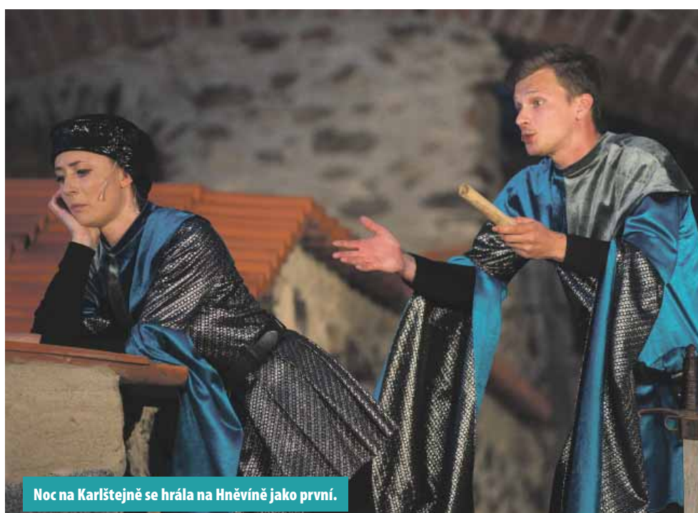
Noc na Karlštejně se hrála na Hněvíně jako první.