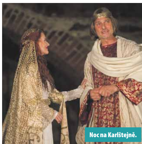
Noc na Karlštejně.