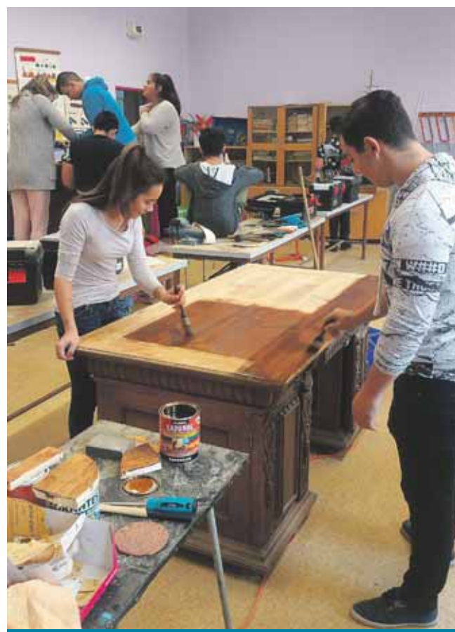
Práce v dílnách lomské děti baví.

Školní dílny mají nové vybavení z poměrně nedávné doby. Problémem je ale podle Jakuba Ozaňáka materiál. „Máme nářadí, ale nemáme dřevo, se kterým by mohly děti pracovat. Stačí nám i odřezky, které už truhláři nevyužijí. Někde dožíváme od místního lomského truhláře, za což samozřejmě velmi děkujeme. Upotřebili bychom