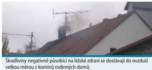
Škodliviny negativně působící na lidské zdraví se dostávají do ovzduší velkou měrou z komínů rodinných domů.

Také letošní zima zejména v mrazivých týdnech připomněla, že škodliviny působící na lidské zdraví a způsobující zápach se dostávají do ovzduší velkou měrou právě z komínů rodinných domů. Lidé si tak ve své lokalitě bohužel vytvářejí imise částečně sami. Průmyslové komíny továren totiž rozptylují jen povolené množství emisí a díky své výšce je rozptylují podstatně výše a do širší oblasti. Navíc je u nich vše přísně měřeno a řízeno zákonnými normami. Kvalita ovzduší