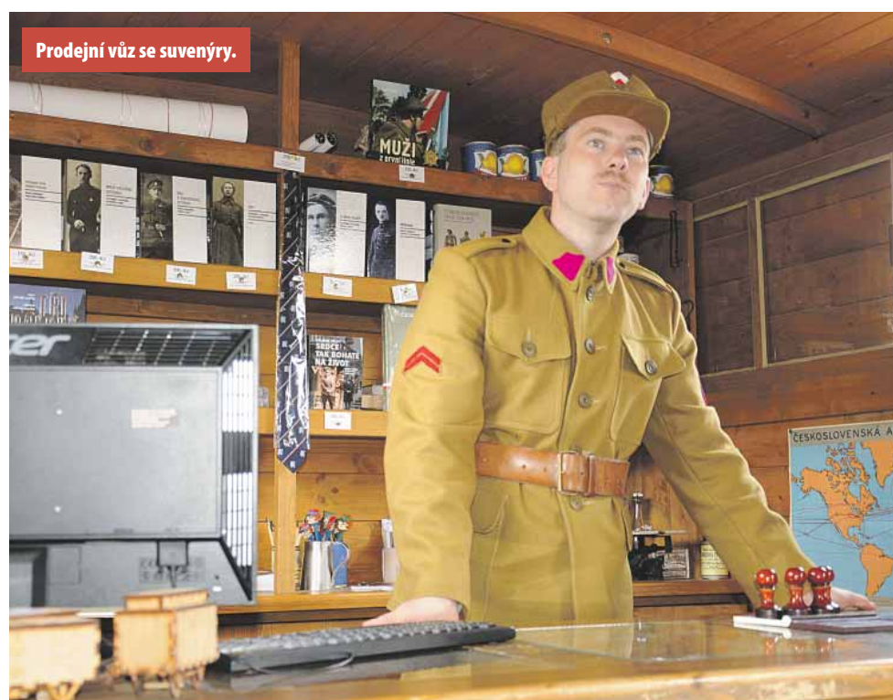
Prodejní vůz se suvenýry.