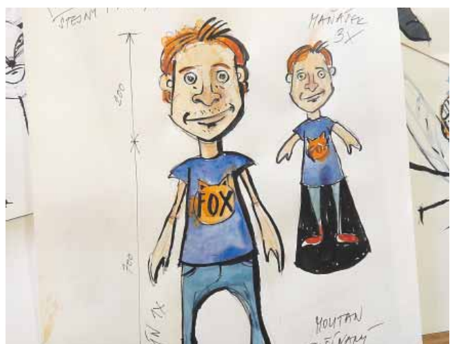
Děti i jejich rodiče se mají na co těšit.