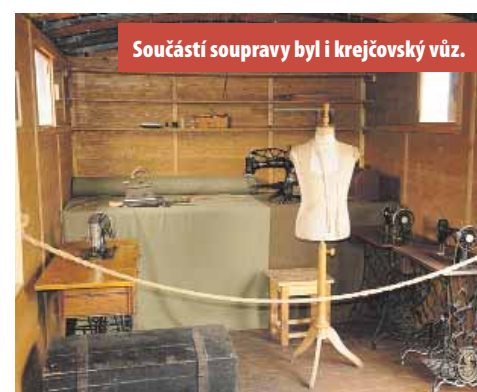
Součástí soupravy byl i krejčovský vůz.