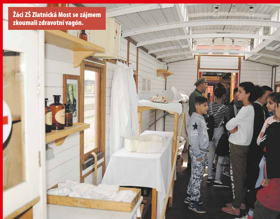
Žáci ZŠ Zlatnická Most se zájmem zkoumali zdravotní vagón.