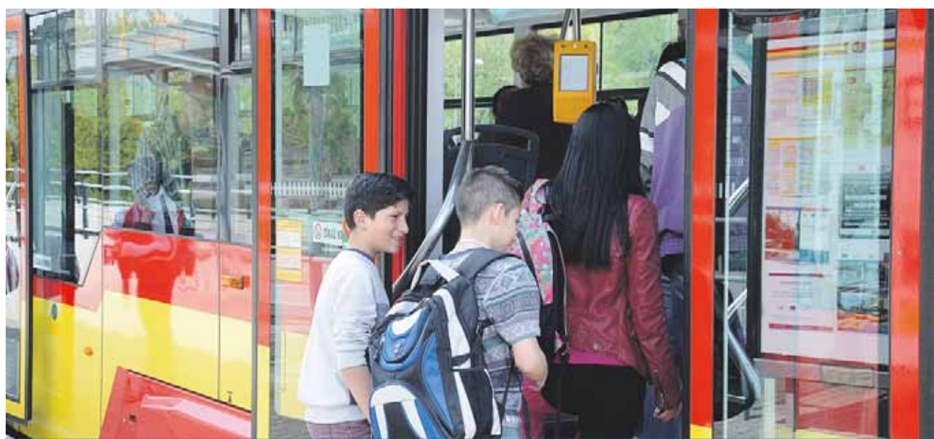
Informačním systémem budou vybaveny všechny autobusy a tramvaje, které ho dosud ještě nemají.

stane nemovitost neprodejná. Proto se snažíme stanovit provizi co nejnižší. Na rozdíl od ostatních realitních kanceláří totiž nemáme rozsáhlý management, pokud nemovitost prodává kdokoliv z našich makléřů, jedná se o přímý vztah klient - makléř - jednatel, v případě mých obchodů je to klient - jednatel. Snažíme se minimalizovat náklady právě třeba u výše uvedené inzerce tak, aby provize byla co nejpříjemnější. (nov)