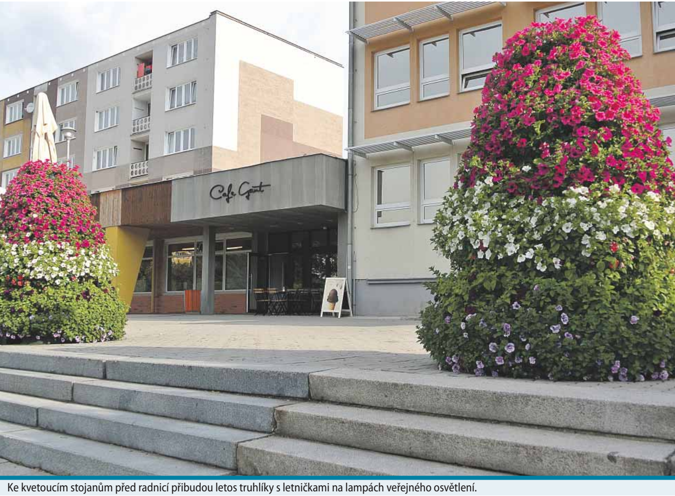
Ke kvetoucím stojanům před radnici přibudou letos truhlíky s letničkami na lampách veřejného osvětlení.