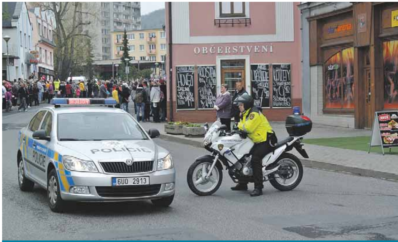
Na bezpečnost v Litvínově dohlíží 67 zaměstnanců Městské policie Litvínov.

Městská policie provozuje kamerové systémy ve městě se 42 kamerovými body a pult centralizované ochrany, na který je napojeno 37 objektů v majetku města a 124 soukromých objektů. Pod městskou policií spadá také útulek pro psy. Loni prošlo útulkem 158 psů, vydáno jich bylo 157. V rámci prevence kriminality městská policie zajišťuje provoz Nízkoprahového centra Jaklík, příměstské tábory pro děti, věnuje se preventivním programům ve školách i seniorům. V roce 2017 působilo v Litvínově 12 asistentek prevence kriminality. (pur)