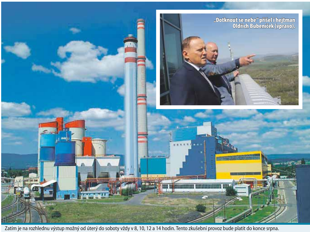
Zatím je na rozhlednu výstup možný od úterý do soboty vždy v 8, 10, 12 a 14 hodin. Tento zkušební provoz bude platit do konce srpna.

K výťahu je vytyčena speciální trasa vedoucí mimo výrobní a ostatní provozní technologie. Výtahem se dostanou zájemci do 28. patra, aby se ocitli na ochozu věže. Zdolat budou pak muset ještě 46 schodů. Přístup na věž bude umožněn jen s průvodcem a maximálně deseti lidem ve skupině. Děti musí být starší šesti let a do 15 let mohou nahoru jen v doprovodu rodičů či jiné odpovědné dospělé osoby, například pedagoga. (sol)