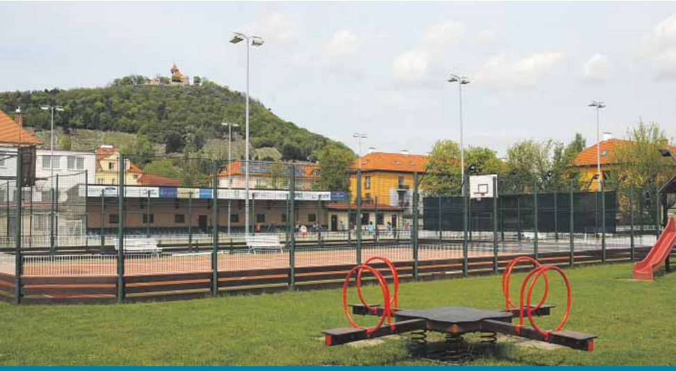
Sportovní areál se nachází v krásném klidném prostředí.

Více k pronájmu sportoviště na tel. 474 774 702 nebo na www.sportovnihalamost.cz