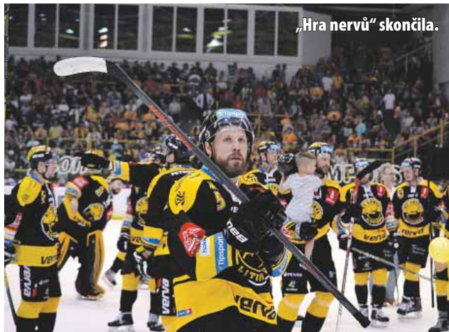
„Hra nervů“ skončila.