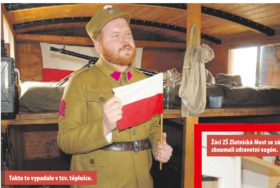
Takto to vypadalo v tzv. těpluše.