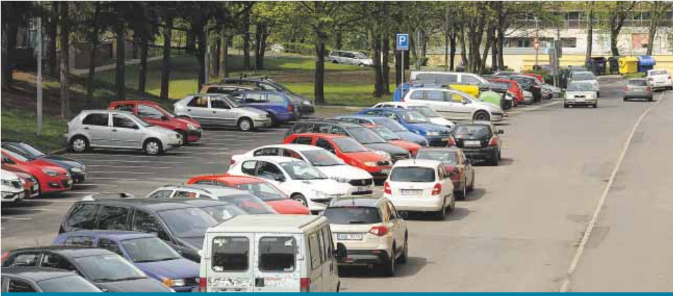
Nové parkování a dopravní změny se chystají i v lokalitě pětistovek, v okolí u Sputniku.