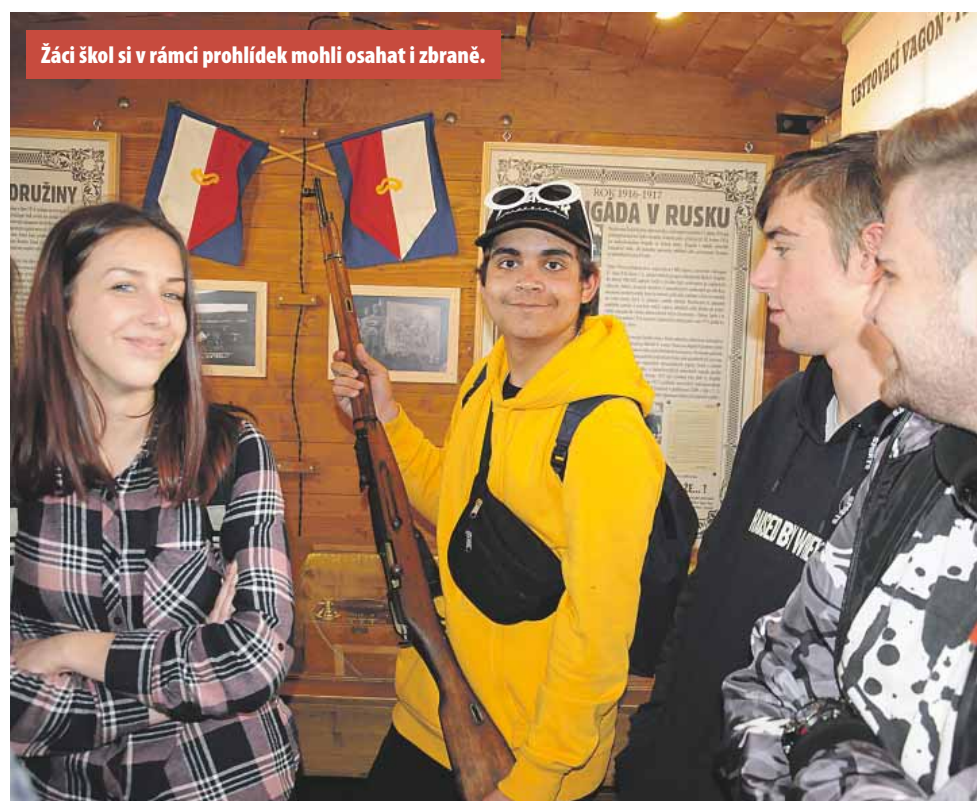
Žáci škol si v rámci prohlídek mohli osahat i zbraně.

Legiovlak se skládá ze 13 zrekonstruovaných vagónů, které představují vojenský ešalon. Těmito vlaky se desetitisíce čs. legionářů přepravily v letech 1918–1920 napříč Ruskem po Transsibiřské magistrále a průjezd si často musely vynutit bojem s bolševiky. Legiovlak se skládá z vozů polní pošty, těplušky, zdravotního, filmového, velitelského, štábního, obrněného, prodejního, krejčovského, kovářského (zrekonstruován na Slovensku), ubytovacího a dvou plošinových vozů. Ve všech vozech na návštěvníky čeká věrná rekonstrukce vybavení, legionáři v dobových stejnokrojích, ale také originální exponáty a několik stovek fotografií na panelech mapujících historii čs. legií.