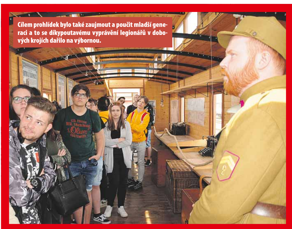
Cílem prohlídek bylo také zaujmout a poučit mladší generaci a to se díky poutavému vyprávění legionářů v dobových krojích dařilo na výbornou.