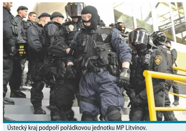
Ústecký kraj podpoří pořádkovou jednotku MP Litvínov.