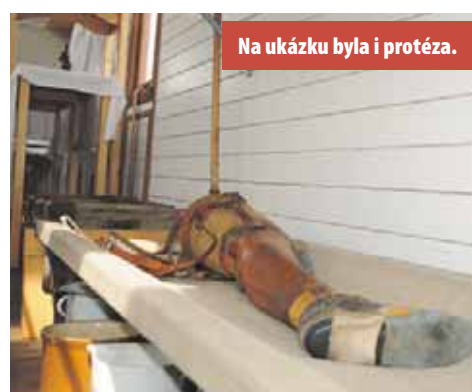
Na ukázkou byla i protěza.