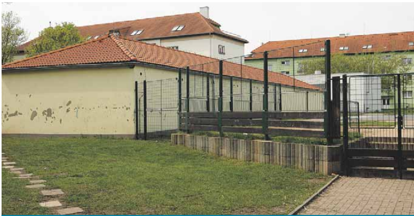
Po zrušení hřiště v Mozartově ulici se terčem vandalů staly přilehlé garáže.

V současné době by ale zřízení parkoviště celou věc nijak prý neřešilo. „Jednak by sem byl složitý přístup a muselo by se to tady objíždět a je otázkou, zda by sem lidé auta parkovali, když je to tu schované a není sem pořádně vidět. Pokud bychom tu do budoucna zvažovali parkování, smysl by mělo za předpokladu, že by bylo oplocené a hlídání,“ vysvětlil primátor. V současné době jsou ze hřiště demontované i zdejší atrakce. „Pingpongové stoly byly rozpadlé a další atrakce nepoužitelné. Některé repasují technické služby, například tubus s klouzačkou a ještě další houpačky, a poté je umístí na další hřiště ve městě,“ doplnil ještě Marek Hrvol. (sol)