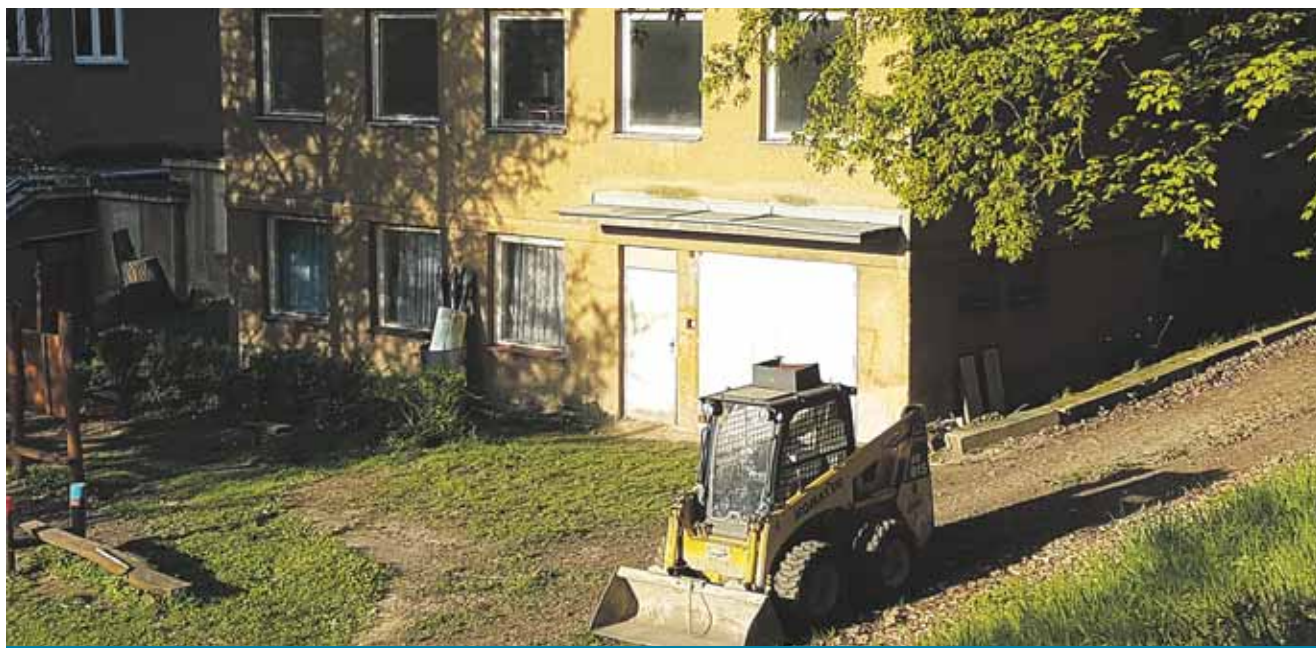
Nefunkční objekt se změní na moderní dílny.