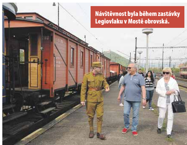
Návštěvnost byla během zastávky Legiovlaku v Mostě obrovská.

takto podařilo doplnit na 5 000 karet legionářů.“ Legiovlak se z Mostu na víkend od soboty 28. dubna do neděle 29. dubna přesouvá do nedalekého Oseka, poté budou další jeho zastávky Litoměřice. (sol)