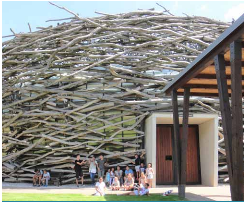
Děti z Jaklíku se mimo jiné podívaly i do „populární“ farmy Čapí hnízdo.