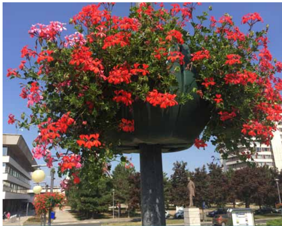
Udržet letos vegetaci v její kráse je náročné, ale stojí to zato

V letních měsících dochází také ke kácení suchých stromů. Jedná se o stromy, které technické služby sledují kvůli jejich zhoršené vitalitě a zdravotnímu stavu, následkem čehož došlo k jejich uhynutí. Na podzim