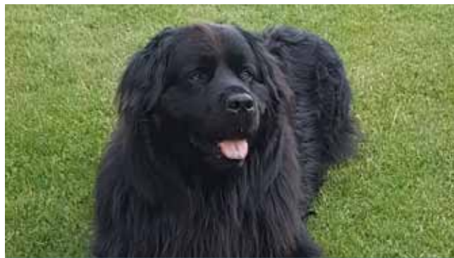
Na Šibeníku je v plánu psí loučka.

„Chtěli bychom zde vytipoval i místa pro psí loučku. Ze strany veřejnosti je po tomto velké poptávka, a proto bychom i tu-