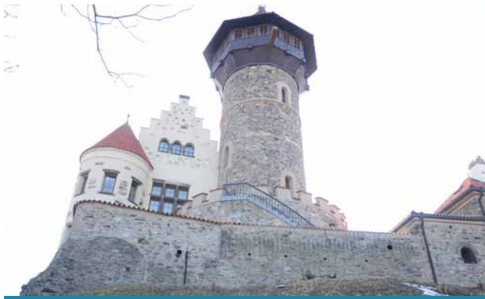
Dominanta Mostu, hrad Hněvín, bude nasvěceny i ze směru od Litvínova.