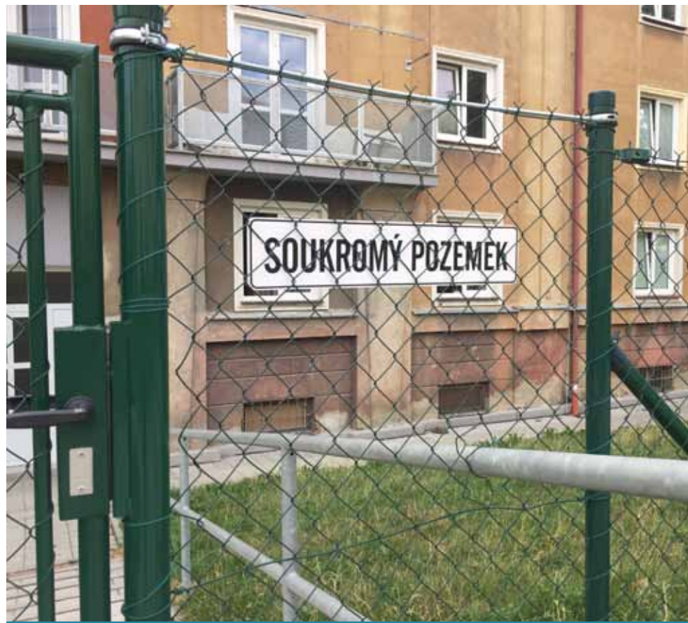
Plotů kolem bytových domů v Mostě přibývá. A není se co divit...