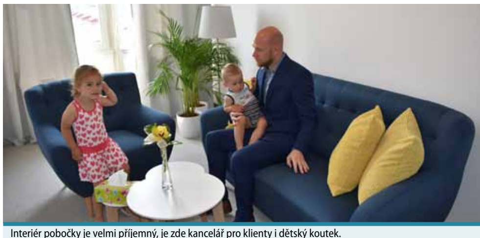
Interiér pobočky je velmi příjemný, je zde kancelář pro klienty i dětský koutek.