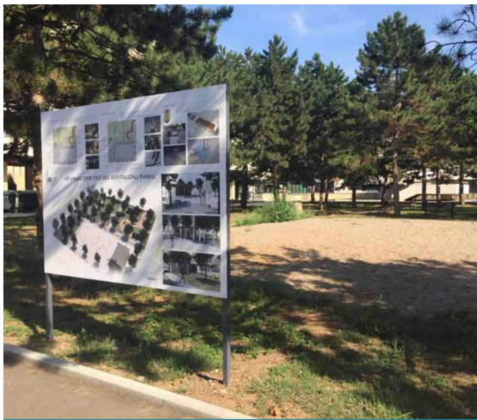
Parčík po kluzišti byl zdrojem kritiky, lidem vadilo, že se zde dlouho nic neděje.

Kromě zpevnění plochy se zde také počítá s mobiliá-