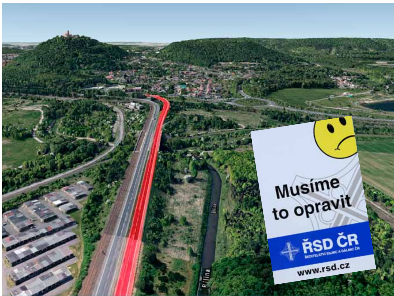
Čtyřpruhová silnice pod Hněvínem by se měla kvůli demolici mostu částečně uzavřít později, ještě však letos.

Původně plánovaná uzavírka měla postihnout i řidiče kamionů ve směru od Prahy, jejichž cílem cesty měl být závodní víkend Czech Truck Prix ve dnech 31. srpna až 2. září na mosteckém autodromu. ➔