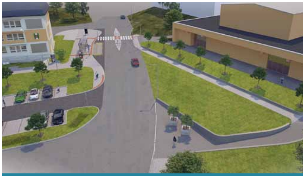
Nové náměstí dostane rovněž nové lavičky a odpadkové koše. Bude se tu i lépe parkovat.