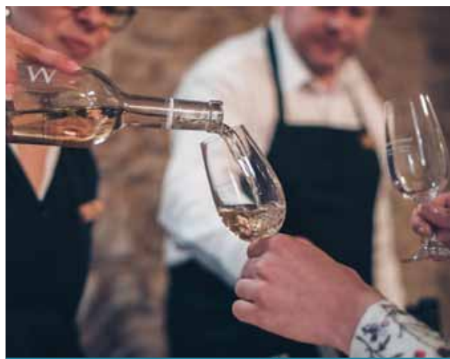
Za vínem se můžete vydat speciálním vínobusem.

Sponzorem akce, která potrvá od 9 do 20 hodin nebo do vypití sklepa, je mimo jiné společnost Severní energetická. Více informací na tel. 777 185 788. (nov)