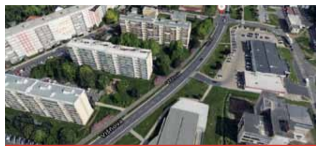
Oprava vodovodu ve Višňové ulici je jednou ze staveb obnovy majetku pro okres Most, kde SVS pro rok 2019 naplánovala celkem 21 staveb v celkovém objemu bezmála 108 milionů korun bez DPH.

V rámci stavby dojde i na rekonstrukci stávajícího řadu. „Jedná se o rekonstrukci stávajícího vodovodu, který je vedený podél komunikace v ulici Višňová, v délce zhruba 70 metrů před obchodním centrem ELDA, a přes komunikaci v ulici Růžová. Součástí rekonstrukce bude přestrojení uzlů v místě napojení na stávající vodovod včetně osa-