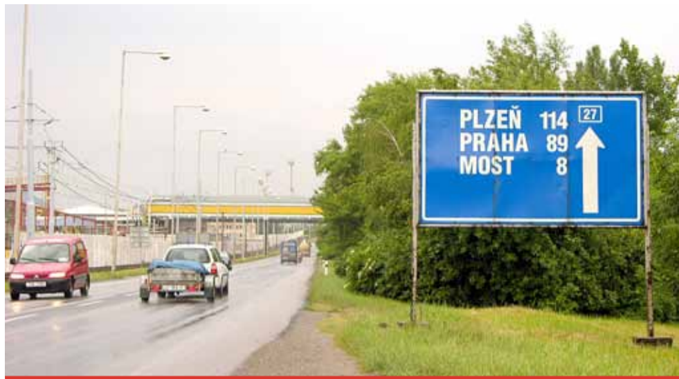
Než se řidiči dočkají čtyřpruhu z Mostu do Litvínova, budeme mít zřejmě „fousy až na zem“.

Na světelných křižovatkách se shodly nakonec všechny zúčastněné strany, i když měs-