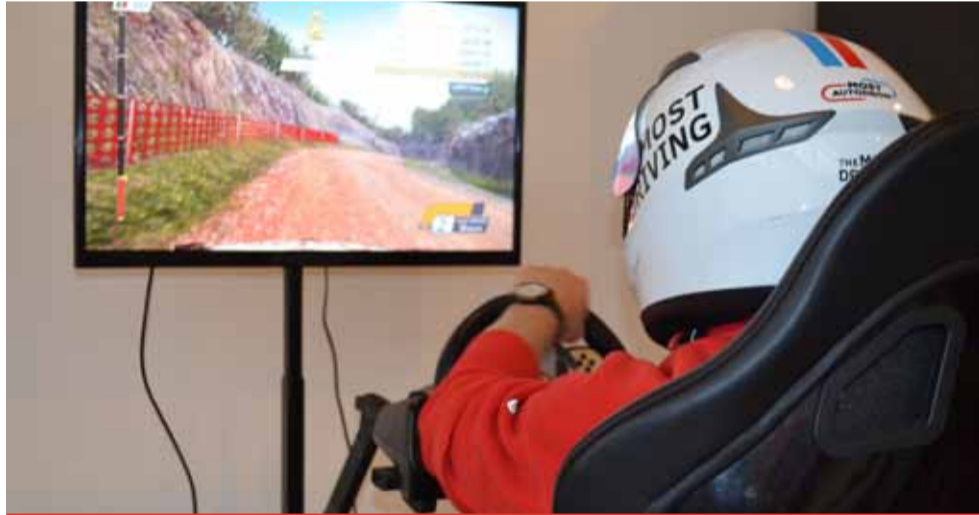
Na simulátoru si může zasoutěžit každý bez ohledu na pohlaví a věk.

Soutěž bude součástí akce The Most AUTOSHOW #10, která je tradičním rozloučením se závodní sezonou pro širokou veřejnost. „Simulátor bude od 9 do 17 hodin umístěn v boxu č. 1 v blízkosti startovní věže. Soutěžit může každý bez ohledu na pohlaví a věk, nesmí jen vlastnit licenci závodního jezdce, vydanou mezinárodní automobilovou federací FIA,“ upřesnila výkonná ředitelka agentury Pozitif Jana Svobodová. Trojice s nejrychlejšími dosaženými časy na jedno kolo získá hodnotné ceny. Na celkového vítěze čeká navíc i ocenění Zlatý volant stejnojmenné prestižní ankety o nejlepší závodní jezdce sezony 2019.