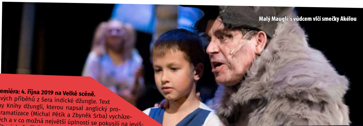
Malý Mauglí s vůdcem vlčí smečky Akélou

MOST – Městské divadlo v Mostě se přehouplo do druhé poloviny divadelní sezony. V ní se mají milovníci prken, co znamenají svět, ještě nač těšit. Připraveny jsou tři premiéry z celkových osmi pro rok 2019 v městském divadle. Premiéra se uskuteční v těchto dnech ale také v Divadle rozmanitostí. (sol)