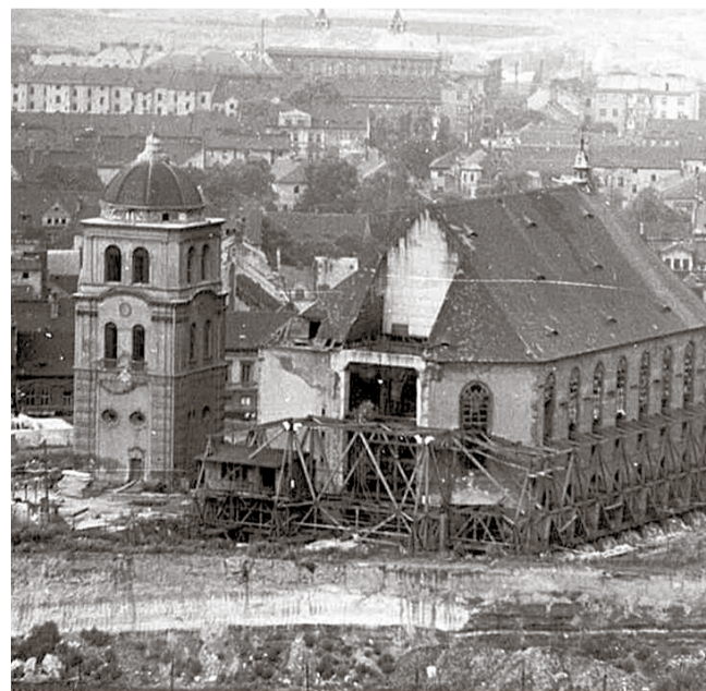
V pondělí 30. 9. 1975 se vydal na věhlasnou cestu mostecký gotický chrám.