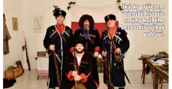
Ukázky průřezem vojenské historie zaujaly každého bez rozdílu věku i pohlaví.