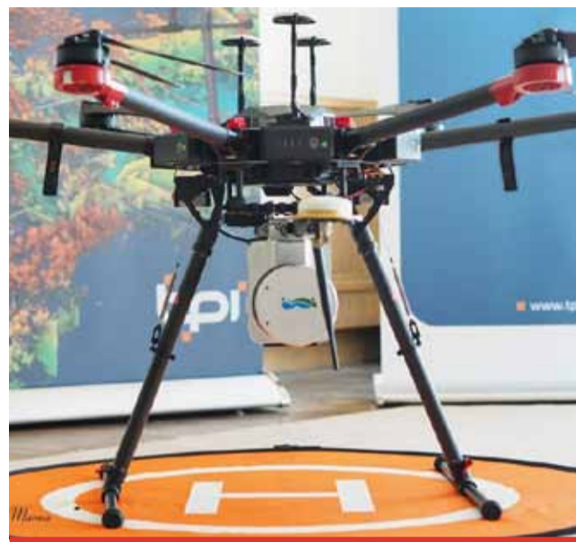
Technické vzdělávání je alfou a omegou budoucnosti. Investice do dětí v tomto oboru je vekou devízou. Litvínov tuto možnost podpořil.