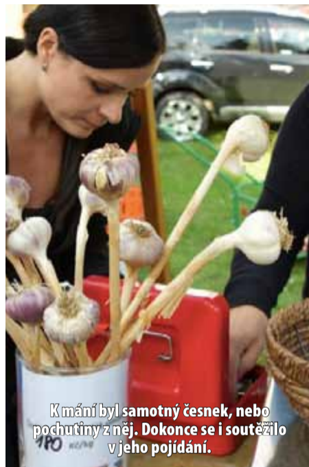
K máni byl samotný česnek, nebo pochutiny z něj. Dokonce se i soutěžilo v jeho požívání.