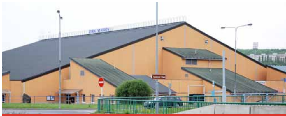
Celkové náklady na rekonstrukci zimního stadionu si vyžádaly přes čtyřicet milionů korun. Město na akci získalo dotaci bezmála sedm milionů korun.