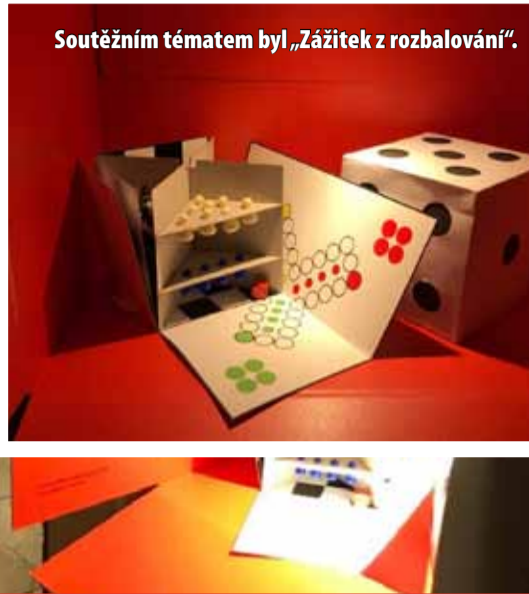
Soutěžním tématem byl „Zázitek z rozbalození“.

Na vítězné návrhy se zájemci mohou podívat v Galerii CZECHdesign Praha, kde jsou v současné době vystaveny. (sol)