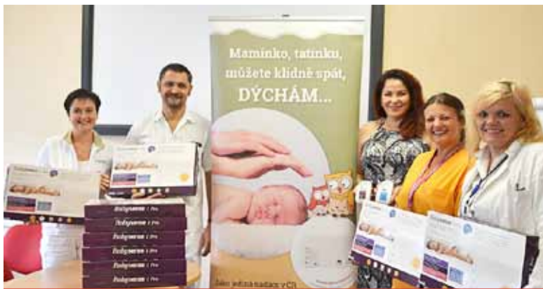
Vloni například nové monitory dechu pro mosteckou nemocnici podpořila Vršanská uhelná. Díky jejímu finančnímu daru získala nemocnice patnáct těchto přístrojů.

věku. „Hlavní činností naší nadace je zprostředkování monitorů dechu pro miminka mezi dárce a nemocnici. Oslovujeme firmy, instituce či společnosti a díky jejich finanční podpoře zajišťujeme postupně obnovování těchto citlivých přístrojů v nemocnicích v téměř v celé České republice,“ podotkla ředitelka Nadace Křížovatka. (sol)