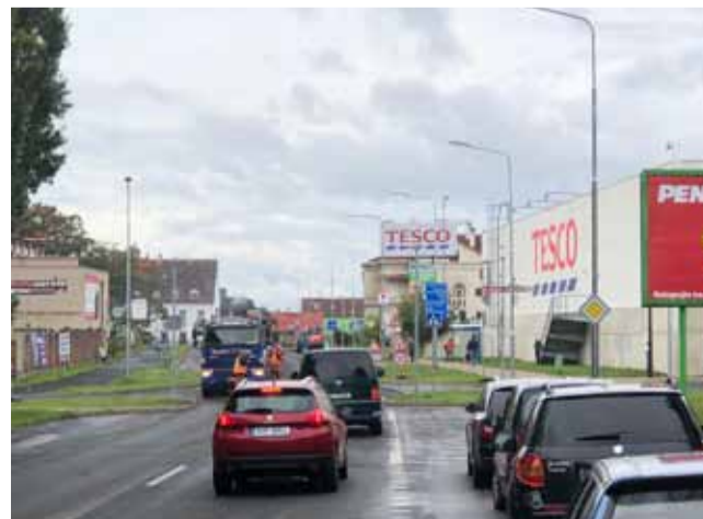
Stavební práce na Podkrušnohorské ulici by měly být hotovy nejpozději do 15. října.

Autobusová zastávka „Litvínov - Krušnohor“ bude v době I. a II. etapy zcela zrušena. (ink)