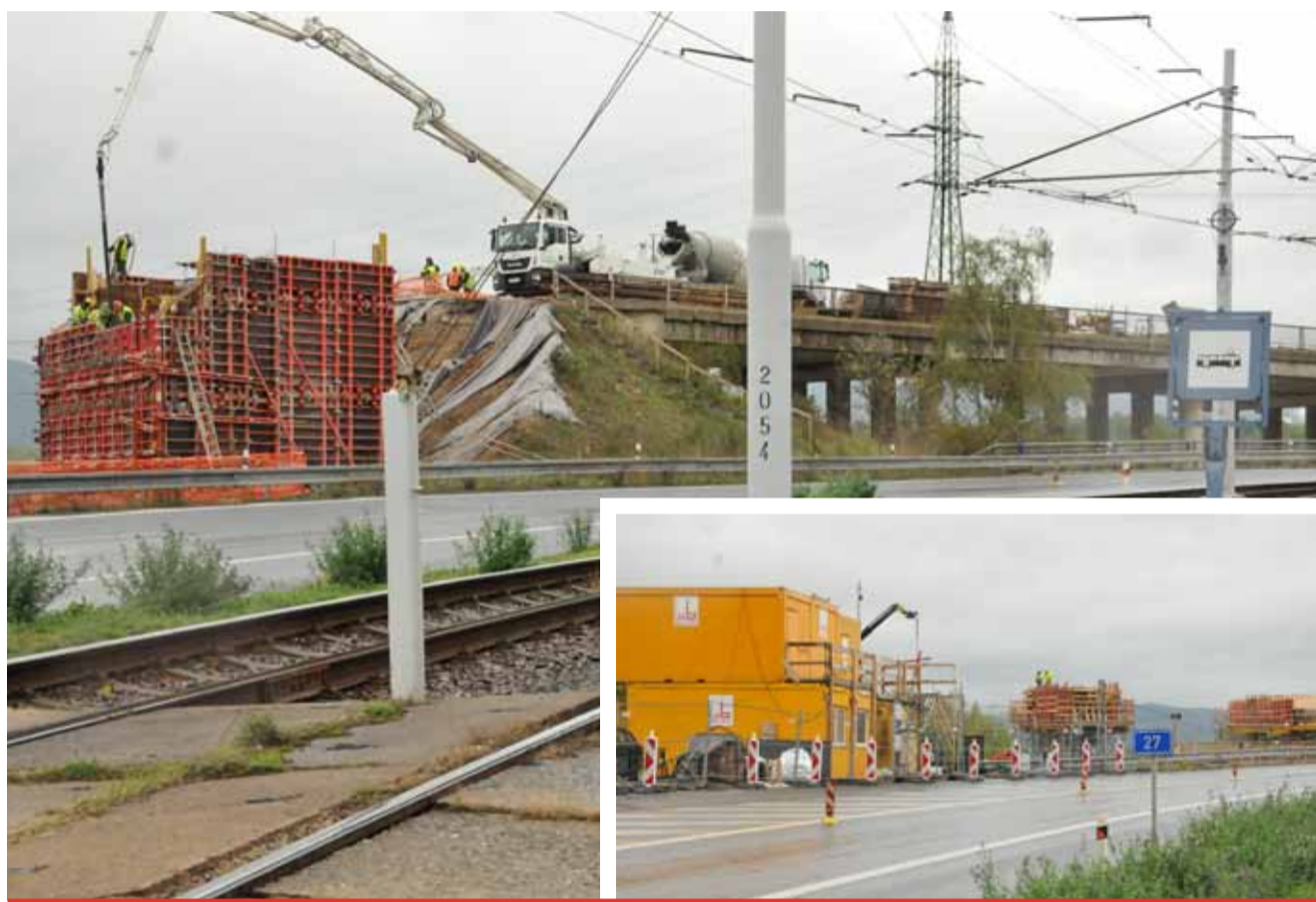
„Nejen na silnici I/27 je několik dalších mostů, u kterých připravujeme rekonstrukci. V současnosti máme několik mostů před soutěží na zhotovitele stavebních prací a k dalším je zpracovávána projektová dokumentace,“ uvedla mluvčí ŘSD Nina Ledvinová.

Na již zdemolovaný most navazují další mosty, které jsou ve špatném technickém stavu. I na jejich opravu by se mělo v budoucnu dostat.