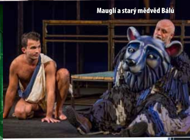
Mauglí a starý medvěd Bálúa