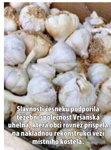
Slavnosti česneku podpořila těžební společnost Vršanská uhelná, která obci rovněž přispěla na nákladnou rekonstrukci věží místního kostela.