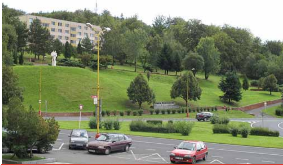
Ankety, jak zlepšit město, se mohou zúčastnit občané Meziboří bez rozdílu věku.

Odkaz na elektronický dotazník najdou zájemci na webových stránkách města Meziboří, papírové dotazníky budou spolu se schránkami, kam budou moci obyvatelé vyplněné dotazníky odevzdat, rozmístěny na mís-