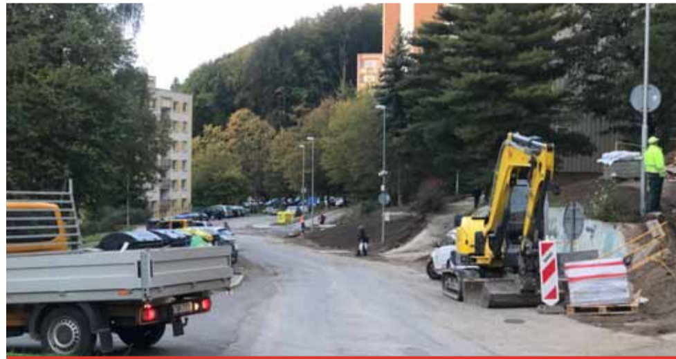
Tylova ulice jakoby dostala „černého Petra“. Dál zůstává rozkopaná.

Původně mělo Tepelné hospodářství Litvínov předat stavbu v červnu 2018. Město pak mělo během léta dokončit rekonstrukci chodníků a komunikací. To se ale nestalo. Firma nestihla práce na opravách tepelných rozvodů ani do zimy a pokračovala i v roce 2019. Je podzim a práce se teprve dokončují. Do zimy už ale Litvínov nestihne rekonstrukci komunikací a chodníků, jak má už dva roky v plánu. „Tepelné hospodářství Litvínov oznámilo, že oproti původnímu termínu do-