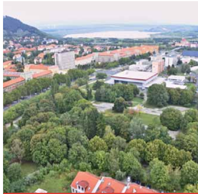
V případě postupu do užšího kola budou mít architekti čas na zpracování návrhů do 26. února 2020. Výsledky soutěže porota oznámí do 31. března 2020.