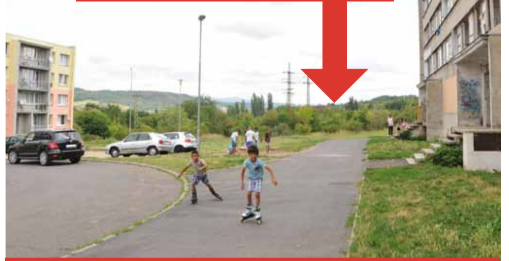
S výstavbou kontejnerů pro bydlení se počítá v průčelí domů na konci sídliště.