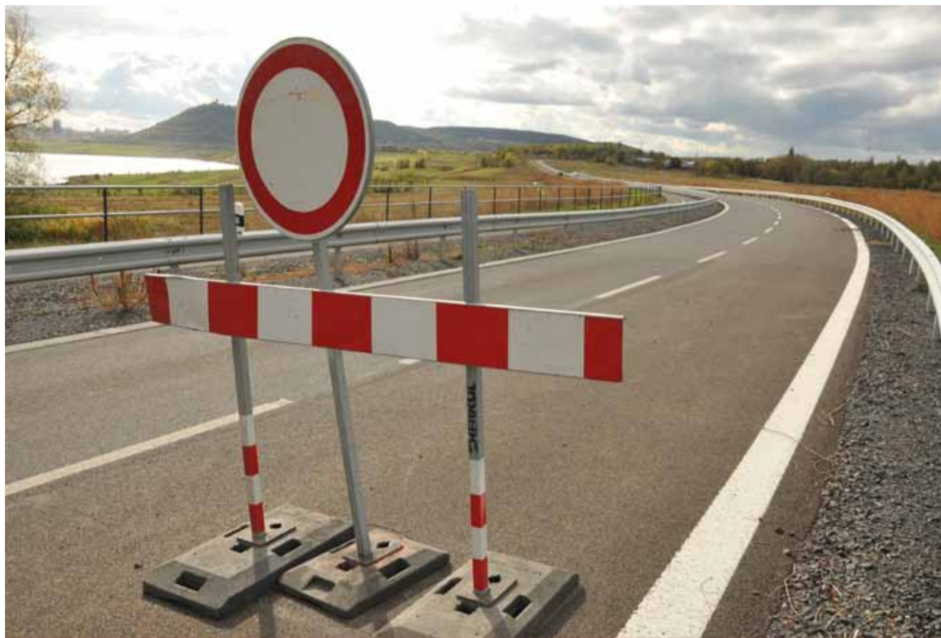
Při otázce, kdy bude silnice kolem jezera otevřena, neskrývá mostecký primátor roztrpčení. Stejně jsou na tom řidiči, kteří nad hotovou, ale stále zavřenou komunikací kroutí hlavou.