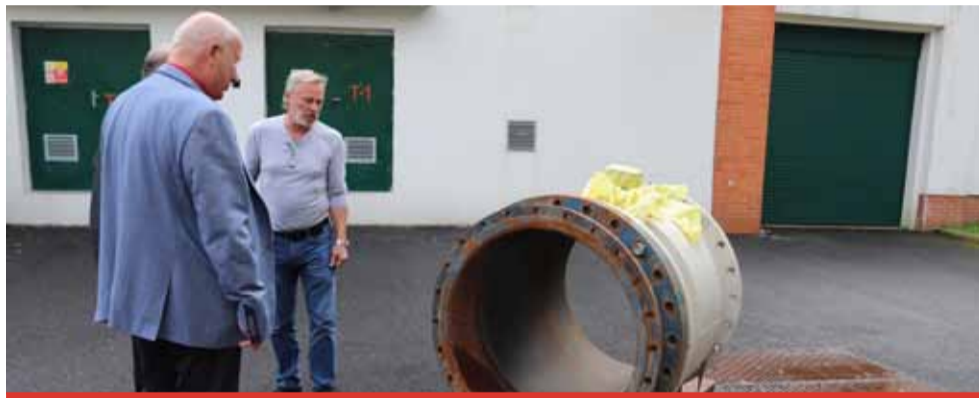
Hejtman si prohlédl i zdejší úpravnu vody.