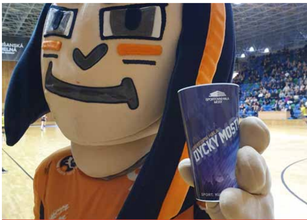
Své vratné kelímky bude mít i Sportovní hala Most. Možná už zanedlouho se fanoušci Černých andělů dočkají na kelímčích zajímavého designu.

Kelímky si budou moci navštívníci ve sportovní hale pořídit za vratnou zálohu padesát korun. „Chceme nejen šetřit životní prostředí, ale pořídili jsme je i pro komfort lidí. Není to nic převratného, ale stále více samozřejmější věc,“ konstatoval dále ředitel sportovní haly. Obdobné kelímky s nápisem Dycky Most a s logem města Mostu se objevily poprvé na Mostecké slavnosti. A jen se po nich „zaprášilo“. Teď budou mít Mostečané další příležitost. Sportovní hala má na kelímčích kromě populární seriálové hlásky také logo a design koresponduje i s novou reklamní vý-