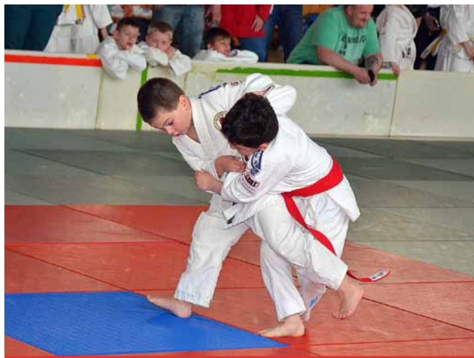
Postarat se o malé sportovce neznámá jen zajistit jim dostatečnou sportovní výbavu. Potřebují hlavně podporu.

Na semináři se rodiče i trenéři naučí, jak najít hranici mezi podporou a nátlakem. Seminář povedou sportovní psy-