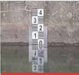
Ryska na měřáku hladiny je opět tam, kde má být.

Město Most muselo tuto oblíbenou rekreační vodní plochu nechat dopustit, neboť její hladina klesla o půl metru. Voda zmizela kvůli závadě na výpusti, kterou město loni opravilo, ale další se odpařila při vedrech. Z řeky Ohře se dopustilo přes 193,5 tisíc kubíků vody. Voda se začala dopouštět 31. července. Přivedla se potrubním přívaděčem a mostecká radnice za ni zaplatila necelé dva miliony korun. Průměrný denní objem napouštěné vody dosahoval asi 6,5 tisíc kubíků, což představuje na kótě hladiny asi 1,5 cm. (nov)