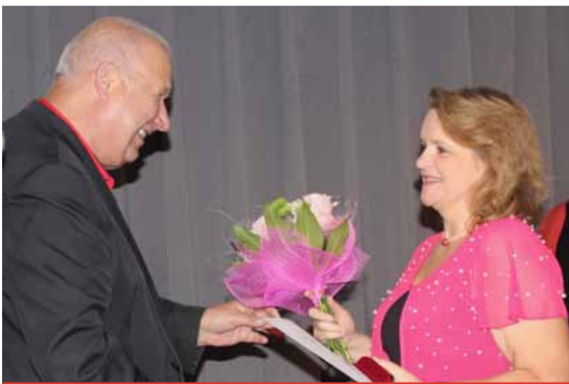
(nov) Mezi oceněnými dárci krve bylo i třináct žen.

Dárci byli oceněni Zlatým křížem II. třídy za 120 a více odběrů. „Jsem rád, že jsme se zde sešli v tak hojném počtu. Krev je věc, která se nedá nahradit, nedá se vyrobit. Proto si musí lidé vzájemně pomáhat. Kdo může a je zdravý, tak jsem rád, když dokáže pomoci tomu, kdo zrovna krev potřebuje. Darování krve je velmi ušlechtilá věc, mnohdy nedocenená. Proto bych chtěl poděkovat vám všem za to, co děláte,“ řekl hejtman Ústeckého kraje Oldřich Bubeníček. Pro letošní rok bylo oceněno 101 dárců z celého regionu, kteří měli přes 120 odběrů. Slavnostního odpoledne se zúčastnili také náměstek hejtmana Stanislav Rybák, zástupci Oblastního Červeného kříže Teplice a za Krajskou zdravotní Radek Scherfer, místopředseda představenstva společnosti.