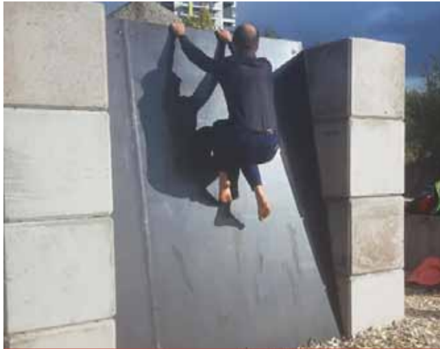
Parkour je novodobý sport, mezi mladými velmi populární. Dalo by se říct, že se jedná o něco jako městskou akrobacii. Salta přes zábradlí, překonávání překážek. Parkour je velmi prospěšný pro tělo, protože při něm si lidé procvičují prakticky všechny svaly v těle. Zdroj: www.wikipedia.org

Předpokládaná plocha hřiště je cca 22x15 metrů. Náklady na vybudování včetně stavebních úprav jsou téměř 3,1 milionu Kč včetně DPH. „Město hřiště vybuduje z vlastních prostředků. V letošním roce bude zpracována realizační studie a samotná realizace hřiště bude probíhat v roce 2020,“ dodal primátor Jan Paparega. (sol)