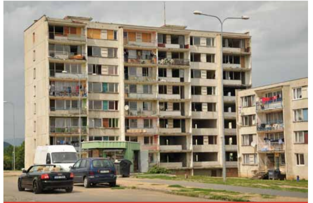
Blok 3 je už čtvrtým domem, který zde místní dovedli k absolutní devastaci a nezbyvá, než ho srovnat se zemí.

Konšel také rozhodli o ukončení dodávky tepla do bloku 3. „Nebude tam již zahájena topná sezona. Rodiny vystěhujeme do okolních bytů. Některé si našly své náhradní bydlení. Blok je téměř prázdný,“ podotkl náměstek a připustil, že město řeší jen jediného problematického nájemce, který se odmítá ze zdevastovaného domu odstěhovat. „Na byt, v němž bydlí, proběhly opakované žádosti