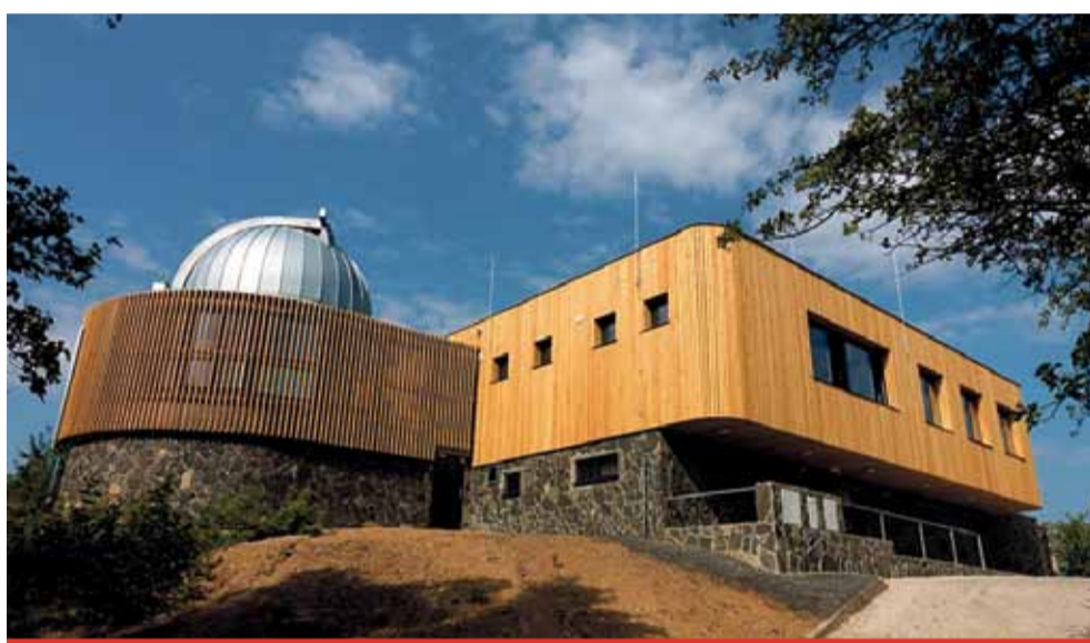
Stavbou roku Ústeckého kraje se stala Severočeská hvězdárna a planetárium Teplice.

Ústecký kraj finančně uhradil nákladnou rekonstrukci vítězné stavby. Na druhém místě se umístila revitalizace Palachovy ulice v Litoměřicích, třetí příčku obsadila revitalizace ústecké soukromé školky. Čestné uznání dostala rekonstrukce šluknovské radnice. Premiérový ročník akce s názvem Stavební fórum zorganizoval Ústecký kraj ve spolupráci s Okresní hospodářskou komorou Litoměřice, Svazem podnikatelů ve stavebnictví a Českou komorou autorizovaných inženýrů a techniků. (nov)