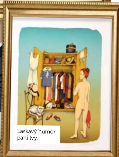
Laskavý humor paní Ivy.