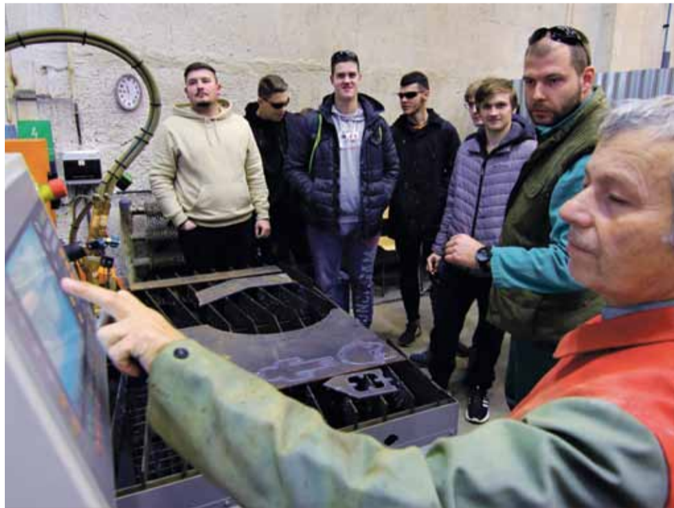
Studenti třetího ročníku maturitního oboru Střední technické školy Most si mohli své teoretické znalosti vyzkoušet v praxi.