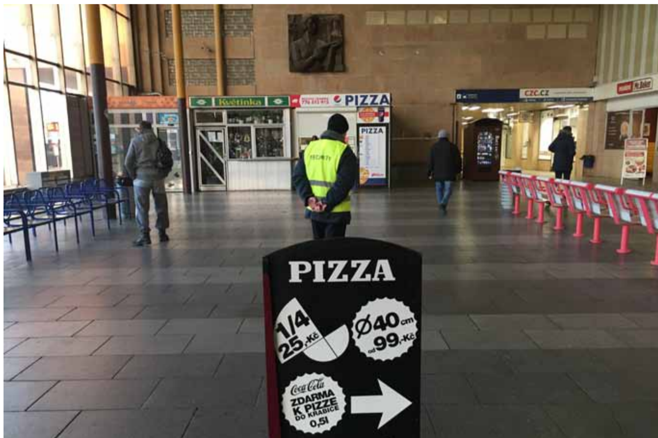
Nádražní hala v Mostě v současné době slouží spíš jako útočiště bezdomovců a opiců, než jako komfortní místo pro cestující.

Do budoucí podoby nádražní budovy a jejího částečného využití mohou zasáhnout i sami občané. „Odbavovací hala je prostorově předimenzovaná na stávající i výhledové počty cestujících. Pokud by měli občané smysluplný nápad na využití části prostor pro jiné účely, budeme za tyto podněty rádi,“ obrací se na veřejnost Radka Pistoriusová. str. 2