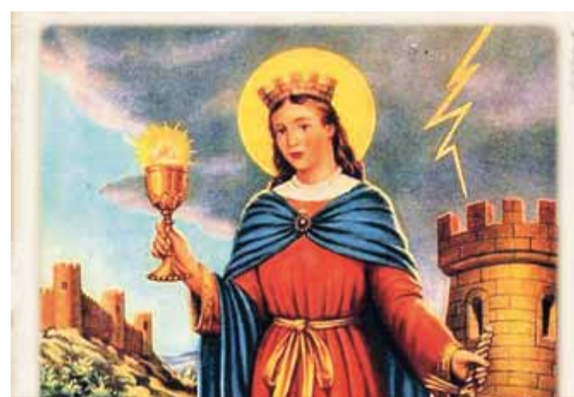
Svatá Barbora je uctívána jako ochránkyně proti smrti bleskem, požáry a vůbec před rizikem náhlé či násilné smrti, je proto patronka havířů, dělostřelců, pyrotechniků, architektů, matematiků a dalších rizikových povolání, a rovněž dětí.

Tradiční předávání světla svatě Barbory založil Spolek severočeských havířů asi před patnácti lety. Od té doby nebylo roku, kdy by patronka havířů se svým světlem nepředstoupila před představitele města Mostu. V Barborčině rouchu se za tu dobu vystřídal několik žen. (nov)