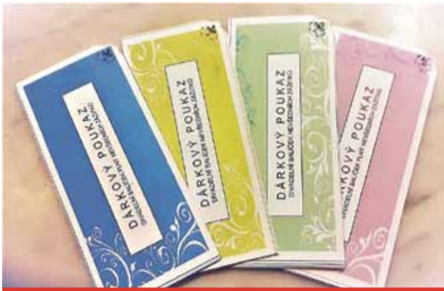
Darovat můžete divadelní zážitek.

Poukazy lze využít na inscenace mosteckého městského divadla i na dovozová představení podle vlastního výběru. Poukazy jsou cenově rozlišeny s platností po dobu jednoho kalendářního roku v hodnotě 350, 500, 700 a 1000 Kč. Dárkové poukazy jsou už nyní k zakoupení v obchodním oddělení divadla. (nov)