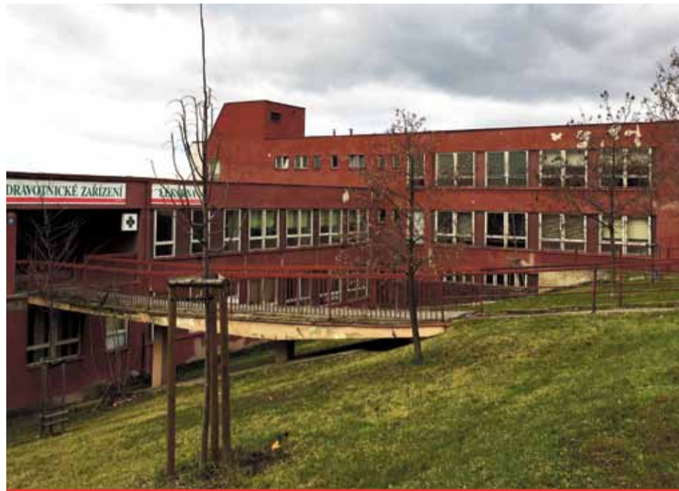
Soukromé komunitní centrum pro seniory se nelíbilo radním, zastupitelé jim dali za pravdu.