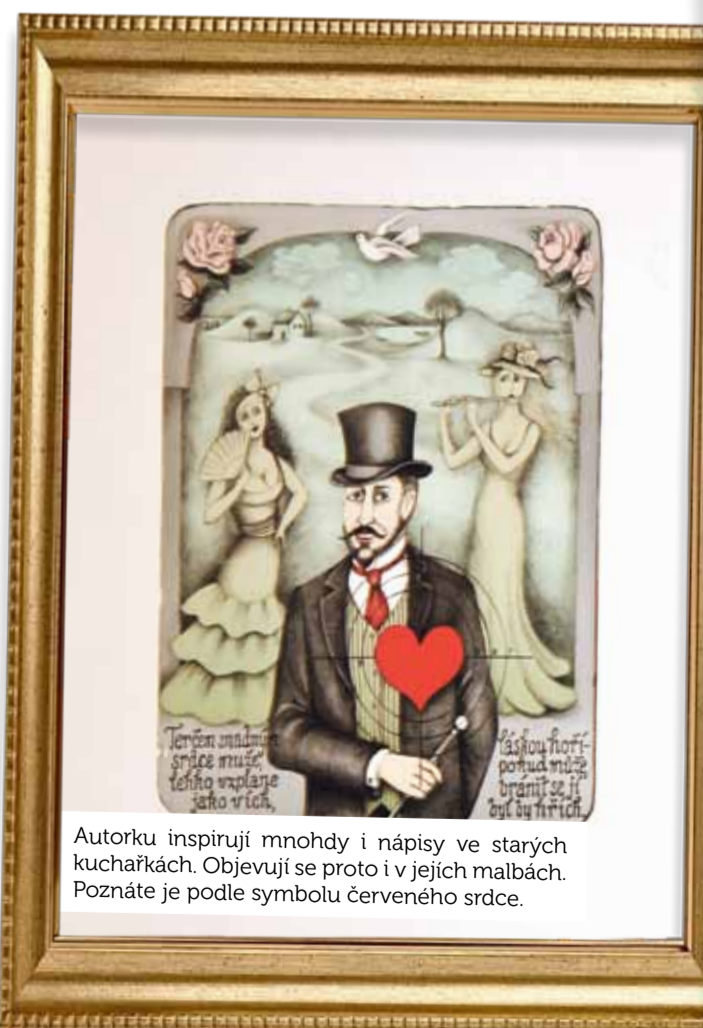
Autorku inspirují mnohdy i nápisy ve starých kuchařkách. Objevují se proto i v jejích malbách. Poznáte je podle symbolu červeného srdce.