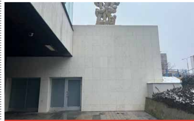
Veřejné toalety v pasáži U Lva jsou zavřené od roku 2022.

POZOR! UŽ JEN DO NEDĚLE 15. ÚNORA mohou obyvatelé Mostu posílat své nápadité návrhy do participativního rozpočtu Hejbní Mostem. Pokud máte nápad, jak zlepšit veřejný prostor v našem městě, máte poslední možnost. Na realizaci vítězných projektů je letos připraveno 4,5 milionu korun. Participativní rozpočet dává obyvatelům možnost přímo ovlivnit, jak bude Most vypadat a jak se v něm bude žít. Zatím je přihlášeno 25 návrhů. Své nápady můžete posílat prostřednictvím webu www.hejbnimostem.cz anebo odevzdat osobně na Magistrát města Mostu, 1. patro, číslo dveří 115.