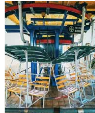
Lanovka má šedesát dvoumístných sedaček a převáží i jízdní kola.