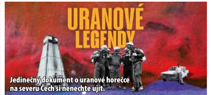
Jedinečný dokument o uranové horečce na severu Čech si nenechte ujít.