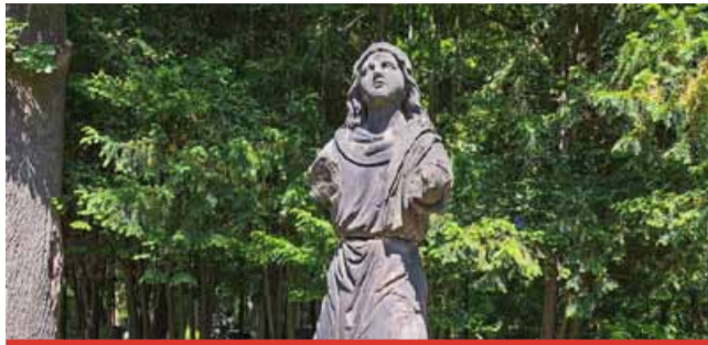
Socha anděla před převozem do restaurátorské dílny. Po opravě bude opět významným a vzácným historickým prvkem Městského hřbitova v Mostě.