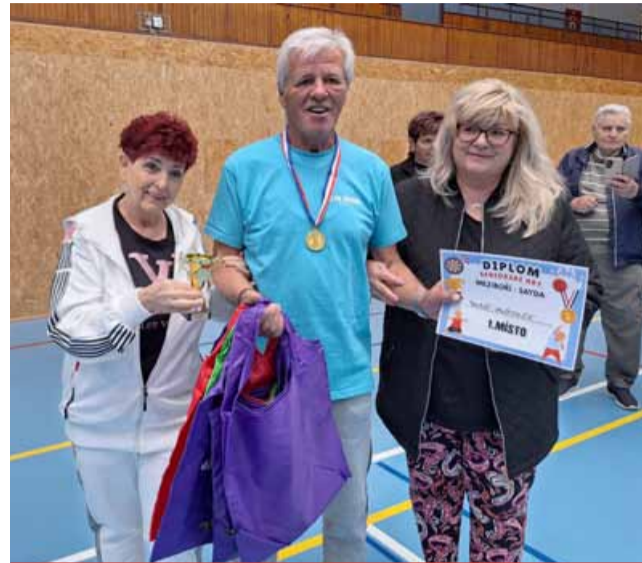
Mezibořský klub seniorů pořádá Mezinárodní seniorské sportovní hry Meziboří za účasti seniorů ze Saydy.

Činnost klubu je financována z členských příspěvků a z podpory z rozpočtu města Mezi-