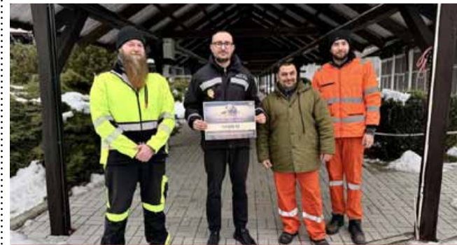
Za peníze se pro pejsky pořídí pohodlnější klece.