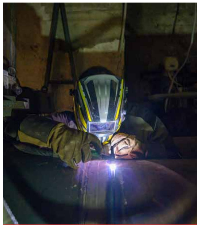
Jen během loňského adventu vyjžděli servisní technici Severočeské teplárenské k opravám zařízení bezmála čtyřicetkrát. Lidé však zůstali bez tepla pouze jedenkrát, a to na několik málo hodin. Zbytek poruch většinou ani nezaznamenali.

Výhody centrálního zdroje tepla si mezi prsty nechalo proklouznu vedení Kladna. Tamní teplárna pro Kladno vyrábí teplo a teplou vodu z uhlí z mosteckých hnědouhelných lomů, stejně jako komořanská teplárna. V minulém týdnu oznámilo vedení kladenské teplárny, která patří do skupiny Sev.en Česká energie, že od konce března s výrobou tepla končí. „Energetický