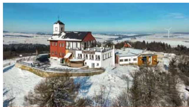
Rozhled z Komáří vížky patří nejen k nejkrásnějším v Krušných horách.