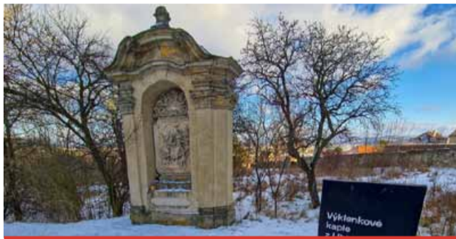
Opravu potřebuje kaple Obřezání Krista a Útěk do Egypta.