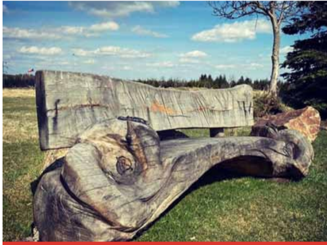
Velmi populární byla letos nabídka Krušných hor.