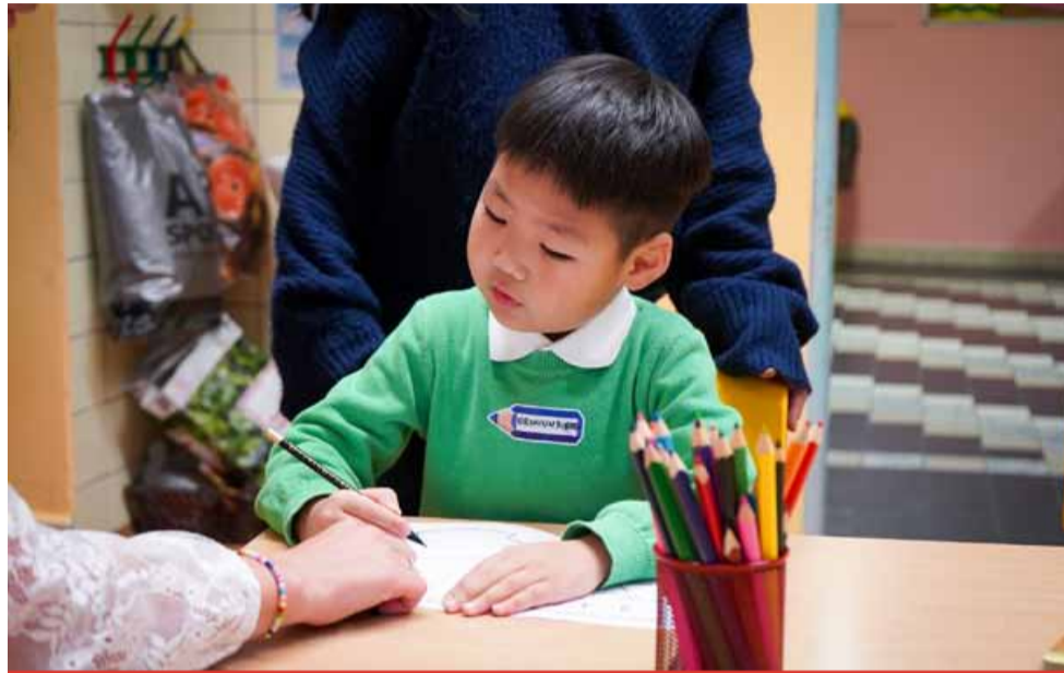
V současné době eviduje město 190 mongolských a 293 ukrajinských žáků na základních školách,

V současné době eviduje město 190 mongolských a 293 ukrajinských žáků na základních školách, mateřské školy v Mostě navštěvuje 63 ukrajinských a 65 mongolských dětí. Právě tyto národnosti patří k nejpočetnějším na území města. Počty dětí cizinců se na jednotlivých školách různí. Na některých s nimi velmi aktivně pracují, mezi iniciativní patří například 18. ZŠ. V Mostě se rozšiřuje především mongolská komunita. Většina rodičů mongolských dětí je zaměstnaná především v průmyslové zó-