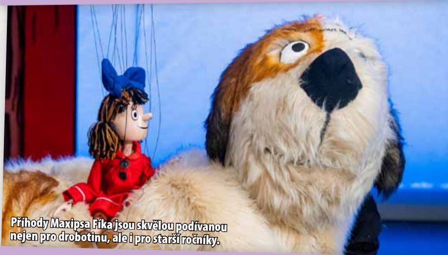
Příhody Maxipsa Fíka jsou skvělou podívanou nejen pro drobotinu, ale i pro starší ročníky.