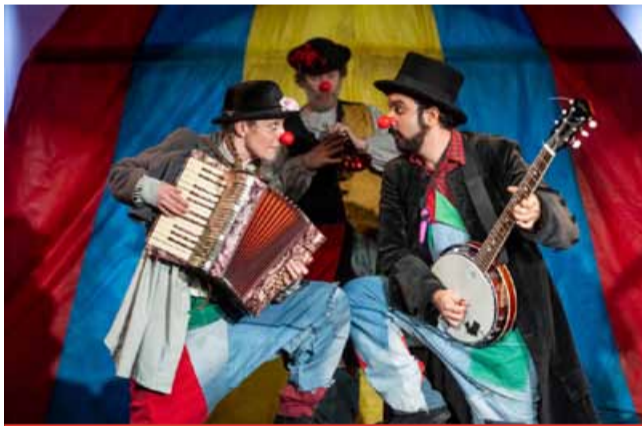
Dramacentrum pomůže mladým divákům lépe porozumět divadlu i otázkám, které přináší současný svět, a zároveň jim umožní zažít divadlo aktivně, nikoli jen z hledíště.