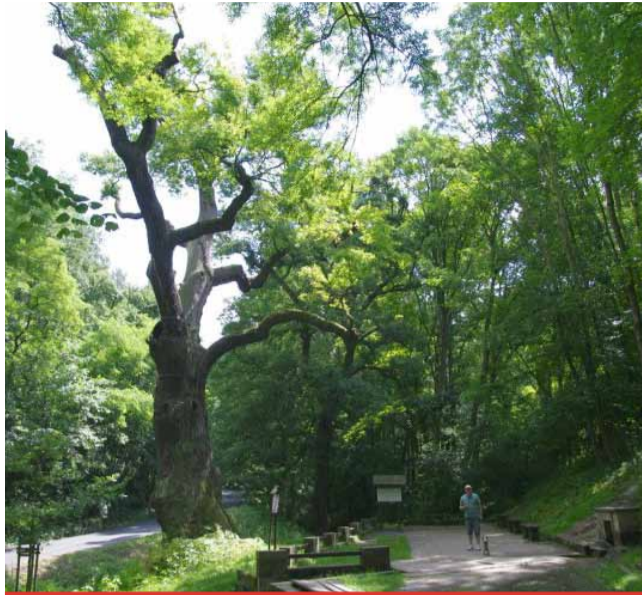
Oldřichův dub z Peruce je jeden z neznámějších památných stromů v České republice.