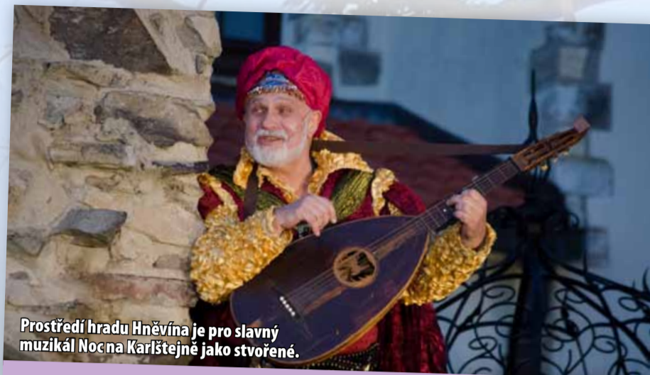
Prostředí hradu Hněvína je pro slavný muzikál Noc na Karlštejně jako stvořené.

V případě, že bude odehrána alespoň polovina představení, vstupné se NEVRACÍ.