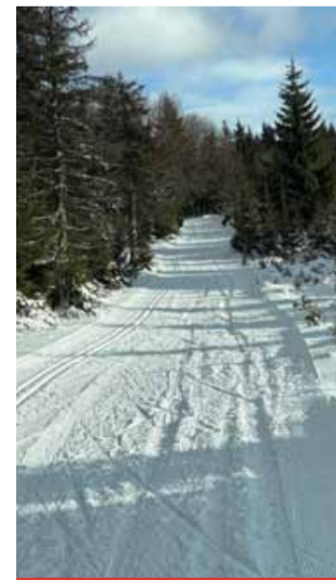
Od 1. ledna 2026 hrozí za úmyslné zničení upravené trasy nejen v Krušných horách pokuta až 30 000 Kč.