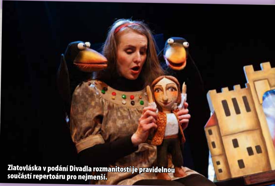
Zlatovláska v podání Divadla rozmanitosti je pravidelnou součástí repertoáru pro nejmenší.