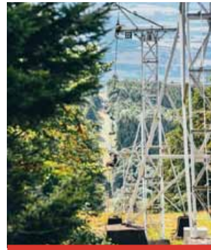
Oblíbená atrakce výletníků – svezení nejstarší osobní visutou lanovou dráhou v Česku – bude mít tříměsíční přestávku.

Lanovka má šedesát dvoumístných sedaček a převáží i jízdní kola. Je dlouhá 2348 metrů s převýšením 480 metrů. Jízda trvá 15 minut. Dráha vás vyveze z dolní stanice v Krupce do horní stanice u Komáří vížky. Při jasném počasí výhled stojí za to. Je vidět na Krušné hory, České středohoří i okolní města.