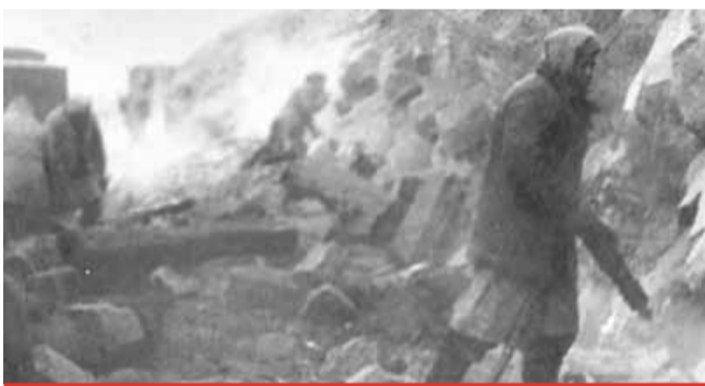
Podmínky pro ženy v sovětských gulazích byly brutální – a v některých ohledech ještě těžší než pro muže.