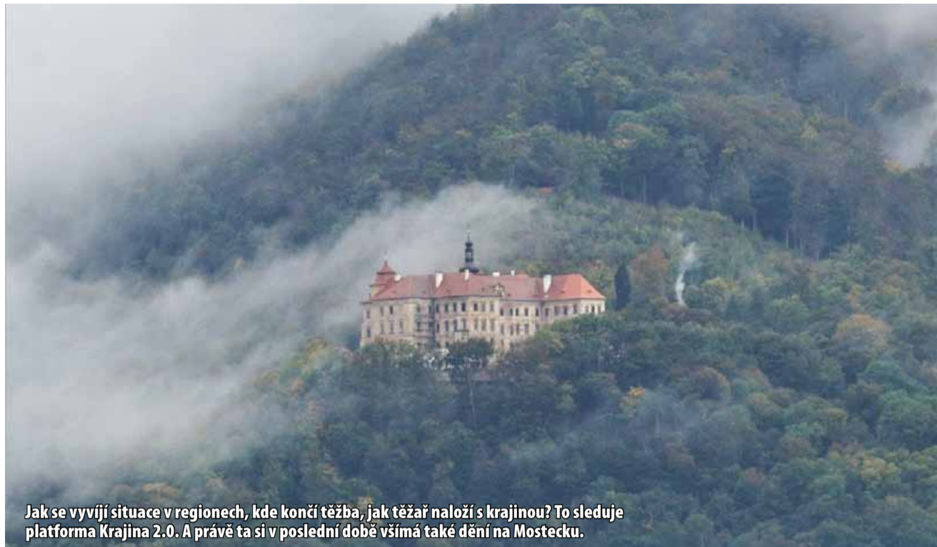
Jak se vyvíjí situace v regionech, kde končí těžba, jak těžař naloží s krajinou? To sleduje platforma Krajina 2.0. A právě ta si v poslední době všimá také dění na Mostecku.

Protože se ale cena pozemků i po čtyřech znaleckých posud-