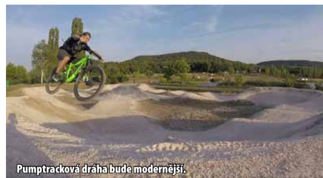
Pumptracková dráha bude modernější.