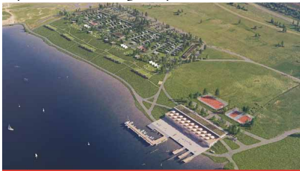
Pokud vše půjde podle předpokladů, kemp by se mohl začít stavět v roce 2028. Prvním návštěvníkům by se pak měl otevřít v roce 2029.

Zveřejněná studie počítá s tím, že kemp nabídne 104 stání pro karavany, rozdělených do několika velikostních kategorií. Doplní je plochy pro stanování, deset sezónních chatek a dvacet celoročních chatek, které budou sdruženy do pěti objektů zapuštěných do terénu se zelenými střechami. „Jedná se o jeden z hlavních projektů, které v okolí jezera chystáme. Chceme mít vše projekčně připravené, abychom ve chvíli, kdy budeme mít pozemky kolem jezera k dispozici, zbytečně ne-