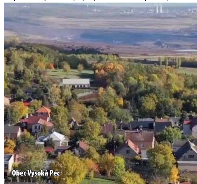
Obec Vysoká Pec

paň, která ve finále nepoškozuje ani tak těžaře jako nás obce. My s darem počítáme už od loňského roku a potřebujeme vědět,