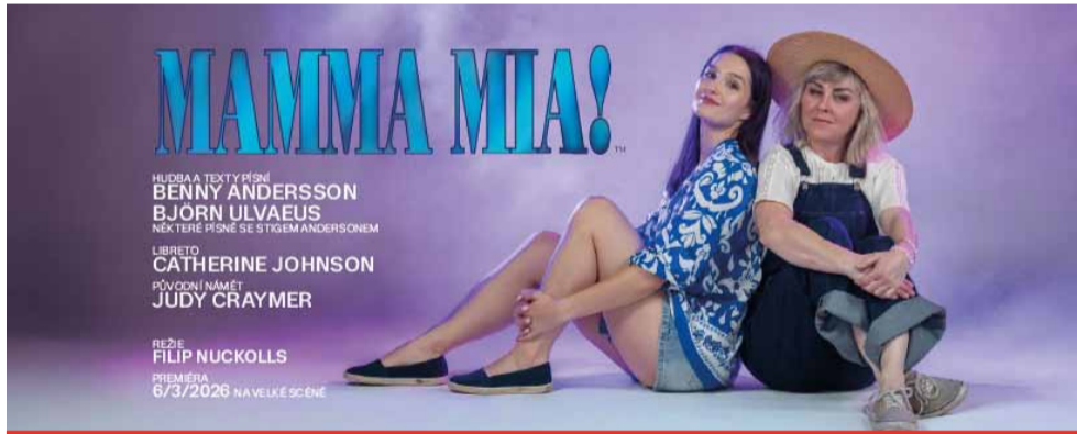
Mamma Mia! v Mostě slibuje být jednou z největších divadelních událostí sezony.

Přípravy jednoho z nejúspěšnějších světových muzikálů všech dob - Mamma Mia! V mosteckém divadle jdou do finále. Podle ředitele mosteckého divadla a zároveň režiséra tohoto divadelního kusu se diváci mohou těšit na energickou hudební show plnou nestárnoucích hitů legendární skupiny ABBA, emoci, humoru i romantiky pod taktovkou zkušeného tvůrčího týmu. „Mamma Mia! je titul, který spojuje generace. Nabízí silný příběh o lásce, rodině a hledá-