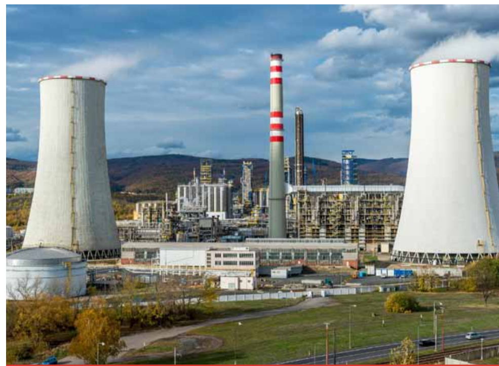
Přes pokračující složité makroekonomické podmínky ORLEN Unipetrol investoval 10,8 miliardy korun.

Přes pokračující složité makroekonomické podmínky ORLEN Unipetrol dál investuje do modernizace výrobních technologií a maloobchodní sítě. „Opět jsme zaznamenali pozitivní výsledky v maloobchodním prodeji. V České republice, na Slovensku i v Maďarsku jsme zvýšili náš tržní podíl více, než jsme naplánovali. Na všech třech trzích jsme rovněž meziročně zvýšili prodej pohonných hmot přibližně o 150 milionů litrů. Úspěšně jsme také v naší síti čerpacích stanic zavedli prodej nízkoeemisního paliva HVO100, zahájili jsme realizaci strategie rychlonabíjení elektromobilů založené na řešení pod značkou ORLEN a významně jsme rozšířili sortiment nepalivového prodeje a našich privátních značek,“ uvedl Mariusz Wnuk, generální ředitel skupiny ORLEN Unipetrol. Hospodářské výsledky přitom zásadně ovlivnil masivní výpadek elektrického proudu na území České republiky. ORLEN Unipetrol musel na začátku července přerušit na bezmála čtyři týdny provoz v litvínovské rafinerii.