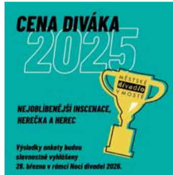
Výsledky ankety budou slavnostně vyhlášeny 28. března v rámci Noci divadla 2026.