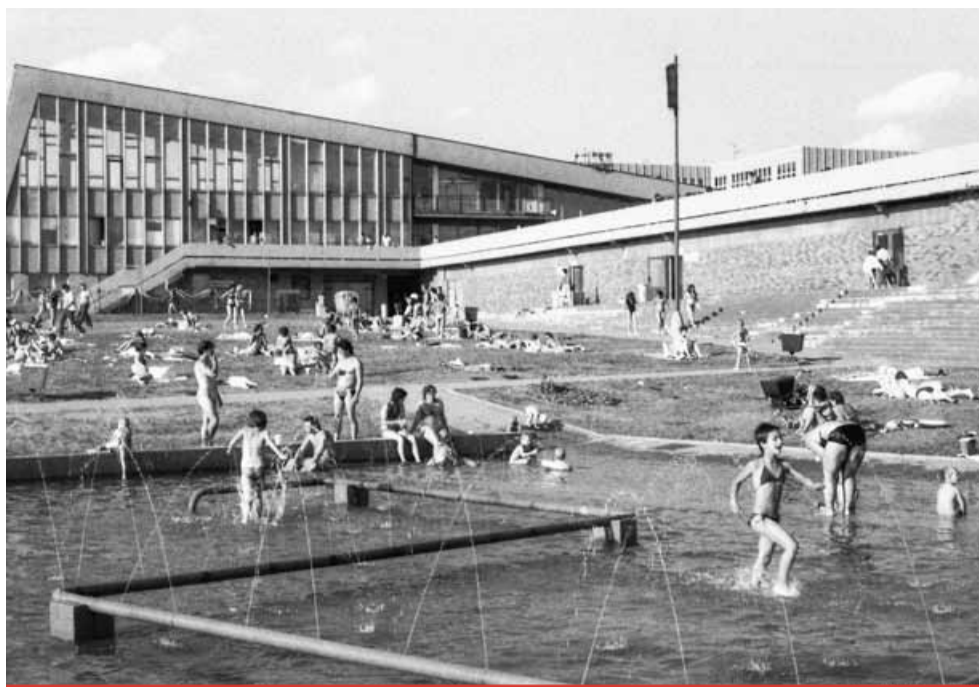
Mostecké termální koupaliště vzniklo v roce 1976. Bylo vyhříváno s velkým venkovním bazénem a skokanskou věží. V roce 2003 zde vznikl moderní Aquadrom.

Letos by například měla být vyměněna kopule tobogánu a atrakce by měla dostat i nové nerezové schodiště. Už vloni se instalovala nová vířivá vana a aktuálně se řeší brouzdaliště. Přemýšlí se také o vylepše-