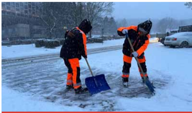
Lidé z úřadu práce a na veřejně prospěšné práce udělají pro technické služby kus práce.