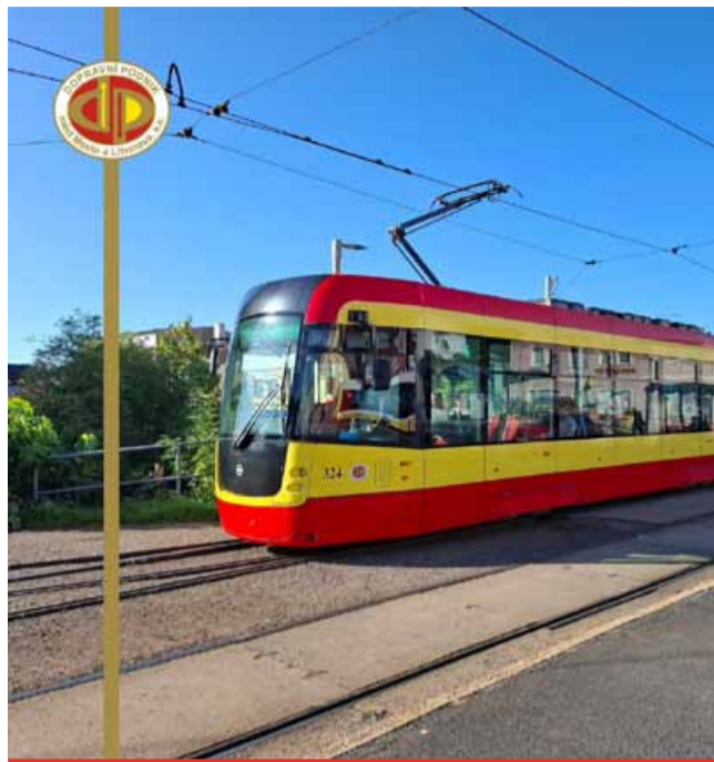
Od půlnoci 2. března přestanou jezdit tramvaje v úseku Litvínov, Citadela – Záluží, Chemopetrol.