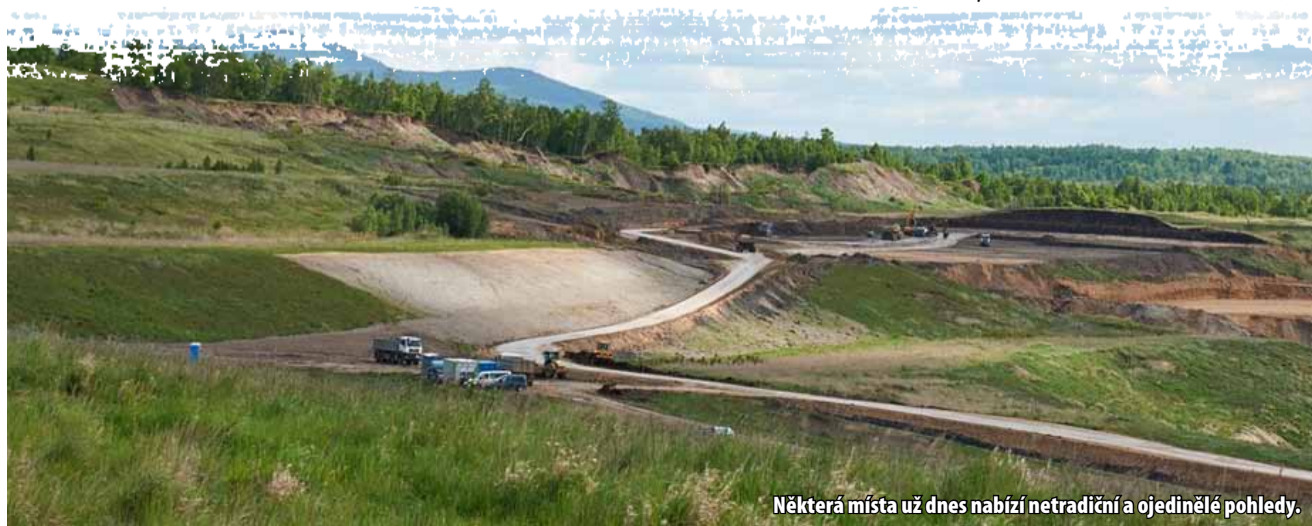
Některá místa už dnes nabízí netradiční a ojedinělé pohledy.

ně si tedy spoří peníze na základě poplatku z každé vytěžené tuny, v tomto případě hnědého uhlí. „Všechny naplánované akce v rámci sanace a rekultivace mezi lety 2016 až 2022, stejně tak i po tomto období, se nám podařilo dokončit a lidé si je už mohou prohlédnout v otevřené části lomu. V jarních měsících plánujeme otevřít i další část lomu, a tak si turisté budou moci rekul-