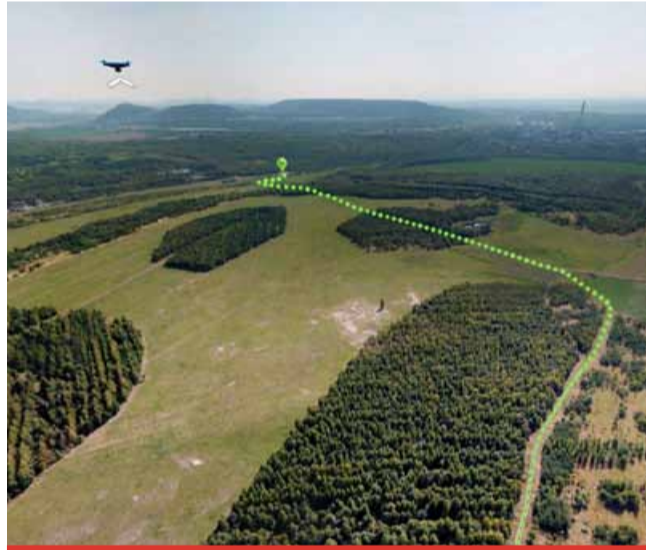
Místa, kde stojí za to chvíli se zastavit a dobře se rozhlédnout. Interaktivní mapu si můžete stáhnout do svých chytrých telefonů.

nika lomu nejsou patrné na první pohled. Lidé si více všimají rekultivací, tedy toho, co se odehrává na povrchu po vymodelování terénu. Výsadby nových lesů, kvetoucích luk, mokřad, nebeských jezírek či vodních nádrží. A všudypřítomného života,“ přiblížila práce, které změnila vytěžený lom ČSA, mluvčí skupiny Sev.en Česká energie Eva Maříková.