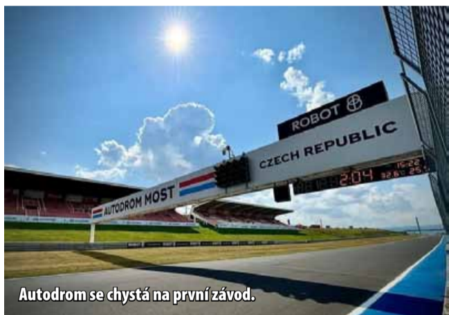
Autodrom se chystá na první závod.

Endurance Cup pořádá skupina zkušených závodníků, kteří se motorsportu věnují už od roku 2000 a mají za sebou desítky závodů na motorkách i v autech doma i v zahraničí. Hlavním cílem série je zachovat přátelskou, téměř rodinnou atmosféru a nabídnout možnost vytrvalostního závodění za dostupnou cenu. Součástí projektu je také základní poradenství pro začínající jezdce, kteří se chtějí poprvé pustit do endurance závodů. Vstup pro diváky je zdarma. (nov)