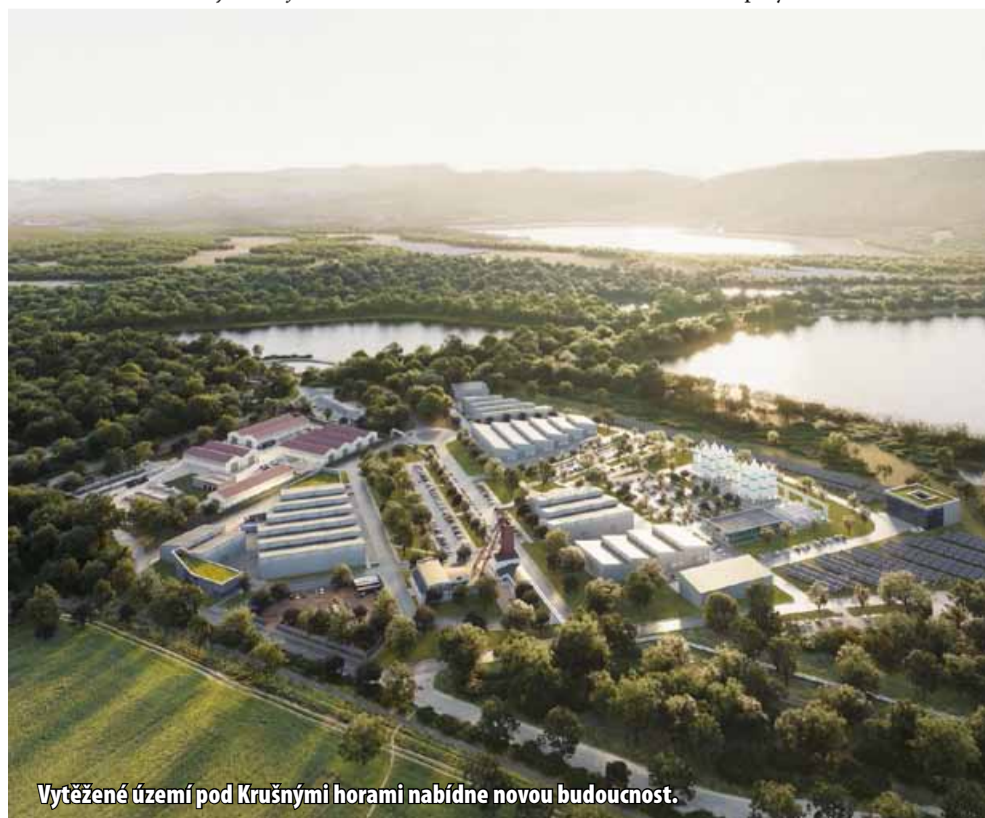
Vytěžené území pod Krušnými horami nabídne novou budoucnost.

cích zdá být přeci jen vysoká, v krátké době by měl být vypracován pátý, opět nezávislý znalecký posudek, jenž definitivně rozhodne o konečné ceně pozemků, které těžař státu v národní přírodní památce prodává. „V souvislosti se stanovením výše daru je třeba odlišit úsporu za již provedené rekultivace mezi roky 2016-2022 a úsporu za ušetřené práce v území jádrové zóny, tedy v části, kde bude klasická rekul-