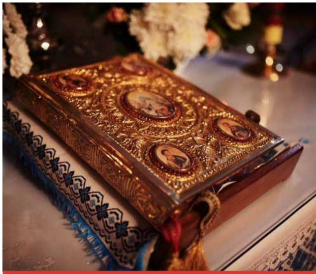
Některé knihy byly veřejnosti dosud nedostupné.