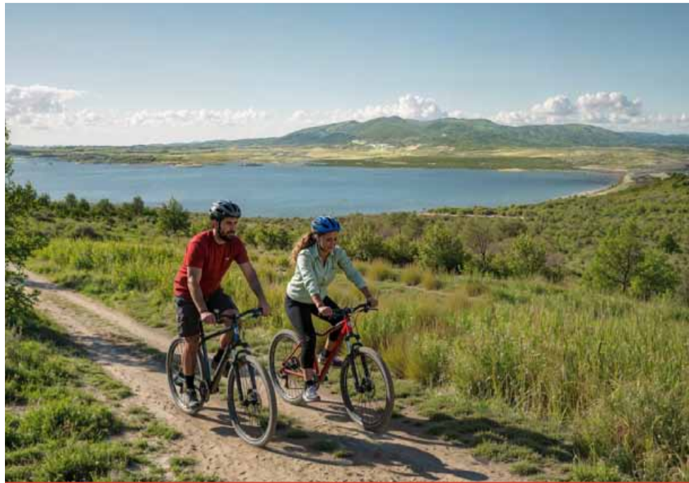
Cestou budete projíždět novodobou divočinou, tedy místy, kde stojí za to chvíli zůstat a rozhlédnout se.

Místa, kde hlavní část prací v rámci sanace a rekultivace probíhala v letech 2016 až 2022, dnes nabízí netradiční a ojedinělé pohledy, procházky či projíždky na kole. „Součástí sanací je především přesun ohromných objemů zeminy, modelace krajiny a vytváření nových terénů. To je zásadní objem prací, které se v těchto letech prováděly a které byly naplánovány už před tím, než tu těžba vůbec začala. Jsou to práce velmi důležité a nezbytné, i když pro návštěv-