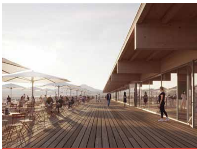
Hlavní objekt u vjezdu bude sloužit jako recepce, obchod a kavárna.