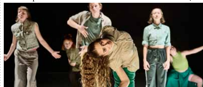
Představení Hi Mom! zatančí v rámci přehlídky Spiramento studentstvo 3. ročníku konzervatoře Duncan Centre.