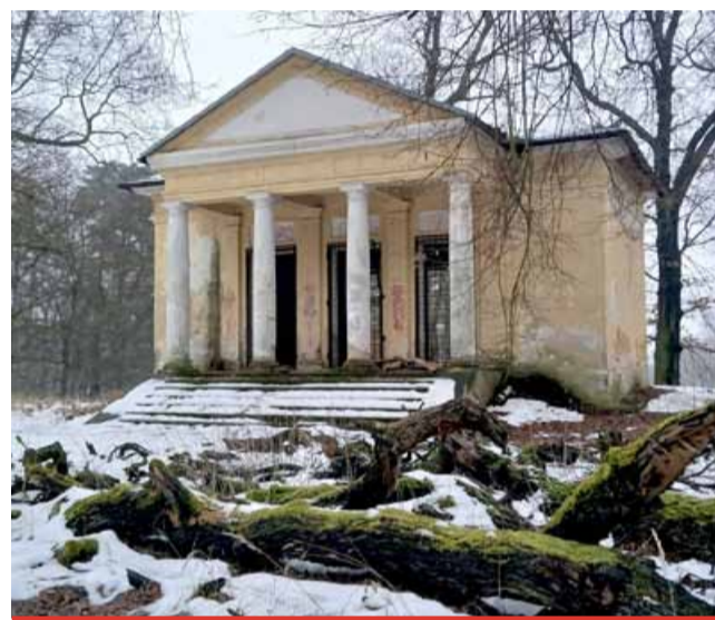
Bývalý lovecký altán, známý také jako templ, postavený za doby vlády šlechtického rodu Hohenlohe, stojí na kopečku kousek od vstupu do obory ve směru od zámku.

Městská správa sociálních služeb v Mostě hledá zaměstnance na pozici