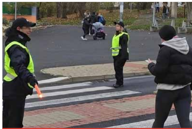
Na asistentky prevence si lidé zvykli.

a pomáhaly zabezpečit nejrůznější akce v rámci prevence kriminality v celém Litvínově. Zajišťovaly asistenci terénním sociálním pracovníkům v problémových rodinách a naopak lidem v tísní pomáhají zprostředkovat kontakty s těmito pracovníky. A nezapomínají ani na kontakt se seniory. „Během tříletého projektu se asistentky prevence kriminality staly výrazným prvkem v zajištění bezpečnosti ve městě. Budeme proto