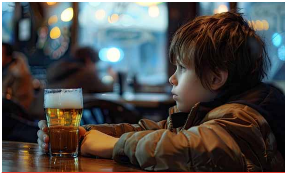
Až 40 procent středoškoláků už někdy pilo alkohol a 15 procent vyzkoušelo THC.

Při přijetí mladistvého máme oznamovací povinnost, kterou nám ukládá zákon o sociálně právní ochraně dětí a zákon o zdravotních službách. Musíme prolomit povinnou mlčenlivost a informovat OSPOD