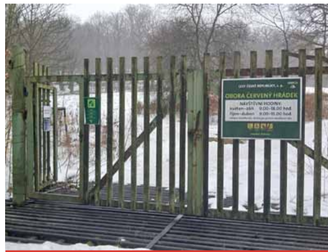
Cedule s návštěvními hodinami u vstupu do obory během března zmizí stejně jako zbytek plotu a otevře se tak les o rozloze 280 hektarů.

Oboru na úpatí Krušných Hor vybudoval ve druhé polovině 19. století šlechtický rod Buquoyů nedaleko zámku Červený Hrádek, aby zde mohl chovat jelení a daňčí zvěř. V roce 1898 zámek získal rod Hohenlohe, který nechal oboru kvůli poškozenému oplocení zrušit. Po druhé světové válce přešla lesní část pod správu státních lesů a v roce 1986 bylo rozhodnuto o výstavbě nové obory. Ta byla v listopadu 1989 uznána pod názvem Oboře Červený Hrádek.