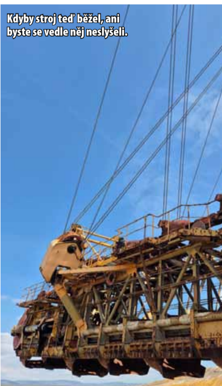
Kdyby stroj teď běžel, ani byste se vedle něj neslyšeli.