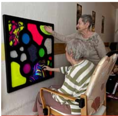
Taktilní panel má pro seniory velký význam.

Taktilní panel pro seniory je speciálně navržené ovládací nebo orientační zařízení, které využívá dotek tak, aby bylo snadno použitelné i pro lidi se zhoršeným zrakem, jemnou motorikou nebo pamětí. Klienti je mohou využívat během dne podle své potřeby – k procvičení rukou, zapojení smyslů i ke zklidnění. „U osob s kognitivním omezením mají tyto pomůcky velký význam. Pomáhají zmírnit neklid, odvést pozornost od úzkosti a často usnadňují i kontakt s okolím. Panely se postupně stávají běžnou součástí prostředí i každodenního života klientů,“ vysvětlil ředitel MSSS Most Luboš Trojna. Panel typicky obsahuje často vystouplá velká tlačítka, různé tvary nebo textury, aby šly rozlišit hmatem, kontrastní barvy pro zbytek zraku, jednoduché symboly nebo popisky a někdy i hlasovou odezvu.