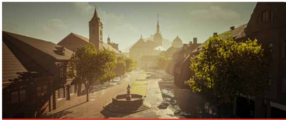
Díky virtuální realitě se můžete teleportovat do zmizelého královského města Mostu.