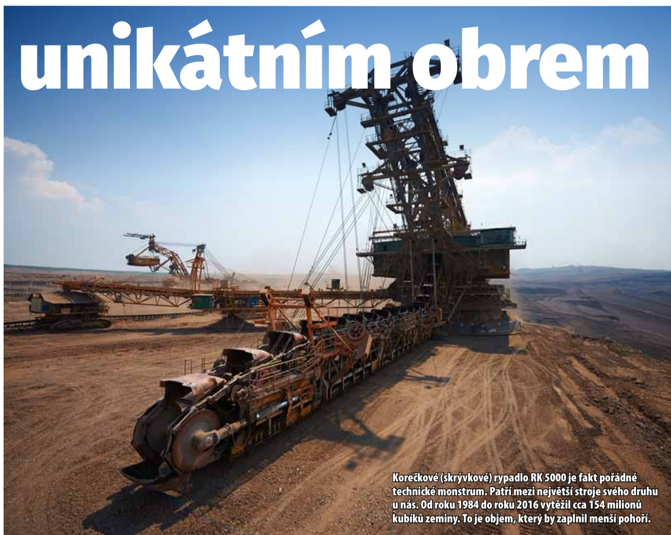
Korečkové (skrývkové) rypadlo RK 5000 je fakt pořádné technické monstrum. Patří mezi největší stroje svého druhu u nás. Od roku 1984 do roku 2016 vytěžil cca 154 milionů kubíků zeminy. To je objem, který by zaplnil menší pohoří.

Velkostroj přímo na místě v lomu ČSA stavěli dělníci po částech tři roky. Nyní ho budou rok po částech rozebírat. V květnu část stroje demoliční firma odstřelí. Virtuální prohlídku velkostroje RK 5000 si můžete prohlédnout v aplikaci BIOSAFARI nebo na webových stránkách Uhlénoho safari. (ink)