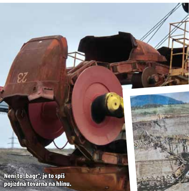
Není to „bagr“, je to spíš pojízdná továrna na hlinu.