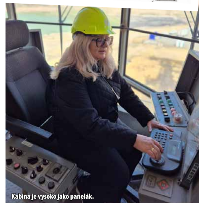
Kabina je vysoko jako panelák.