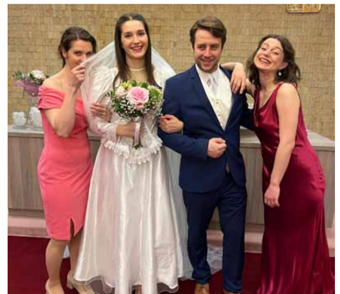
„Než hvězdy zapadnou“ je skvěle napsaná svatební komedie plná humoru a emocí.