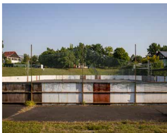
Hokejbalisté a basketbalisté si ještě letos budou užívat modernější sportoviště.

jedná o jedno z nezanedbanějších sportovišť, jsem velmi ráda, že se ho podařilo prosadit do programu žádostí o dotace. Na jeho modernizaci se městu podařilo získat dotační prostředky z programu Operační program spravedlivá transformace - rekonstrukce a budování sportovišť, a to ve výši třiceti procent z celkového rozpočtu,“ uvedla radní pro dotace Jana Falterová Zudová (ANO) a dodala: „Díky tomu, že se jedná pouze o obnovu a nenáročné úpravy, práce by se měly stihnout dokončit ještě během léta.“ Hřiště