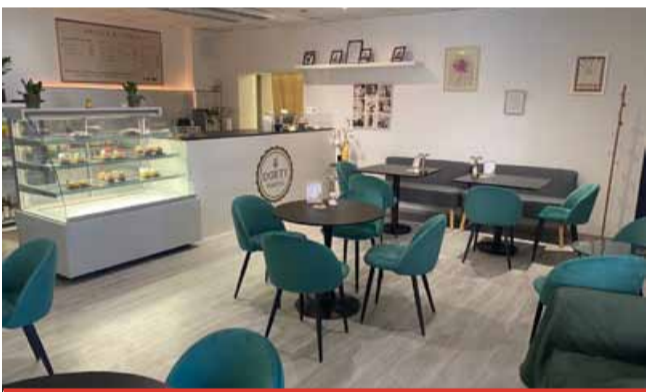
Nová cukrárna Marina.

MOST - Cukrárna Marina pod terasami mosteckého magistrátu (v rohu vedle bývalé půjčovny svatebních šatů) vyrábí skvělé dorty a zákusky. Paní cukrářka se nyní rozhodla vedle výroby nabídnout i posezení. K zákusku si můžete v nové otevřené cukrárně samozřejmě objednat i dobré kafe, čaj nebo nealko. Otevřeno je v úterý a ve středu od 9 do 17 hodin, ve čtvrtek a v pátek od 10 do 18 hodin a v sobotu od 14.30 do 18 hodin. (nov)