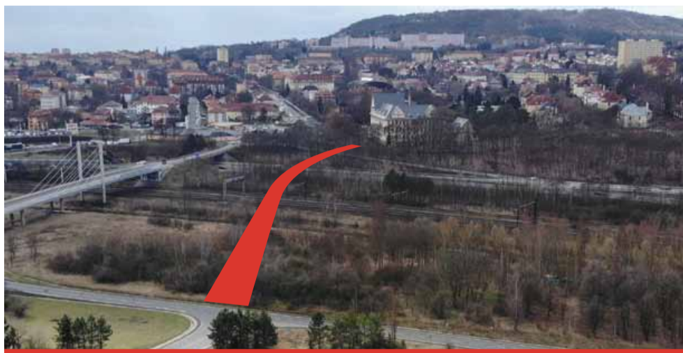
MO-JE lávka (MOst - JEzero) bude muset překonat rychlostní silnici, železniční a tramvajovou trať i řeku.

Přesný harmonogram prací ještě v tuto chvíli není stanoven, ale předpokládá se, že akce bu-