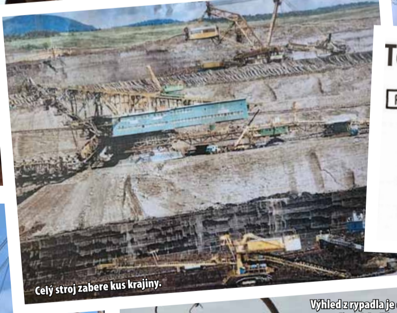
Celý stroj zabere kus krajiny.