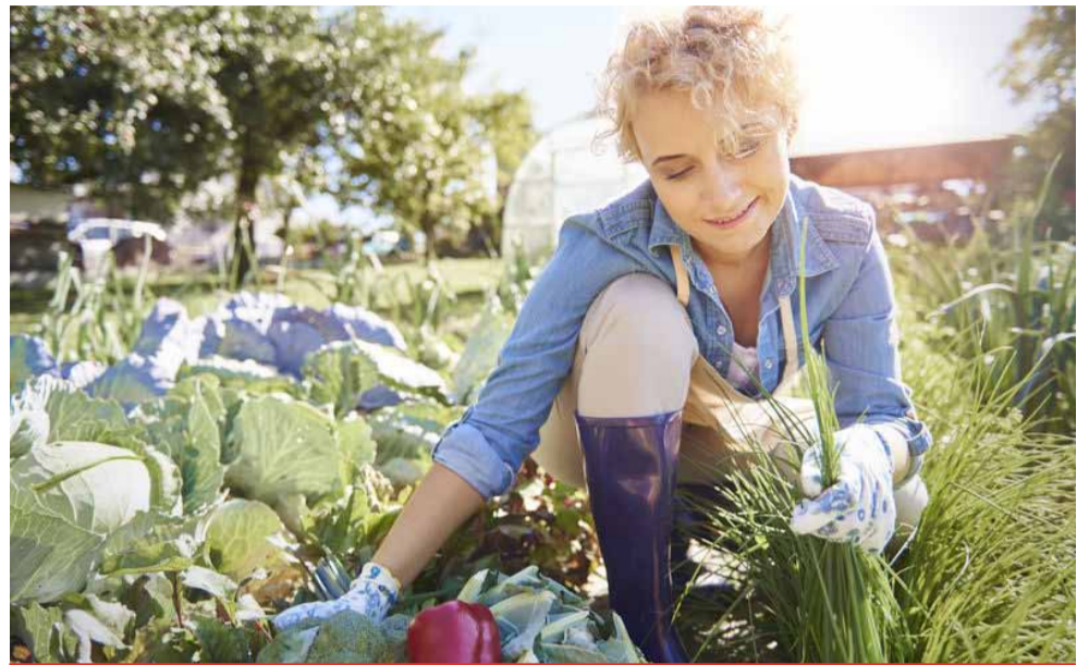
Představa města, že si lidé budou na pronajatých zahrádkách pěstovat zeleninu a ovoce, se májí účinkem.