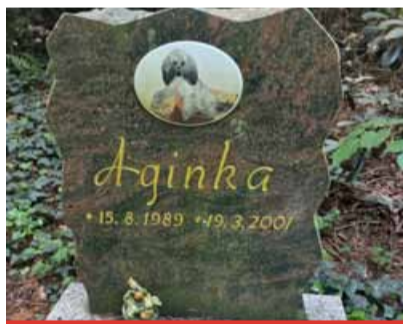
O zvířecím hřbitově se mluví ve městě už dlouhá léta. Poptávka je ale postupem let stále větší.

V současné době se řeší možnost spolupráce s firmou, která se touto oblastí zabývá, a zajistila by obdobnou službu i pro město Most. Že by lidé měli zájem o takovou službu, svědčí i snahy soukromníků, kteří chtějí zvířecí hřbitov vybudovat nedaleko Hrabáku, poblíž tamního lesíka. Nepodařilo se ale vyjednat pozemek, který patří do vlastnictví Palivového kombinátu. „Lidé se snaží i samovolně, konkrétně za zdí u kos-