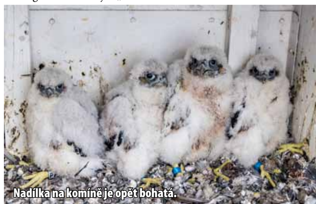
Nadílka na komíně je opět bohatá.

Spolek přátel historie Litvínovska pořádá poznávací soutěž