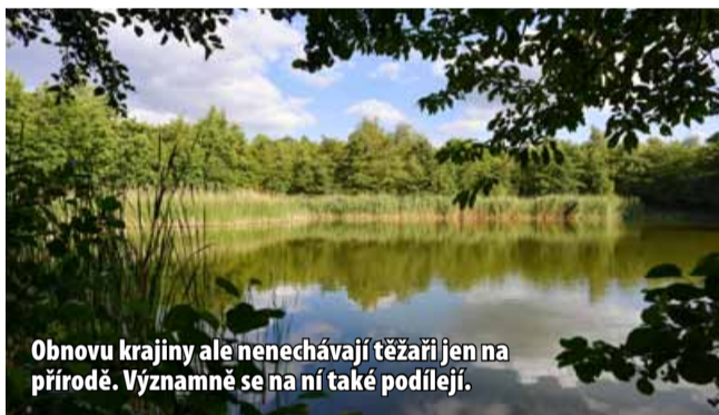
Obnovu krajiny ale nenechávají těžaři jen na přírodě. Významně se na ní také podílejí.

Pozorovat budou moci návštěvníci nejen změny v krajině, které především na plochách přirozené obnovy nemají jinou v Evropě obdoby a jsou cen-