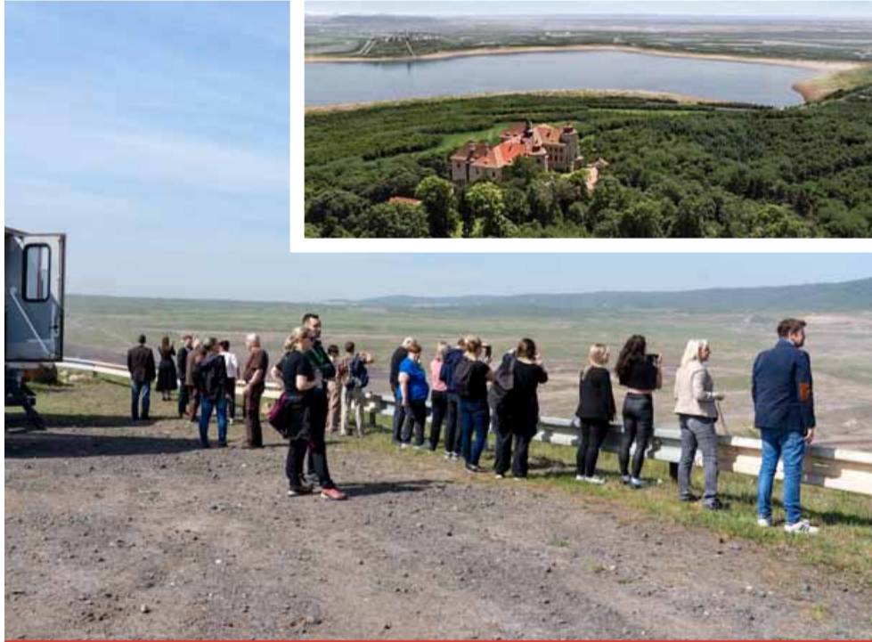
Během konference mohli návštěvníci diskutovat o budoucnosti krajiny, ale také si například přímo na místě díky virtuální realitě prohlédnout, jak to jednou bude okolo nového jezera vypadat a krajinou se alespoň virtuálně projít.

První den byl věnován odborné veřejnosti. Program druhého dne konference byl určený pro