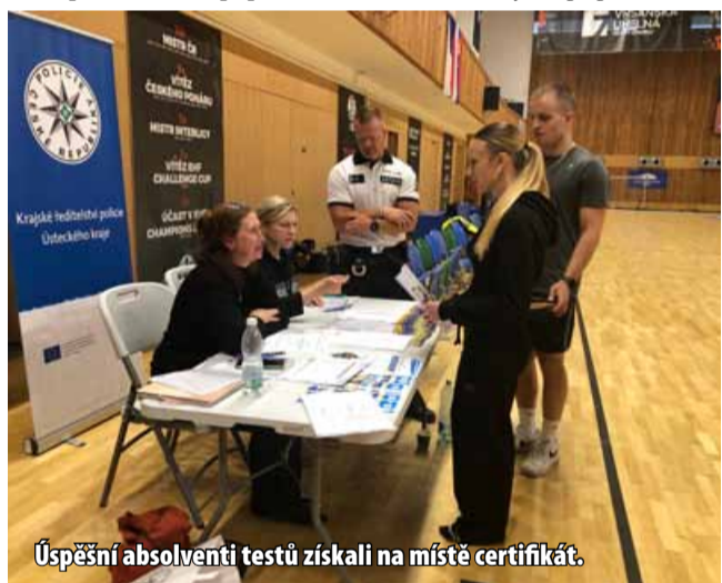
Úspěšní absolventi testů získali na místě certifikát.

ně štěstí při plnění testu. „Dnes si vyzkoušíte, zda máte na to, stát se policistou České republiky. Pokud dosáhnete stanovený limit minimálně 36 bodů, získáte certifikát o úspěšném absolvování testu. Ten vás opravňuje k tomu, že po dobu jednoho a půl roku nemusíte již v případě nástu-