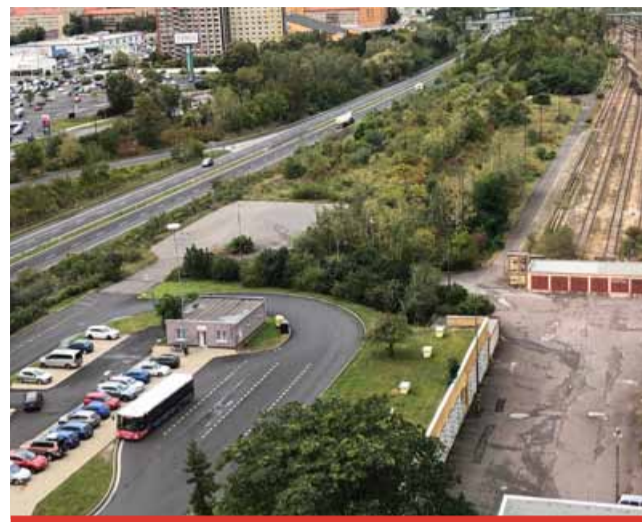
V tomto místě vznikne nové autobusové nádraží pro mimoměstské linky.

„Dotaci se nám podařilo vyjednat vyšší než původně, kdy jsme měli získat jen 47 milionů korun. Dosáhneme až na 62 milionů korun,“ uvedla radní Jana Falterová Zudová. Právě kvůli dotaci si město musí pospíšet. Musí ale také řešit, kam umístí náhradní stanoviště pro autobusy MHD. „Počítáme, že by se všechny autobusy během akce přemístily na Rudolickou. Budeme s dopravním podnikem řešit možné varianty,“ uvedl primátor. To ale bude znamenat pro obyvatele značnou zátěž.