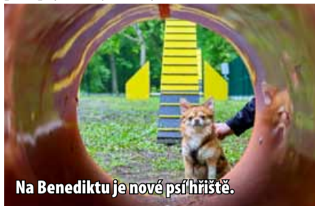
Na Benediktu je nové psi hřiště.

Travnatá plocha je o velikosti zhruba tří tisíc metrů čtverečních. Park je oplocen téměř dvoumetrovým plotem. Na hřišti jsou také umístěny psi koše a sáčky na exkrementy, lavičky na posezení a pítka. Nechybí tu také agility překážky, ale také dostatečný psi výběh. „V Mostě sice jedno agility hřiště je, ale jedná se o soukromé hřiště, kde si za používání překážek musíte zaplatit, a to mi v dnešní době přijde pro některé obyvatele nereálné a určitě bezplatné psi hřiště ocení,“ podotýká jedna z autorek projektu a k návrhu vybudování psiho parku dodává: „Uděly jsme si menší průzkum v okolí našich přátel a známých. Zjistily jsme, že spousta majitelů psů jezdí do okolních měst, kde mají taková oplocená psi hřiště, například do Teplíc, Jirkova či Litoměřic.“ (sol)