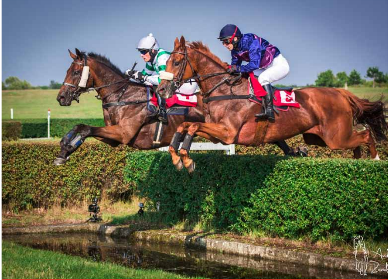
Mostecký hipodrom je držitelem certifikátu Rodinného stříbra Ústeckého kraje. Podle vedení města Mostu si tento areál zaslouží větší pozornost, více akcí a hlavně více návštěvníků.

Pozemky na hipodromu by se podle primátora daly skvěle využívat i pro festivaly, které se konají u jezera. „Pozemky zde jsou velkolepé a mimořádné. Ideální pro tento typ akcí. Nikdo by si nestěžoval na hluk, protože jsou dostatečně daleko od města. Jsou to však jen nárazové akce, kdy hipodrom ožije jen na pár dnů. My hledáme něco, co by tento areál dlouhodobě udrželo,“ nechal se slyšet primátor. Prozradil, že město má v záloze zpracovanou studii pro jezdeckou společnost na rekonstrukci parkurové dráhy, aby zde mohlo vzniknout významné parkurové závodistiště. „Jezdecká společnost tu funguje dobře a hlavně pro lidi z Mostu a okolí, kteří si sem mohou přijít zajezdit na koních nebo pořádají příměstské tábory pro děti. Je to směr, který chceme podporovat, ale bohužel to nechce majoritní vlastník a my nemůžeme rekonstruovat závodistiště, pokud pozemky nejsou naše,“ posteskl si primátor.