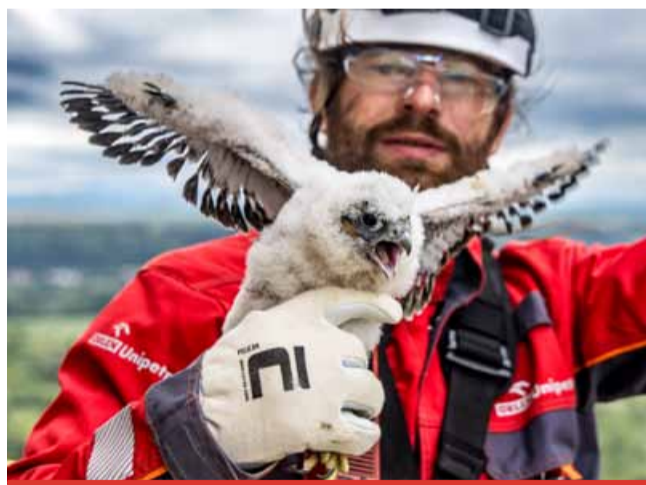
V litvínovské rafinérii pečují pod dohledem kamer o čtyři mláďata. Stejný počet vychovávají také sokoli v rafinérii v Kralupech nad Vltavou a v areálu společnosti Paramo v Pardubicích.