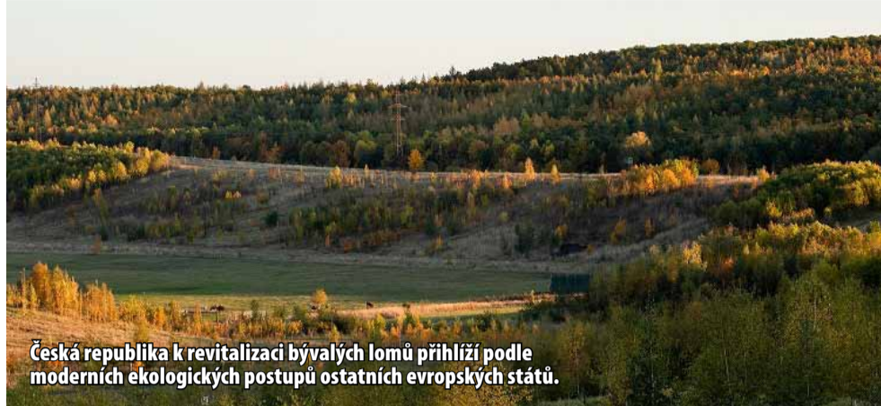
Česká republika k revitalizaci bývalých lomů přihlíží podle moderních ekologických postupů ostatních evropských států.

trem zájmu odborníků na ekologii z celého světa, ale také velmi bohatou a rozmanitou skladbu rostlin a živočichů. „Lom ČSA společně se sousedním lomem Vršany představuje co do počtu vzácných druhů nejpřednější lokalitu v celé ČR. Celkem zde bylo při neúplné inventarizaci zjištěno neuvěřitelných 269 vzácných druhů v různých stupních ochrany či ohrožení, jejichž populace jsou zde navíc často i velmi silné. Nejedná se tedy o náhodně zbloudilé jedince,“ uvedla Eva Maříková.