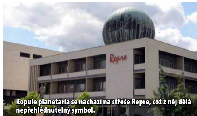
Kopule planetária se nachází na střeše Repre, což z něj dělá nepřehlédnutelný symbol.

ké společnosti. V současnosti je provozovatelem planetária Městská knihovna v Mostě. Provoz je nyní kvůli rekonstrukci kulturního domu Repre přerušen. Náhradní programy probíhají v budově Městské knihovny Most v kinosále na klasické kinoplátne. (nov)