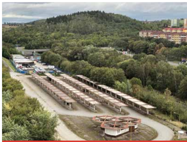
Autobusový terminál původně chtělo město vybudovat místo původního autobusového nádraží. Majitel ho ale nabízel za přemrštěnou cenu.

Od nádraží budou totiž autobusy stát poměrně daleko a směrem do kopce. Problém by proto mohli mít senioři, maminky s dětmi nebo hůře pohybliví lidé. „Jsme si vědomi, že to pro cestující bude znamenat snížený komfort. Prioritní je ale stihnout nádraží v termínu. Naší snahou bude najít nejméně bolestné řešení. Mnoho alternativ bohužel ale nemáme,“ sdělil primátor.