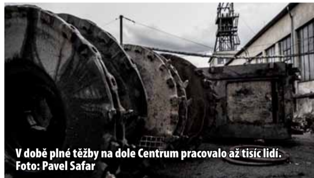
V době plné těžby na dole Centrum pracovalo až tisíc lidí.