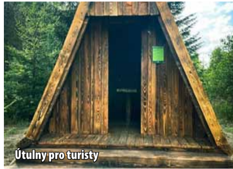
Útulny pro turisty