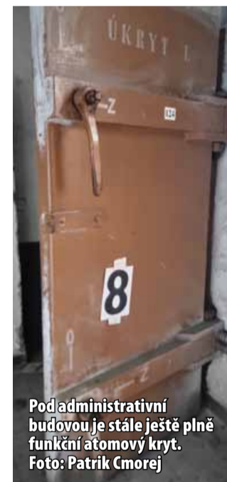
Pod administrativní budovou je stále ještě plně funkční atomový kryt.