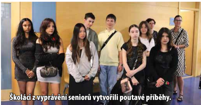
Školáci z vyprávění seniorů vytvořili poutavé příběhy.

rešová a náměstek hejtmana Ústeckého kraje Jiří Kulhánek. Díla mohou návštěvníci vidět ve 4. patře budovy A Krajského úřadu Ústeckého kraje a v rámci otevírací doby úřadu budou k vidění do konce června. (nov)