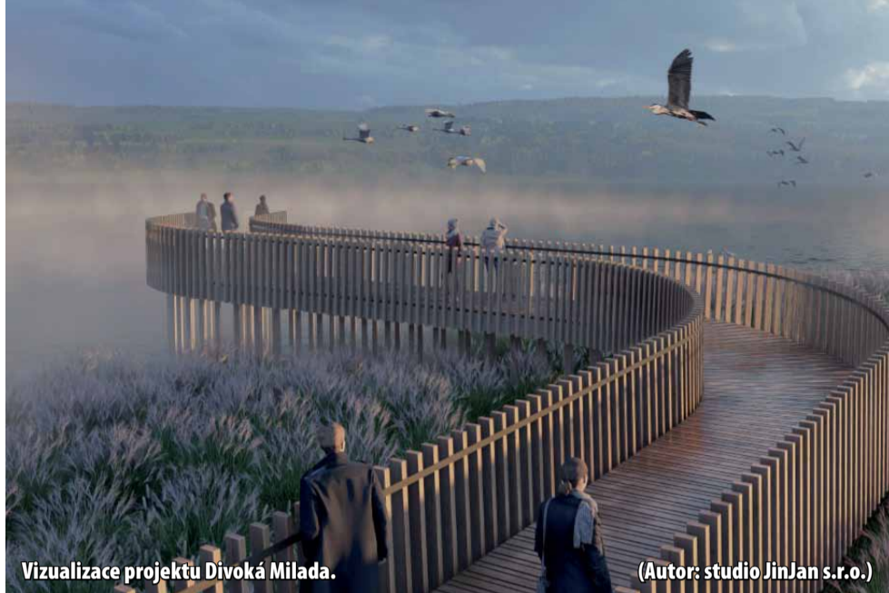
Vizualizace projektu Divoká Milada.

„Záměrem není vybudovat v okolí jezera zoologickou zahradu, ale vytvořit něco opravdu výjimečného. Představte si zoologický park s rozlohou 700 hektarů, který se stane ochránářským, vzdělávacím a zábavným centrem pro všechny. Ve střední Evropě neexistuje srovnatelná kombinace příležitosti k rekreačně sportovnímu vyžití, ochraně přírody a prezentaci atraktivních velkých zvířat doplněný výzkumem jejich vlivu na ekosystémy. Chceme spojit zážitek z divoké přírody s aktivním odpočinkem a poznáním. Jsem si jistá, že projekt bude pro oblast velkým přínosem a podpoří i rozvoj udržitelného cestovního ruchu,“ uvedla ředitelka Zoo Ústí nad Labem a zá-