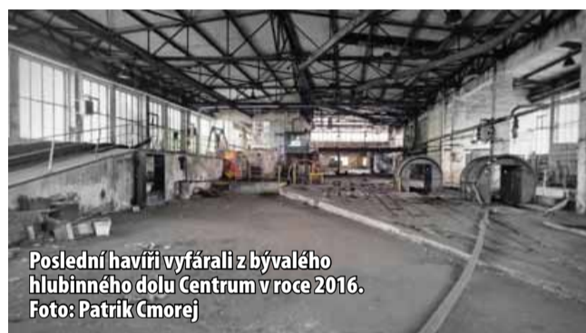
Poslední havíři vyfárali z bývalého hlubinného dolu Centrum v roce 2016.