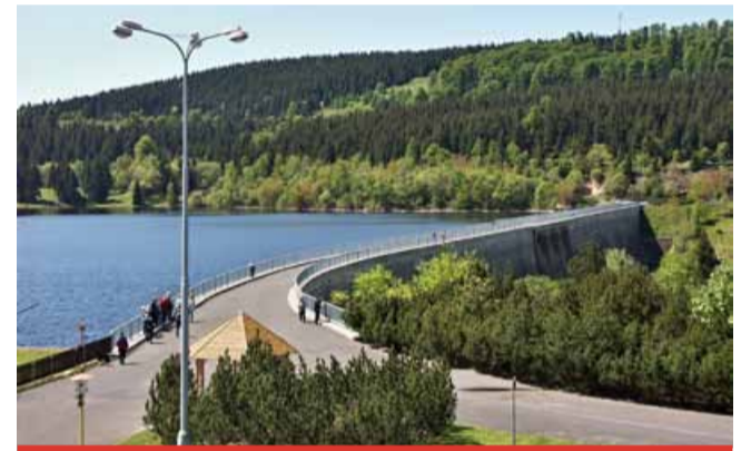
Do flájské přehradě se návštěvníci letos nedostanou.