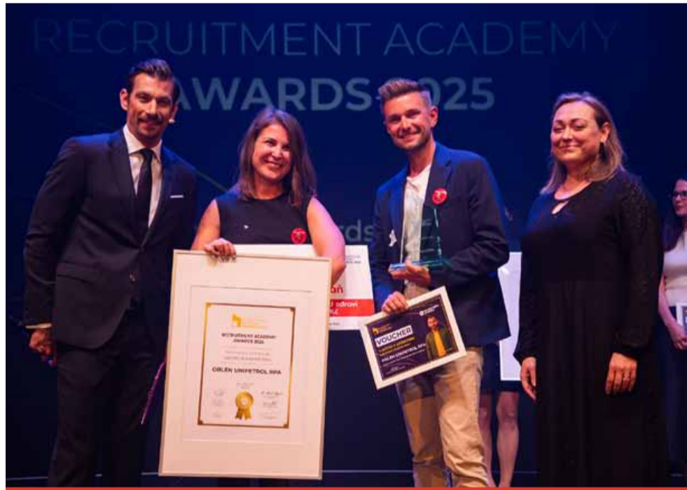
Letos porota hodnotila přes sto projektů od více než sedmdesáti firem.