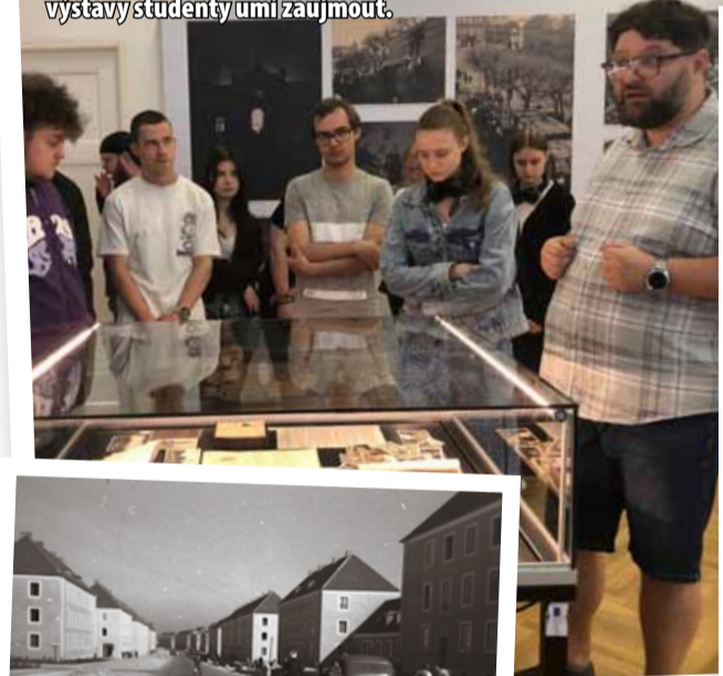
Výstavba bytových domů v Litvínově pro německé dělníky.