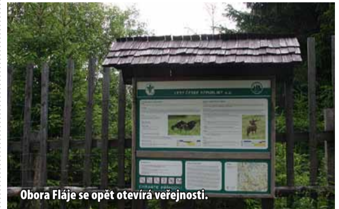
Obora Fláje se opět otevírá veřejnosti.

Vstup je povolen pro pěší a cyklisty jen po vyznačené trase na mapě – asfaltová komunikace Šumenské údolí – Zámecká křižovatka, Zámecká křižovatka – Dlouhá Louka, která je umístěna na vstupních branách Obory Fláje. Z důvodů bezpečnosti veřejnosti a klidu chované zvěře žádají lesáci o dodržování návštěvního řádu. Obora bude otevřena vždy od 10 do 15 hodin v těchto dnech: 14. – 15. června, 1. – 6. července a 5. – 17. listopadu. (nov)