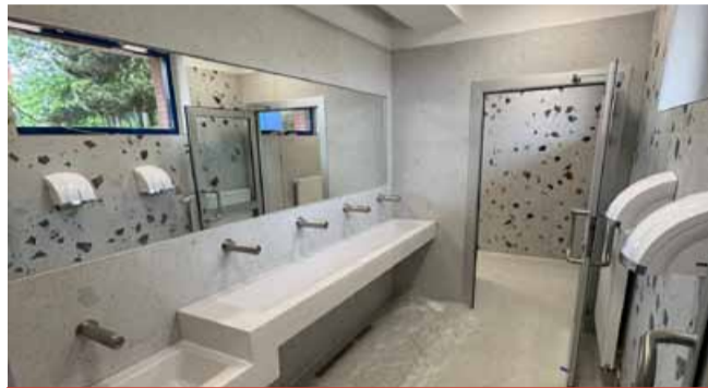
Nově zrekonstruované toalety se otevřely při zahájení letního provozu venkovních bazénů Aquadromu.

Technické služby města Mostu, které Aquadrom provozují, kompletně zrekonstruovaly venkovní toalety, opravily vodní hrad a instalovaly novou laminátovou skluzavku Aquaarena. Vstup k venkovním bazénům je přes letní pokladnu. Stánky jsou otevřeny při návštěvnosti nad sto osob a občerstvit se je možné i u minigolfru. Ten je otevřený denně od 10 do 20 hodin s možností zapůjčení sportovního vybavení. Vstup na dětské hřiště a pískoviště již při provozu venkovních bazénů není zdarma. Sauna je až do 1. září v provozu pouze ve čtvrtek a v neděli od 15 do 21 hodin. Kontakt na minigolf: správa 606 620 632, nebo pokladna 476 127 842. (nov)