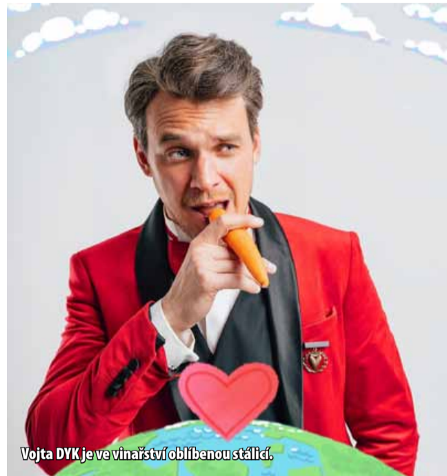
Vojta DYK je ve vinařství oblíbenou stálíci.

Kapela D.Y.K. je hlavním hudebním projektem českého zpěváka a herce Vojtěcha Dyka, který je v Johann W již stálým hostem. Koncerty kapely D.Y.K. jsou nabitě energií špičkových muzikantů, hravostí a radostí z hudby. Areál vinařství je otevřen od 18 hodin, show začíná ve 20 hodin. Vstupenky za 890 Kč jsou k zakoupení na www.xticket.cz. (nov)