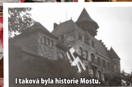
I taková byla historie Mostu.