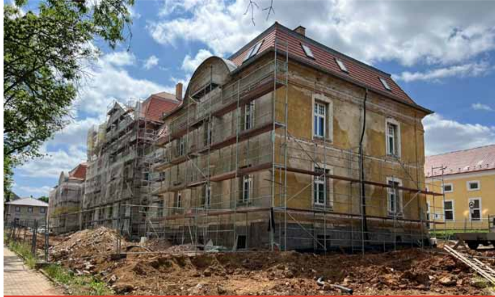
Stavba domova pro nemocné s Alzheimerovou chorobou by měla být hotova ještě letos na podzim.