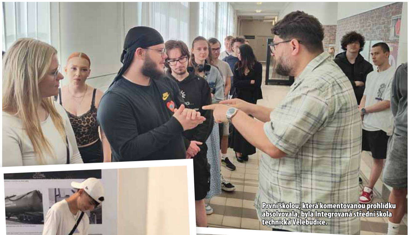
První školou, která komentovanou prohlídku absolvovala, byla integrovaná střední škola technická Velebudice.

Jedinečná výstava nabízí kromě zásadních a poutavých informací i řadu unikátních a zajímavých exponátů. Dozvíte se tu například o nechvalně proslulém táboře 29, uvidíte autentickou kancelář okresního vůdce – kreisleitera, válečné zbraně, ale i hračky z doby války, dopisy na rozloučenou před popravou nebo unikátní seznam padlých, který si podrobně vedl neznámý německý obyvatel Litvínova. Pozornosti neujdou třeba také osobní deníky, v padesátých letech zpětně napsaný životopis o pobytu v trestném táboře 29 spravovaný mosteckým gestapem. K vidění je také deník jednoho z francouzských zajatců, kteří označovali Most jako „peklo Most“. Navštívníci se jednoduše dozvědí spoustu zajímavého o tom, jak lidé na Mostecku válku prožívali. (sol)