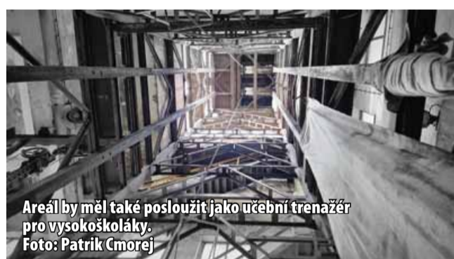
Areál by měl také posloužit jako učební trenážér pro vysokoškoláky.