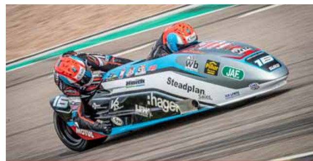
Tohle nebude žádná nuda. Přijďte podpořit skvělé stroje a jezdce a fandit z plných plic.