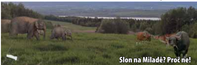
Slon na Miladě? Proč ne!