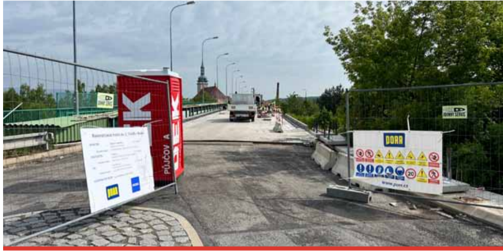
Rekonstrukce mostu začala v září 2024 a byla nezbytná kvůli zatékání a značnému poškození a opotřebení mostní konstrukce. Pro pěší je most otevřen.

Oprava mostu byla rozdělena na dvě etapy. Během první se opravila lávka pro pěší a cyklisty. Poté se most na čas otevřel,