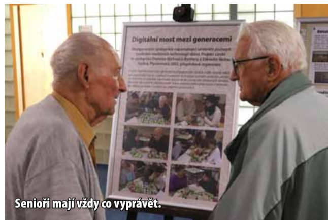
Senioři mají vždy co vyprávět.

logií pomohli seniorům přiblížit na internetu. Následně vzpomínky zpracovali do dvanácti poutavých obrazových příběhů. Společně tak vytvořili „digitál-