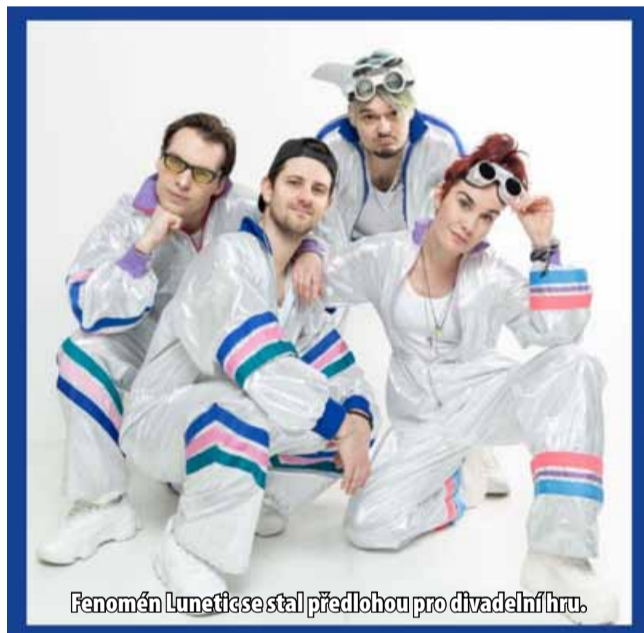
Fenomén Lunetic se stal předlohou pro divadelní hru.

Představení se odehraje v rámci zahajovacího předsta-