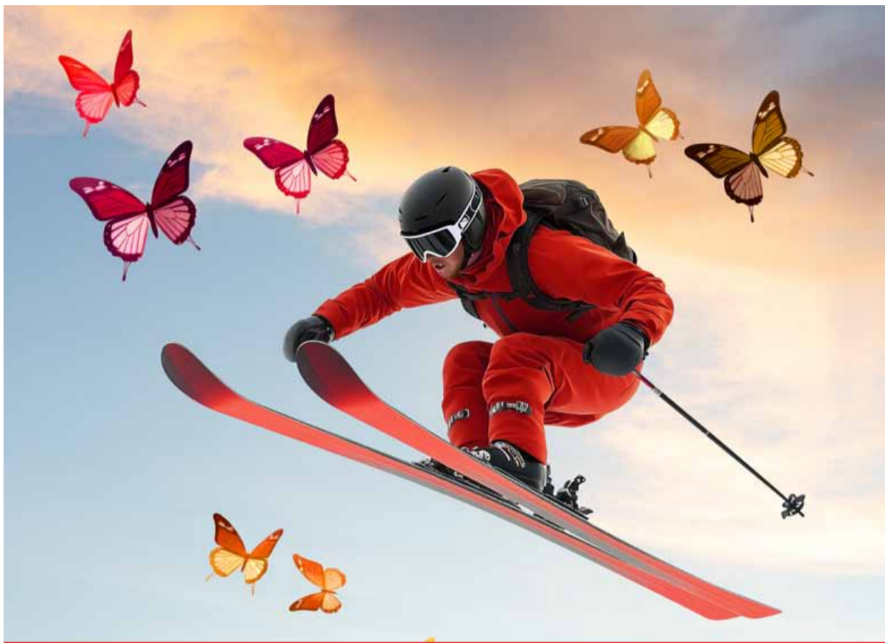
U jezera Most mohla být celoroční umělá lyžařská sjezdovka. Stopku jí ale vystavili motýli. Místem, kde se unikátní atrakce měla vybudovat, vede totiž motýlí koridor.

Sjezdovka s umělým povrchem v Mostě kdysi už bývala. V sedmdesátých letech minulého století byla vybudována na Hořanské cestě a vydržela v provozu zhruba deset let. Její provoz byl ale značně problematický a nákladný, a tak brzy skončil. Dnes jsou ale technologie na jiné úrovni a díky nim se dá poměrně komfortně lyžovat po čtyřicet hodin denně. Na pozůstatky bývalé sjezdovky je možné narazit dodnes. (sol)