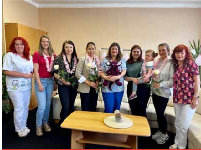
Krajská zdravotní ocenila maminky, které darovaly své mateřské mléko do tak zvané „mléčné banky“. Ty jsou pouze čtyři v celé České republice. Jedna z nich je v mostecké nemocnici.

Darované mateřské mléko nejčastěji využívají perinatologická centra, což jsou specializovaná pracoviště, která léčí nedonošené a závažně nemocné novorozence. Takových center je v České republice dvacet. Starají se ročně o tisíce dětí. Banky jsou ale pouze čtyři, proto je všeobecné mateřského mléka nedostatek.