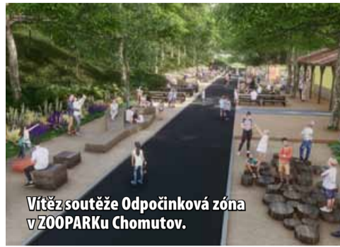
Vítěz soutěže Odpočinková zóna v ZOOPARKU Chomutov.

Soutěž organizuje sdružení SPO-NA, které tvoří Okresní hospodářská komora Most – Odborná sekce cestovního