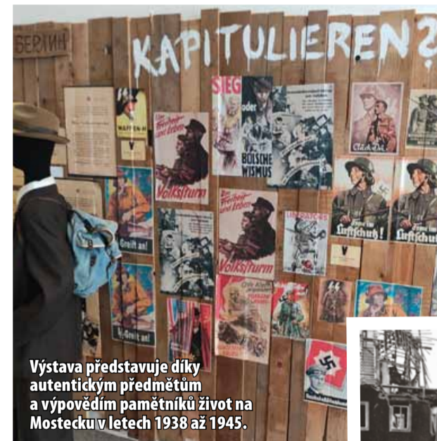
Výstava představuje díky autentickým předmětům a výpovědím pamětníků život na Mostecku v letech 1938 až 1945.