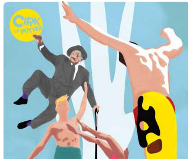
Hostem festivalu Divadelní piknik bude Cirk La Putyka s představením Splash.

Program Divadelního Pikniku bude velmi rozmanitý. Během devíti dní se představí třicetadvacet souborů. K vidění bude činohra i hudební produkce a součástí budou vzdělávací tematické semináře, výstava, autorské čtení, soutěže, divadelní dílny či divadelní průvod městem. Speciálním hostem festivalu je Cirk La Putyka s představením Splash. Přehlídka se bude odehrávat v městském divadle, v Divadle rozmanitosti, v ZUŠ F. L. Gassmanna a v parku Střed. Kompletní programovou nabídku najdete na www.piknikv-moste.cz . (nov)