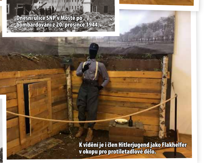
K vidění je i člen Hitlerjugend jako Flakhelfer v okopu pro protiletadlové dělo.