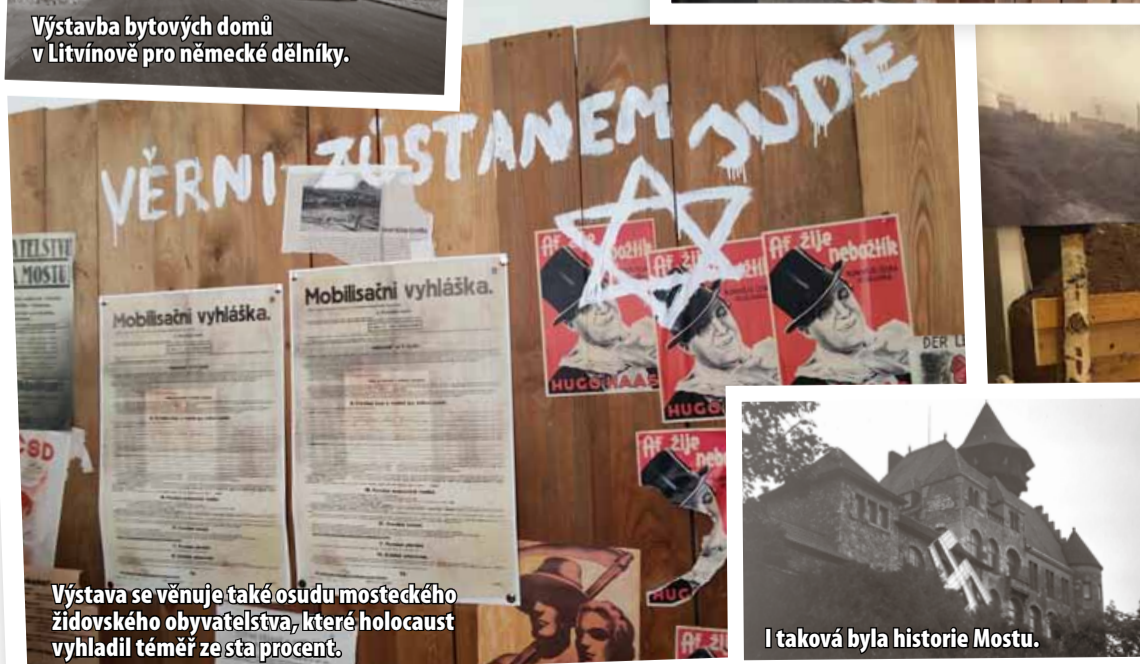
Výstava se věnuje také osudu mosteckého židovského obyvatelstva, které holocaust vyhladil téměř ze sta procent.