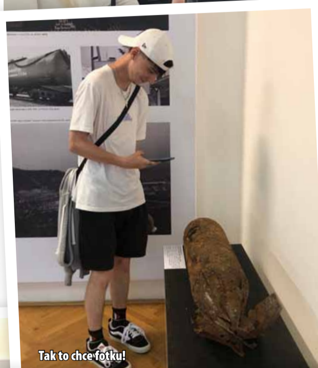
Tak to chce fotku!