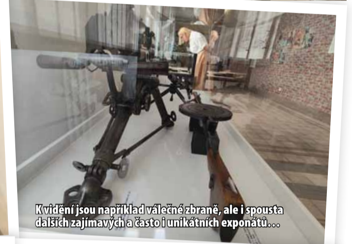
K vidění jsou například válečné zbraně, ale i spousta dalších zajímavých a často i unikátních exponátů...