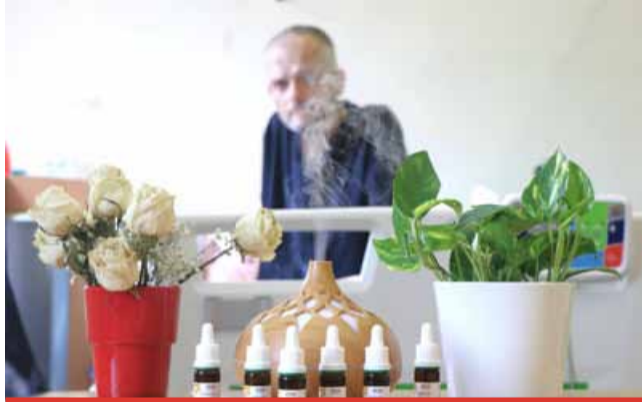
Aromaterapie se ukazuje jako vhodný doplněk komplexní péče, který může přispět ke zklidnění, zmírnění některých obtíží a podpoře psychické pohody.

Společnost ATOK přislíbila dlouhodobou spolupráci včetně dalšího zajištění éterických olejů pro potřeby oddělení. Masary-