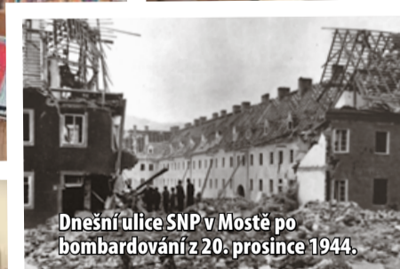
Dnešní ulice SNP v Mostě po bombardování z 20. prosince 1944.