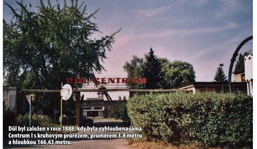
Důl byl založen v roce 1888, kdy byla vyhloubena jáma Centrum I s kruhovým průřezem, průměrem 3,8 metru a hloubkou 166,63 metru.

Poslední havíři vyfárali z bývalého hlubinného dolu Centrum v roce 2016. Od té doby areál chátrá. Do budoucna má ale skupina Sev.en Česká energie s Centrumkou velké plány. Je součástí rozvojového projektu GREEN MINE. „Cílem je vytvořit podmínky pro jeho budoucí průmyslové využití s ohledem na jedinečný charakter místa, jeho limity i rozvojový potenciál,“