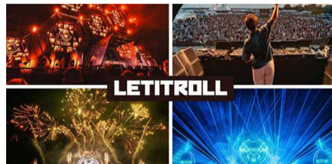
Festival se do Mostu po dlouhých letech přesouvá z vojenského letiště u Milovic. Vstupenky jsou již v prodeji a bývají rychle vyprodané.

Kromě obav z bezpečnosti rezonují veřejným prostorem také