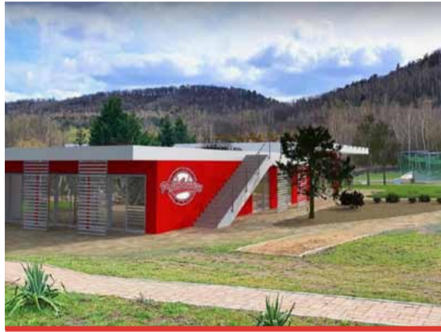
Nová stavba na Ovčíně nabídne nové sociální zázemí včetně zázemí pro klub Painbusters. Novinkou je pochozí střecha, ze které bude moci veřejnost sledovat zápasy.

Nová stavba nabídne nové sociální zázemí včetně zázemí pro klub Painbusters. Vznikly tu také kanceláře pro management, ale i šatny pro sportovce či občerst-