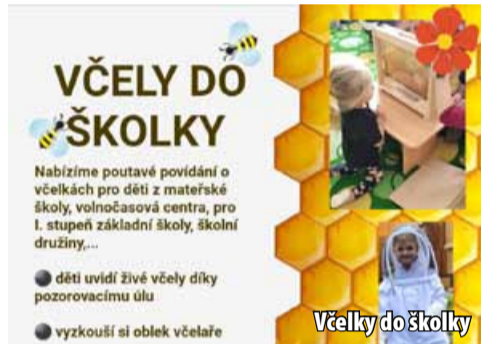
VČELY DO ŠKOLKY