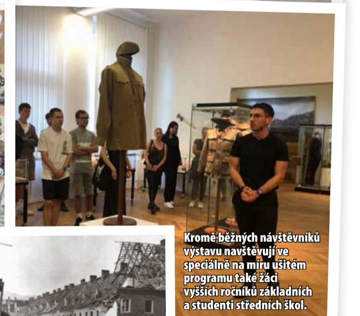
Kromě běžných návštěvníků výstavu navštěvují ve speciálně na míru ušitém programu také žáci vyšších ročníků základních a studenti středních škol.