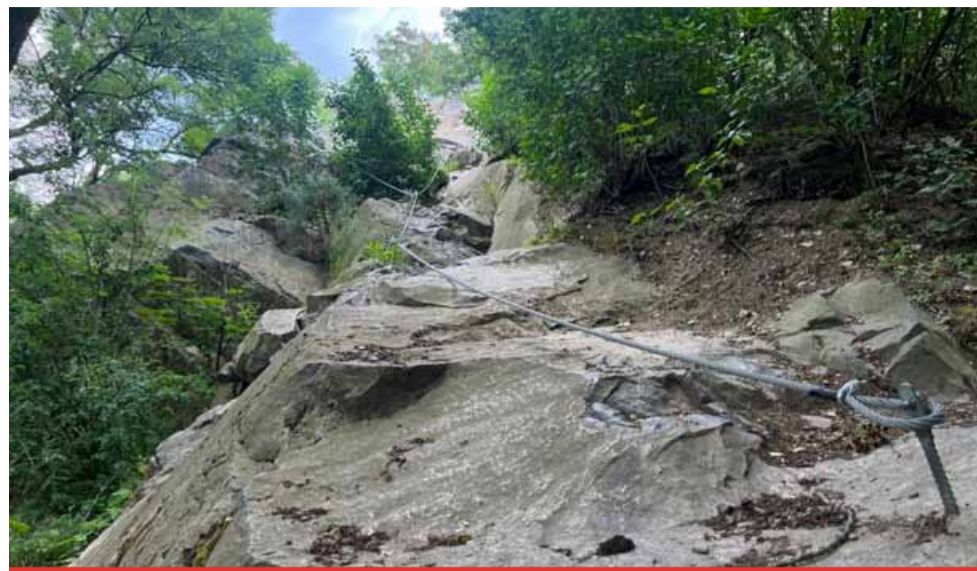
V poslední době zažívají ferraty boom po celé republice. V Mostě budou mít lezci k dispozici šest nových tras, od nejjednodušších až po profi.

První dvě nové trasy od západu budou náročnějšími variantami stávající cesty. Další povedou středem skalní stěny a končit budou u skalní jeskyně. Poslední linie povedou ve výhledové části skalního amfiteátru a ve vrcholové části se spojují. Trasa poté pokračuje po pešíně zajištěné lanovým zábradlím až na vrchol kopce. „Počítáme, že hotové budou ještě letos, realizovat by se měly teď o letních prázdninách,“ upřesnil Marek Hrvol.