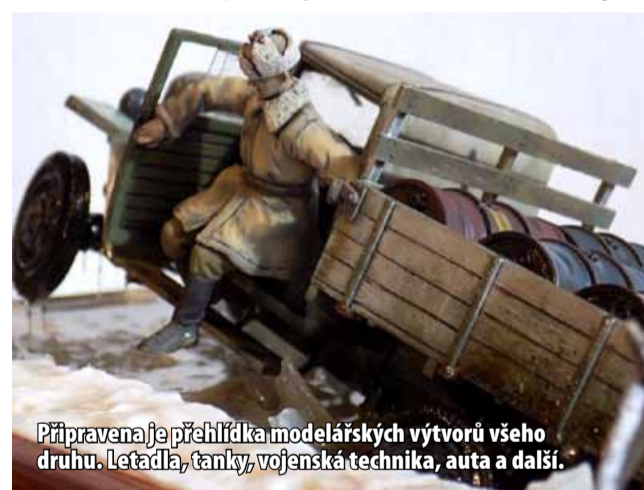
Připravena je přehlídka modelářských výtvarů všeho druhu. Letadla, tanky, vojenská technika, auta a další.

MOST – Letecký archiv Most pořádá v mosteckém muzeu od 14. do 18. června „Modelářskou výstavu“.