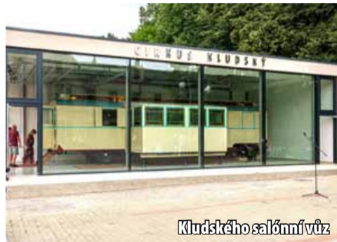
Kludského salonní vůz

ruchu, Euroregion Krušnohoří – Komise pro hospodářství a turistiku, Destinační agen-