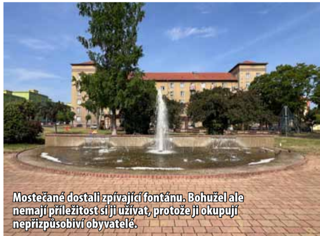
Mostečané dostali zpívající fontánu. Bohužel ale nemají příležitost si ji užít, protože ji okupují nepřizpůsobiví obyvatelé.

Milan Kožnar. „Městská policie se tu snaží dělat nejrůznější opatření. Problém se ale posouvá zleva doprava a od shora dolů. Strážníci pořádně existenci vykážou, ale co chvíli se přesunou o kus dál,“ poznamenal primátor Marek Hrvol. Podle něj se pravidla většinou dodržují tam, kde jsou časové represe. „Park Střed působí více autonomně. Park u fontány je oproti tomu typické veřejné prostranství,“ vysvětlil. Podotkl také, že někteří obyvatelé požadují, aby se z parku odstranily přístřešky, kde se zavadoví jedinci zdržují nejvíce. „Je otázka, zda chceme jít cestou, že budeme rušit přístřešky, lavičky apod. A budeme stále ustupovat...“ odmítá toto řešení primátor.