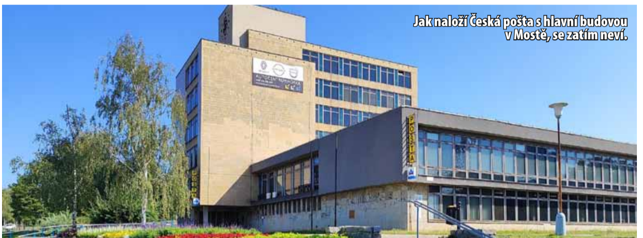
Jak naloží Česká pošta s hlavní budovou v Mostě, se zatím neví.

PRO AKTUÁLNÍ ZPRAVODAJSTVÍ SLEDUJTE WWW.HOMERLIVE.CZ