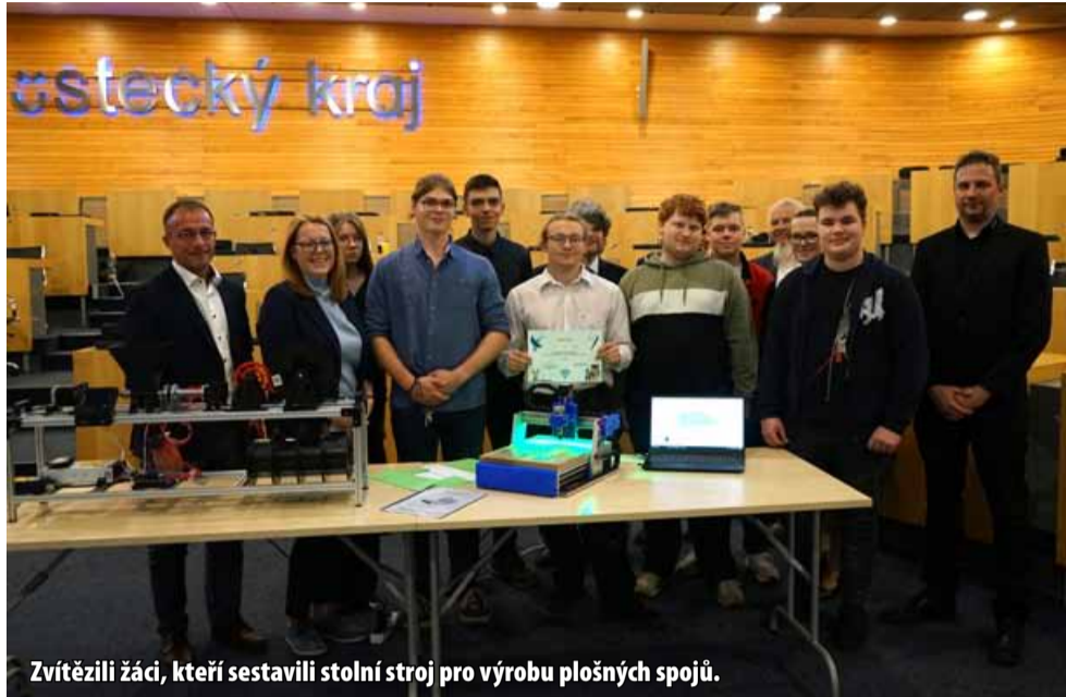
Zvítězili žáci, kteří sestavili stolní stroj pro výrobu plošných spojů.

Smyslem programu je propagace a popularizace odborného vzdělávání. „Cílem je zlepšení kompetencí žáků středních škol v oblasti digitalizace, robotizace, internetu věcí, umělé inteligence a strojového učení, stejně jako rozvoj kreativity a využívání chytrých technologií,“ vysvětlila náměstkyně hejtmana Ústeckého kraje Jindra Zalabáková, která zároveň zasedla v porotě soutěže a dodala: „Všechny práce, které jsme tu dnes viděli, byly fenomenální. Moc děkuji žákům, kteří se do soutěže zapojili. Děkuji i ředitelům a pedagogům, protože namotivovat mladé lidi