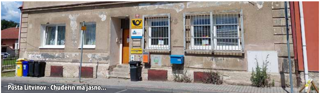
Pošta Litvínov - Chudeřín má jasno...

Po vlně uzavírek zůstala v Mostě v provozu pouze Pošta 6 v Tescu, Pošta 11 v Lipové ulici v nákupním centru Kahan a hlavní pošta číslo 1. V Litvínově fungují pouze dvě pobočky, a to hlavní pošta na náměstí Míru a pobočka v Janově. (ina)