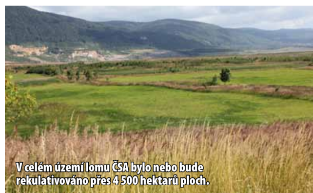
V celém území lomu ČSA bylo nebo bude rekultivováno přes 4 500 hektarů ploch.