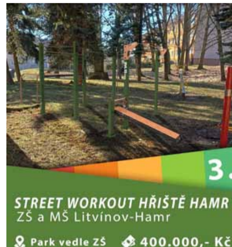
3. STREETWORKOUT HŘIŠTĚ HAMR ZŠ a MŠ Litvínov-Hamr Park vedle ZŠ 400.000,- Kč