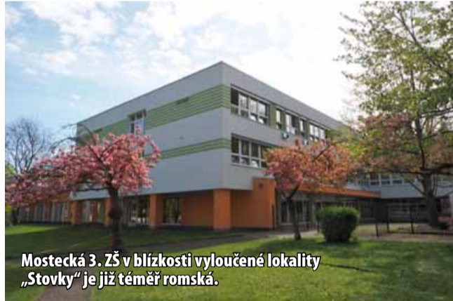
Mostecká 3. ZŠ v blízkosti vyložené lokality „Stovky“ je již téměř romská.