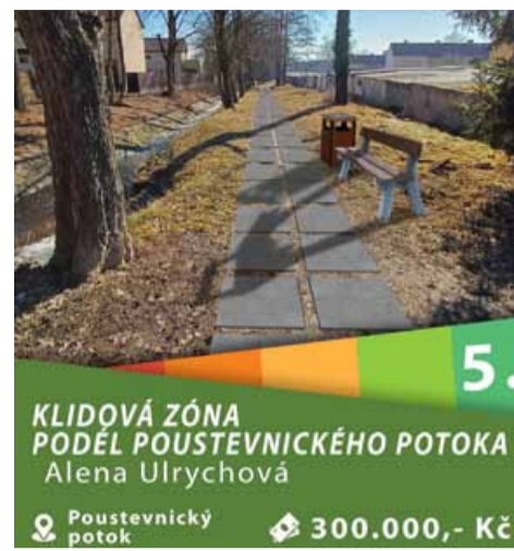
5. KLIDOVÁ ZÓNA PODÉL POUSTEVNICKÉHO POTOKA Alena Ulrychová Poustevnický potok 300.000,- Kč