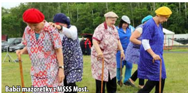
Babčičky mažoretky z MŠSS Most.