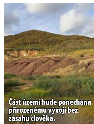
Část území bude ponechána přirozenému vývoji bez zásahu člověka.