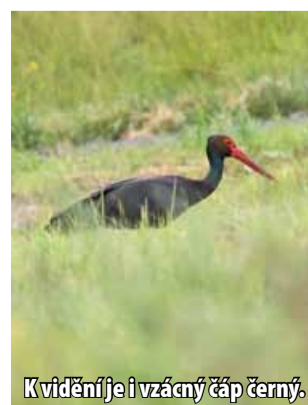
K vidění je i vzácný čáp černý.