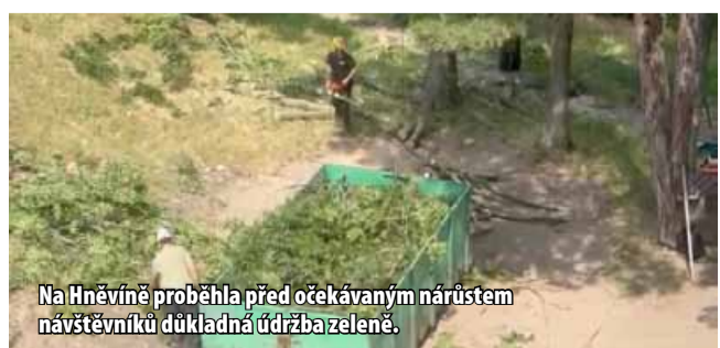
Na Hněvíně proběhla před očekávaným nárůstem návštěvníků důkladná údržba zeleně.