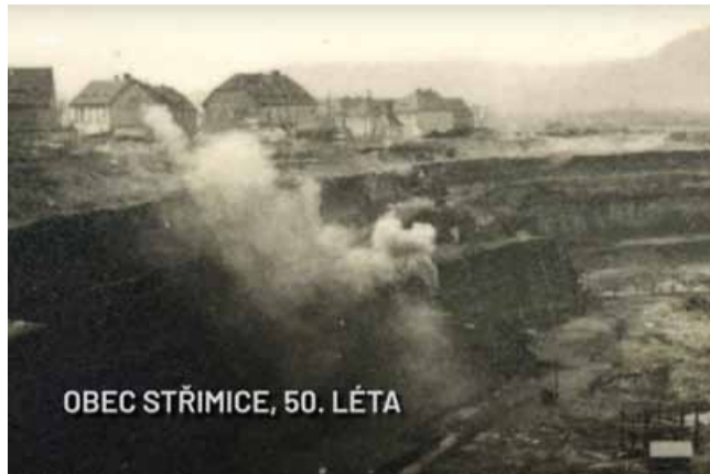
OBEC STŘIMICE, 50. LÉTA

Ornitologové věří, že se jim tím podaří zatraktivnit území pro mnoho ptačích druhů, včetně dudky chocholátého, který je symbolem nového ptačího parku. „Zatím zde ještě nežijí, i když se v okolí vyskytují, ale věříme, že se jim tu během pár let zalíbí. Dudci mají rádi pro-