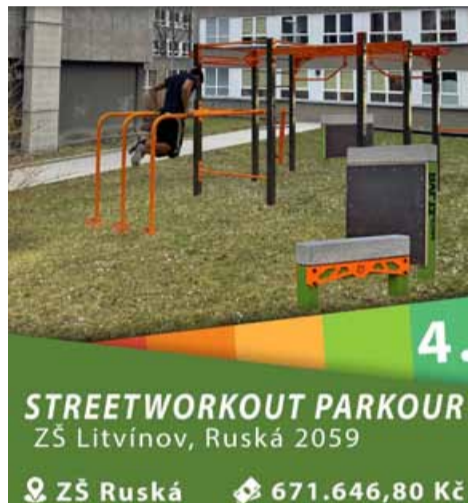
4. STREETWORKOUT PARKOUR ZŠ Litvínov, Ruská 2059 ZŠ Ruská 671.646,80 Kč

Pokud celková částka těchto tří návrhů nepřesáhne stanovený rozpočet 2,1 mil. Kč včetně DPH, může být uskutečněn i další projekt v pořadí – a to až do úplného vyčerpání limitu. Do budoucna plánujeme vyhlášovat tento projekt jako dvouletý s dvojnásobnou finanční alokací. Reagujeme tak na zdoluhavé procesy, jako jsou například stavební povolení, aby bylo možné všechny projekty v daném cyklu úspěšně realizovat,“ upřesnil místostarosta města Karel Rosenbaum. (sol)