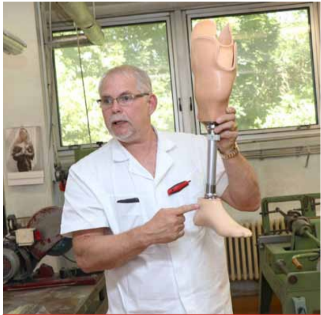
Během čtyřiceti let prošla protetika raketovým vývojem. Od dřevěných protézy, přes laminátové, až po dnešní modulární díly z titanu, které se dají upravovat podle individuálních potřeb každého pacienta.

Cílem primářky je nadále šířit osvětu o amputacích dolních končetin s důrazem na snahu zachovat co největší část končetiny, zejména kolenní kloub. Celosvětově je snahou snižovat počet stehenních amputací. „Ani elektronické kolenní klouby nikdy nenahradí vaše sva-