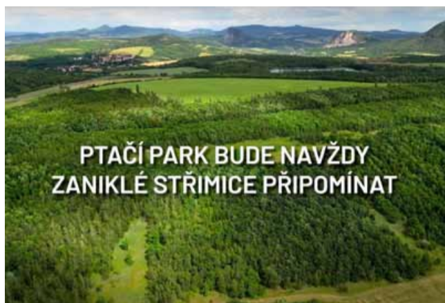
PTAČÍ PARK BUDE NAVŽDY ZANIKLÉ STŘIMICE PŘIPOMÍNAT

světlené lesy propojené s otevřenou, extenzivně obhospodařovanou krajinou, a právě takovou krajinou mozaiku chceme na výsypce vytvořit. Zatím jsme pro dudky připravili alespoň hnízdní budky a věříme, že v nich časem zahnízdí,“ říká správce ptačího parku Střimická výsypka Šimon Kronus a dodává: „Samozřejmě chceme přilákat i další ptačí druhy“.