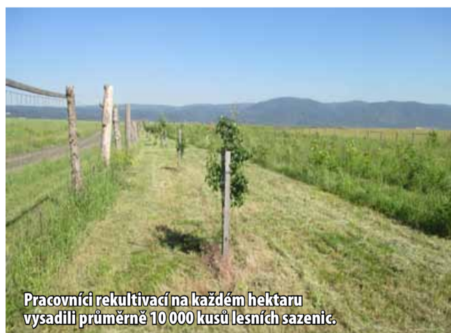
Pracovníci rekultivací na každém hektaru vysadili průměrně 10 000 kusů lesních sazenic.