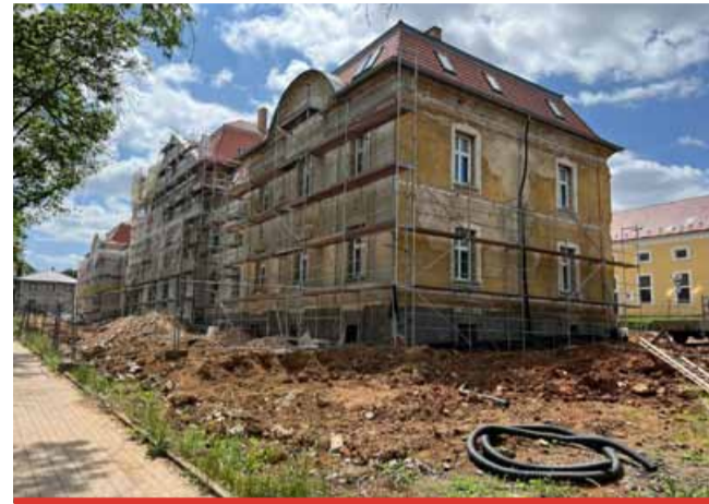
Charita zatím peníze na dokončení domova pro lidi s Alzheimerovou chorobou nedostala. Politici budou o této věci znova jednat v září.

V případě, že město s Ústeckým krajem žádost o dotaci podpoří, bude muset Charita zajistit na dofinancování zbývajících zhruba 10 mil. Kč. „Projekt je od začátku udělán špatně. Nepočítal s finančními zdroji na vícepráce, které jsou u takto starých objektů logické. Byl bych velmi nerad, aby se z toho stal precedens. Měla by to být poslední žádost tohoto typu, kterou bychom podpořili,“ ujišťoval pri-