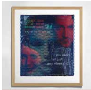
Koláž z berlínských plakátů s nasprejovaným portrétem v optické iluzi

Výstava v mosteckém muzeu nabídne nejen velkoformátová plátana, ale i tak zvané site-specific instalace připravené přímo pro prostory muzea. Výstava je přístupná denně kromě pondělí od 12 do 18 hodin, v sobotu a v neděli od 10 do 18 hodin. (nov)