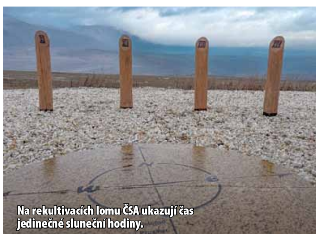
Na rekultivačních lomu ČSA ukazují čas jedinečné sluneční hodiny.