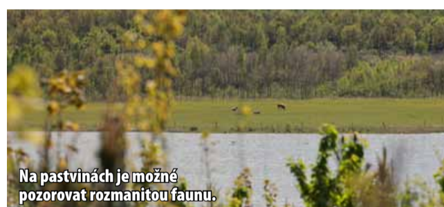
Na pastvinách je možné pozorovat rozmanitou faunu.