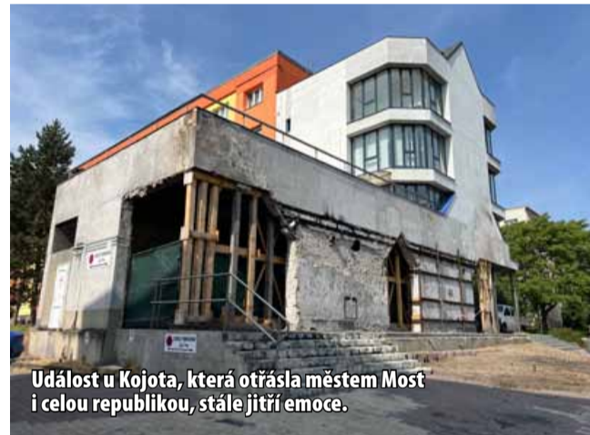
Událost u Kojota, která otrásla městem Most i celou republikou, stále jítří emoce.