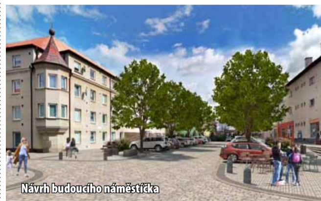
Návrh budoucího náměstíčka