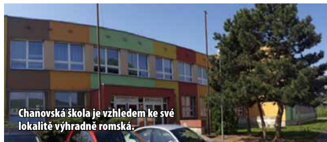
Chanovská škola je vzhledem ke své lokalitě výhradně romská.