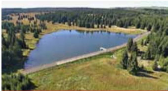
Novoveský rybník se nachází u Hory Svatého Šebestiána.

V Ústeckém kraji zavedou pracovníci Povodí Ohře návštěvníky k horskému Novoveskému rybníku, jehož sypaná hráz prošla rekonstrukcí. Pěší cestou z obce Hory Sv. Šebestiána čeká na děti pohádková stezka s živými bytostmi. V cíli u rybníka se pak zájemci dozvědí, k čemu vodní dílo slouží, jak se o něj Povodí Ohře stará, jaká měření zde provádí a mnoho dalších zajímavostí. Zástupci Městských lesů Chomutov přiblíží, jak důležitá je voda v lese. (nov)