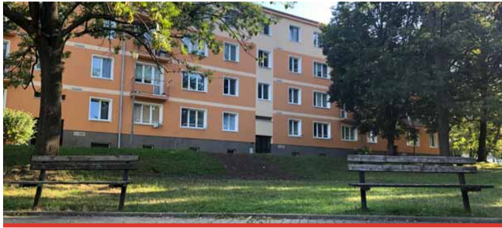
Obyvatelé několika domů v ulici Mladé gardy podali na město petici za odstranění laviček, a to konkrétně v parku za blokem 343 a 344. Město jejich odstranění zamítlo.