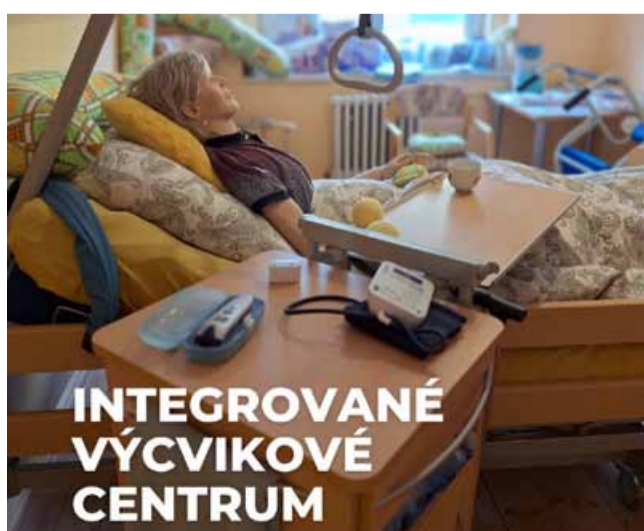
Centrum pomůže všem neformálně pečujícím osobám, které chtějí zvládat péči lépe a bezpečněji.