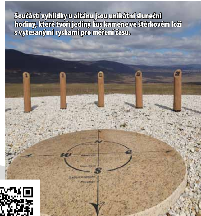
Součástí vyhlídky u altánu jsou unikátní sluneční hodiny, které tvoří jediný kus kamene ve štěrkovém loži s vytesanými ryskami pro měření času.