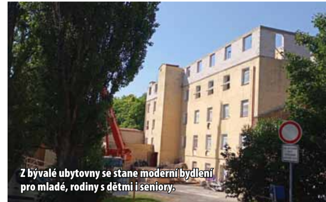
Z bývalé ubytovny se stane moderní bydlení pro mladé, rodiny s dětmi i seniory.

Objekt, který aktuálně přestavuje, sloužil původně jako ubytování pro sociálně slabé, čemuž také odpovídal stav, v jakém ho od města dostal. Nejprve bylo nutné vše vyklidit, odvézt. Dům byl také zamořený hmyzem. Nutná proto byla dezinfekce a deratizace a přes zimu nechat dům vymrznout. „Chtěl bych, aby dům po rekonstrukci zapadal do rázu malebného horského města, jakým Meziboří je. Počítáme opět s tím, že budeme v domě budovat menší byty pro mladé lidi nebo naopak pro seniory a větší byty pro rodiny s dětmi. Aby byl co nejvíce využit prostor v domě, plánuji přístup do bytů přes pavlače. Ke každému bytu plánujeme parkování, tera-