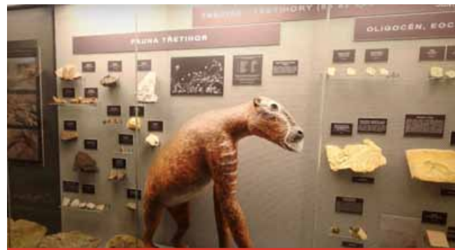
Nová expozice Živá příroda bude navazovat na geologickou část, která je v mosteckém muzeu k vidění.

Muzeum hledá odborné partnery a dodavatele - zejména preparátory, vycpávače, výrobce vitrín a další specializované dodavatele. Cílem je dokončit přípravu projektu Živá příroda do konce letošního roku a zahájit realizaci v červnu 2026.