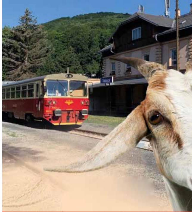
Krajští politici požadují zprovoznění Kozi dráhy v celé délce.

Ústecký kraj proto v oficiálním dopise vyzval Správu železnic, aby od přípravných kroků ke konzervaci obou tratí upustila. Současně požaduje obnovu provozních podmínek na trati Oldřichov u Duchcova – Krupka město. „Konzervaci se bráníme a požadujeme zprovoznění Kozi dráhy v celé délce. Linka T11 má i díky napojení na lanovou dráhu v Krupce a na místa, která jsou součástí světového dědictví UNESCO, obrovský turistický potenciál,“ doplnil radní Ústeckého kraje Jan Růžička. (nov)