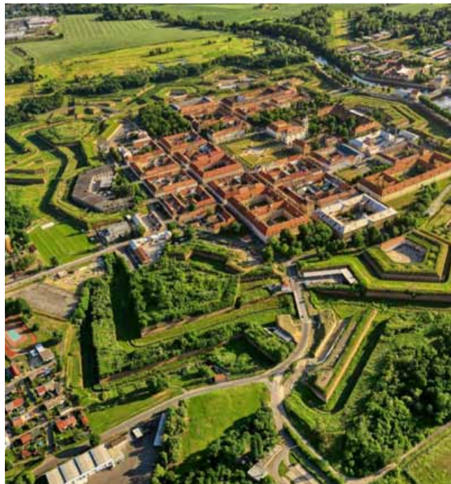
Díky moderním technologiím se návštěvníci i zájemci o historii mohou ponořit do jedinečné atmosféry pevnostního města Terezína.