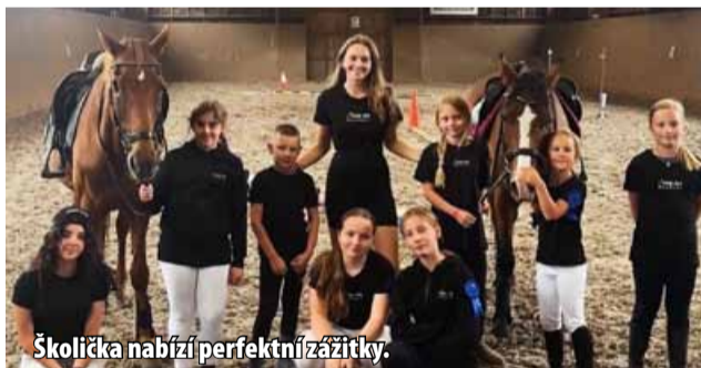
Školička nabízí perfektní zážitky.

od 15 do 17 hodin - začíná se 5. září, vždy v neděli od 10 do 12 hodin – začíná se 7. září. Cena za docházku 1x týdně je 1 500 Kč, 2x týdně: 2 500 Kč a 3x týdně 3 500 Kč. Přihlášky zasílejte na e-mail: info@selskydvurbranany.cz. (nov)