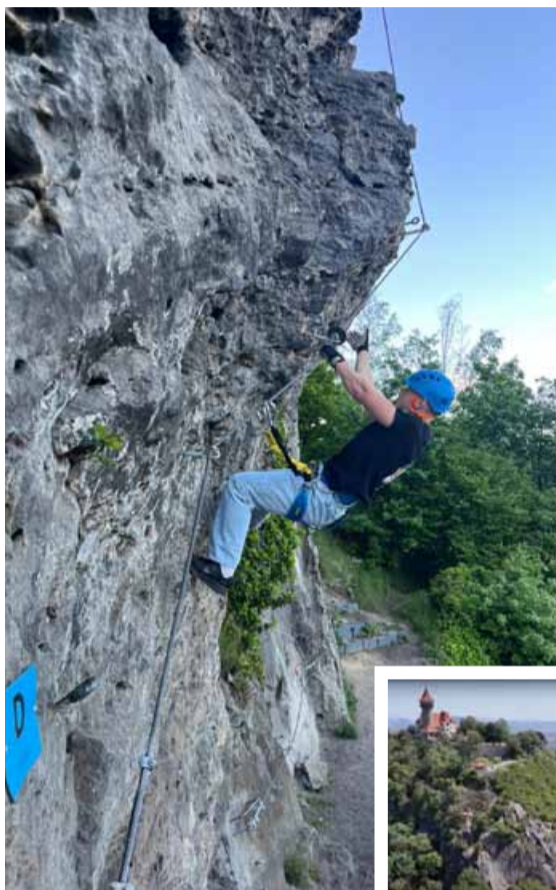
První ferraty na Hněvíně byly spíše pro amatéry. Tyto nové budou už určeny pro náročnější fanoušky ferrat.

Hněvín je zatím jedinou lokalitou, kde se mohou lezecké trasy v Mostě a jeho nejbližším okolí zdolávat. Možností by ale do budoucna mohlo být více. Nabízí se například lokalita na Špičáku. Do té se ale město zatím pouštět nehodlá, protože by nemohlo poskytnout zájemcům dostatečný komfort. „Je dobré, když podobné aktivity mohou fungovat v nějakém celku a mohou poskytnout určitý komfort. Na Špičáku by chybělo návazné zázemí. Do budoucna je to ale jedna z možností,“ dodal primátor.