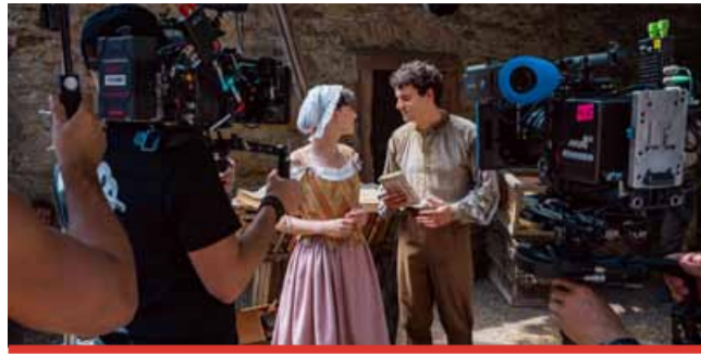
Do kin se pohádka natáčená v Ústeckém kraji vydá 29. ledna 2026.

Pohádka Princezna stokrát jinak vypráví příběh osmnáctileté Stelly z Jablečného království, která se snaží naplnit očekává-