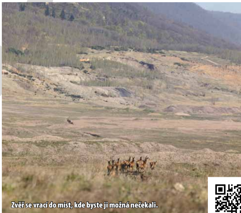
Zvěř se vrací do míst, kde byste ji možná nečekali.

Prostřednictvím webových stránek se mohou zájemci vypravit na čtrnáct míst v okolí nebo přímo uvnitř lomu ČSA. Na nich se dozvědí nejen o minulosti a současnosti těžební lokality, ale také technické zajímavosti nebo pozoruhodnosti spojené s rekultivacemi i územím, které se nechá přirozeně obnovit nebo sukcesi. Zároveň si každý může místa prohlédnout virtuálně prostřednictvím aplikace, která nabízí obrazové, ale i audio informace o jednotlivých místech a je doplněna například videoprezentacemi a dalšími informacemi. Každé z míst má svého partnera, ať už z řad odborníků ze skupiny Sev.en Česká energie nebo specialistů z vysokých škol, odborných institucí a firem. Část stanovišť Biosafari zůstane ještě nějaký čas i s ohledem na to, že v lomu ČSA stále ještě probíhá aktivní činnost, veřejnosti nedostupná, a je tedy možná pouze virtuální návštěva.