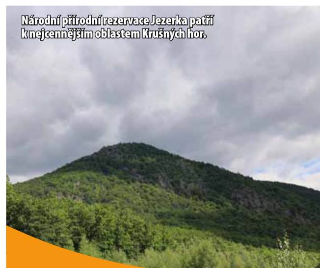
Národní přírodní rezervace Jezerka patří k nejcennějším oblastem Krušných hor.