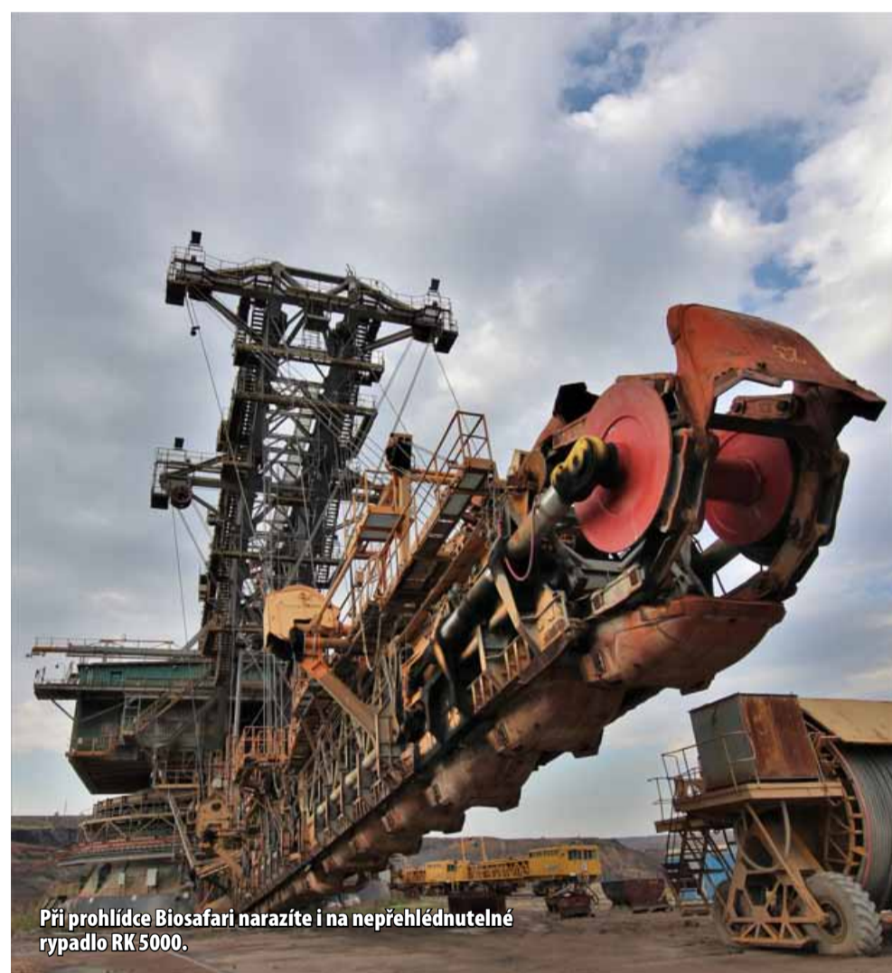
Při prohlídce Biosafari narazíte i na nepřehlédnutelné rypadlo RK 5000.