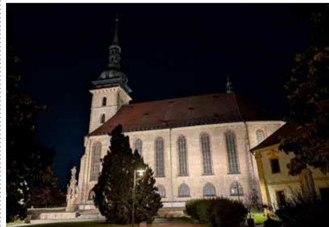
Mostecký kostel nabídne nevědní atmosféru pod rouškou noci.

Začátek prohlídky je v 19 hodin. Poté bude vchod uzavřen a do kostela nebude možné v průběhu prohlídky vstupovat. Konec prohlídky bude zhruba ve 21 hodin. Tento čas je orientační. (nov)