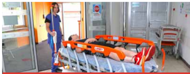
Svou premiéru v rámci České republiky mělo zcela nové transportní lůžko Sprint 400 letos v červnu na setkání biomedicínských inženýrů z celé republiky v Jizerských horách.