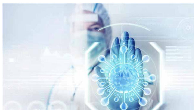
Využití AI asistence v Krajské zdravotní přispívá nejen ke zvýšení efektivity, ale také k lepšímu zachycení reálného výskytu infekcí, které by jinak mohly zůstat nepovšimnuty.

Radiologická klinika a radiodiagnostická oddělení - Používají umělou inteligenci pro hodnocení vyšetření počítačovou tomografií u screeningu karcinomu plic a u vyšetření tenkého střeva. V červenci 2025 byl zahájen pilotní program využití AI u hodnocení rentgenových snímků poranění skeletu, patologií hrudníku a specifických patologií muskuloskeletálního systému. (nov)