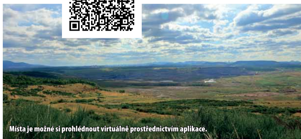
Místa je možné si prohlédnout virtuálně prostřednictvím aplikace.