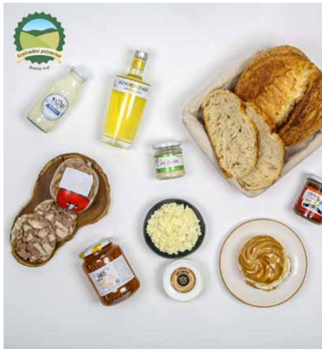
ti převezmou 12. září na slavnostním vyhlášení na výstavě Zahrada Čech v Litoměřicích. (nov)

Ocenění značkou Regionální potravina a Potravina z kraje Přemysla Oráče si producen-