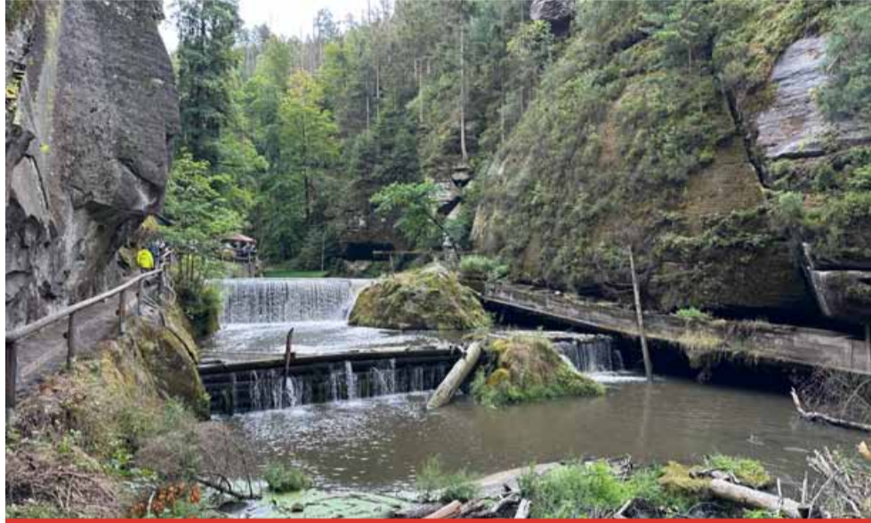
Obnovený provoz tradičních lodiček na řece Kamenici tak po dlouhé odmlce opět přiláká milovníky přírody i oblíbeného skalního kaňonu, který patří mezi největší poklady české přírody.

Edmundova soutěska se od své rekonstrukce v polovině 60. let 20. století nazývala Tichá a v 50. a počátkem 60. let 20. století Durišova soutěska podle ministra lesů a země-