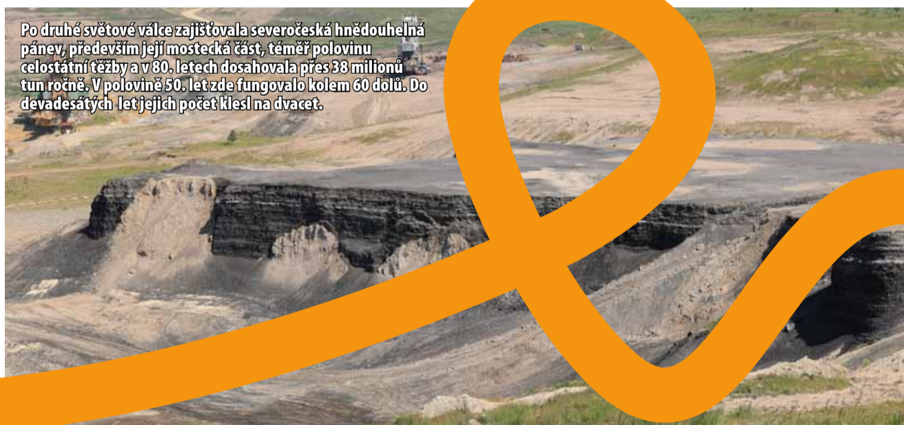
Po druhé světové válce zajišťovala severočeská hnědouhelná pánev, především její mostecká část, téměř polovinu celostátní těžby a v 80. letech dosahovala přes 38 milionů tun ročně. V polovině 50. let zde fungovalo kolem 60 dolů. Do devadesátých let jejich počet klesl na dvacet.