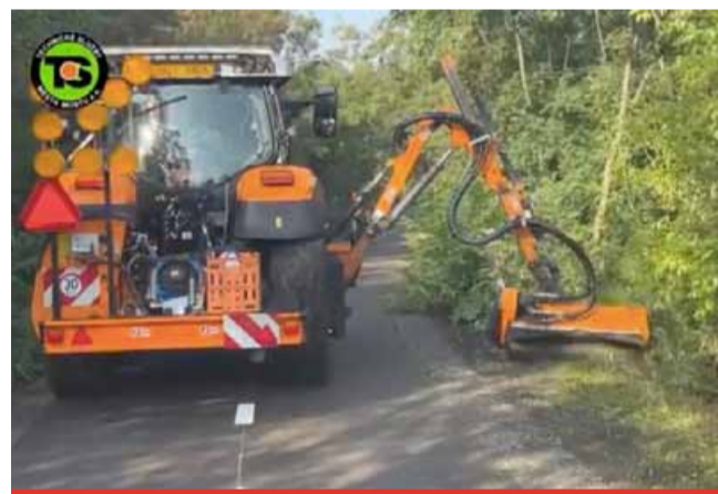
Aby nová cyklostezka zůstala bezpečná a příjemná, o její okolní zeleň se budou starat mostecké technické služby.