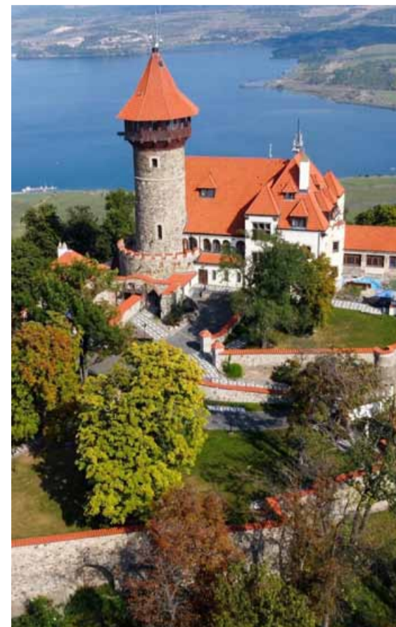
Hrad Hněvín nabídne už brzy nejen novou sportovní atrakci, ale i nevěšdní gastronomické zážitky.

PRO AKTUÁLNÍ ZPRAVODAJSTVÍ SLEDUJTE WWW.HOMERLIVE.CZ