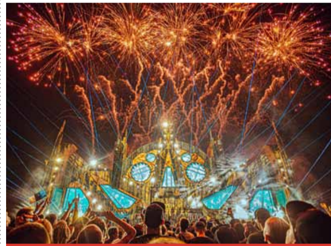
Letošní festival přivítal 25 tisíc návštěvníků, příští ročník očekává ještě vyšší návštěvnost.

Kdo letos nemohl nebo nestihl vidět tuto unikátní šou na vlastní oči, do diáře si může zapsat datum 30.7. - 2.8. 2026. Let It Roll našel u jezera Most nový domov, což na příští čtyři roky zpečetil s městem Most smlouvou. Letos na festival do Mostu přijelo na 25 tisíc návštěvníků z 82 zemí světa a vystoupilo zde kolem 140 interpretů. (nov)