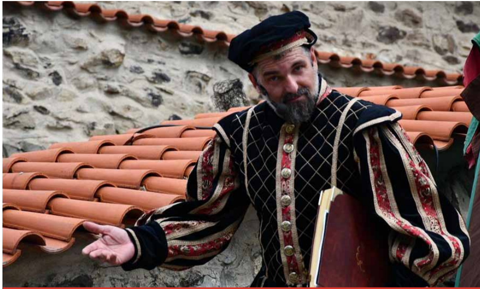
Součástí nového turistického informačního systému bude mimo jiné například naučná stezka Edwarda Kelleyho na vrchu Hněvín.

Turisté by měli v těchto lokalitách najít nové informační tabule. Na nich se objeví naučné texty a zajímavosti, aby měli lidé kompletní informace o daném místě. Přiblíží se jim tak