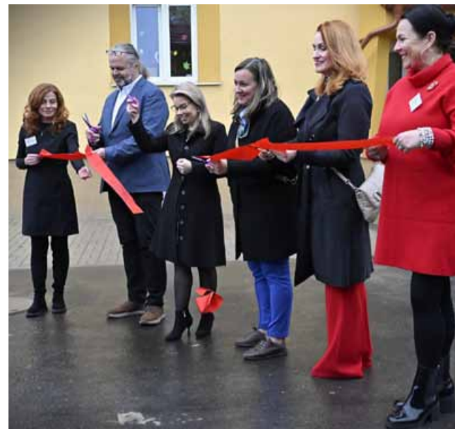
Nová služba přináší nejen odbornou podporu samotným klientům, ale i tolik potřebnou úlevu jejich rodinám.

Slavnostní otevření se konalo za účasti významných hostů, dárců, odborníků, rodičů i široké veřejnosti. Mezi gratulanty nechyběl náměstek hejtmána Ústeckého kraje Jiří Kulhánek, náměstkyně primátora města Mostu Markéta Stará, přednostka psychiatrické kliniky FZS UJEP a Krajské zdravotní Jakub Albrecht či poslankyně a budoucí ministryně pro místní rozvoj Zuzana Schwarz Bařtipánová. Denní stacionář vznikl za podpory Ústeckého kraje, města Mostu a dárců z řad firem i jednotlivců. Zájemci o službu mohou nalézt více informací o registraci a programu na www.mostacek.cz . (nov)