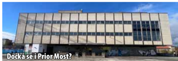
Dočká se i Prior Most?

Streetartový festival by měl posloužit i k popularizaci streetartu a uvědomění si, co je jeho obsahem. „Nejsou to jen nelegální malby po zastávkách. Mohou mít i formu legální. Bude to i osvěta sprejerům, aby věděli, že město je i k tomuto umění otevřené a je tu prostor pro vzájemnou komunikaci,“ uzavřel primátor. (sol)