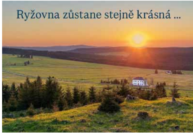
Ryžovna zůstane stejně krásná ...

A právě do tohoto prostředí se rozhodl umístit svůj nový román. „Vím, je to trochu odvaha a trochu troufalost. Ale já věřím, že znalost zdejšího okolí a přátelství s některými pamětníky mi při psaní tohoto příběhu pomůžou. Poctivě sbírám materiály, stavím kostru příběhu a brzy se pustím do samotného psaní. Myslím, že následující rok budu na Ryžovně trávit ještě víc času než dosud,“ dodává autor. Pokud vše dobře dopadne, kniha by měla být na světě příští rok na podzim. (nov)