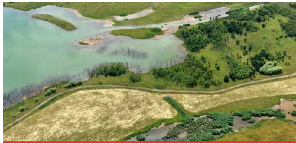
Podle posledních moderních přístupů dostává větší prostor po ukončení těžby příroda.

pouštění jezera zatím nedochází. Už nyní se ale na dně lomu hromadí voda, hladina stoupá a je nutné pečlivě hlídat její kvalitu. Kvalitu vody v budoucím jezeře hlídá externí odborná firma ENKI, která se zabývá aplikovaným výzkumem za pomoci moderních technologií. Společnost ENKI spolupracuje při kontrole kvality vody s ČZU. Pravidelně odebírají vzorky vody v budoucím jezeře a na budoucích zdrojích napouštění v různých hloubkách. Kontroly se zaměřují se na chemické složení, zooplankton, fytoplankton, proměřují základní fyzikálně chemické parametry, jako jsou průhlednost vody, vodivost, koncentrace kyslíku, pH a jejich stratifikaci od hladiny ke dnu. Kvalitu vody kontrolovala i Česká inspekce životního prostředí. Z výsledků kontroly vyplynulo, že údaje ze vzorků odebraných ČIŽP, ENKI a ČZU jsou shodné. Že nedochází k porušování vodního zákona, nedovolenému vypouštění důlních vod do vod povrchových a ani k ohrožení spodních vod. Podle všech zjištění je