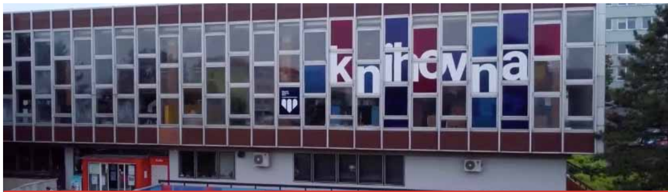
Co bude s knihovnou pro přestěhování do Repre? Zatím trvá záměr uměleckého centra, kde by dominantně fungovala ZUŠka.