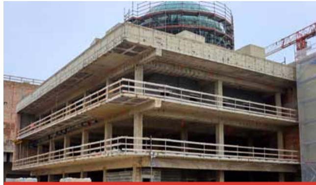
Otevření nového Repre se posouvá ze závěru roku 2026 na první polovinu roku 2027.

Město také již vyhlásilo požadavky na nové nájemce restaurace v Repre. „Termín na nájemce restaurace je stanoven na konec října. Zájem evidujeme, ptají se a oslovují nás někteří provozovatelé, někteří se už i přihlašují. Pronajmát budeme prostory komplexně, tedy restauraci i s exkluzivitou obsluhy sálu, který slibuje příliv dalších zákazníků během akcí, jakou jsou plesy, konference apod.,“ prozradil dále primátor.