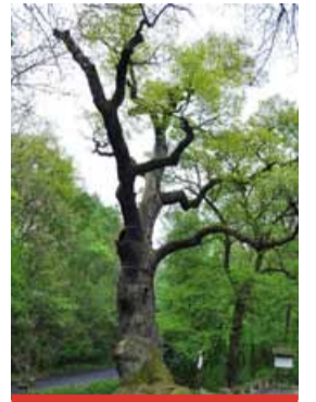
Stromem roku 2025 se stal legendární Oldřichův dub z Ústeckého kraje.

Oldřichův dub je spojený s českými dějinami, neboť se objevuje již v Dalimilově kronice. Podle pověsti zde potkal přemyslovský kníže Oldřich Boženu, kterou si poté vzal za ženu, a z jejich nelegitimního svazku se narodil jediný syn, pozdější kníže Břetislav I. Některé verze pověsti uvádějí, že Božena byla zadána a po odchodu s Oldřichem se její opuštěný milenec – či snad manžel – na dubu oběsil. (dub)