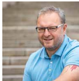
A to i díky velké Mostecké slavnosti.

přijedou bavit z jiných měst? Vždyť to je právě to, co potřebujeme a chceme! Chceme ukázat všem, jak je zdejší město a kraj krásný a je to tu super! Návštěvníci, kterým se líbilo na slavnosti, se příště vrátí třeba na jezero Most. Tak vzniká z Mostu zajímavé turistické místo a turistická oblast, která s sebou přináší peníze do mosteckých prodejen, restaurací, kaváren, ubytovacích zařízení. Ruku na srdce, kdo by před deseti lety řekl, že naše město bude turisticky zajímavé? Já rozhodně ne a jsem moc rád, že se to u nás v Mostě takto mění.