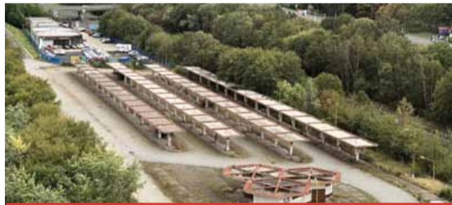
Bývalé autobusové nádraží dlouhá léta chátrá a situace se jen tak asi nezmění...

ale stále se konečná částka pohybovala patnáct milionů korun nad cenou znaleckého posudku. Společnost BUS.COM už ale na další snížení přistoupit nechtěla, a proto jsme museli zvolit jinou alternativu. Nic se nezměnilo ani během doby, kdy jsme prezentovali nový záměr s vybudováním autobusového terminálu na opačné straně. Proto se se nový terminál nakonec realizuje na jiném místě.“ (sol)