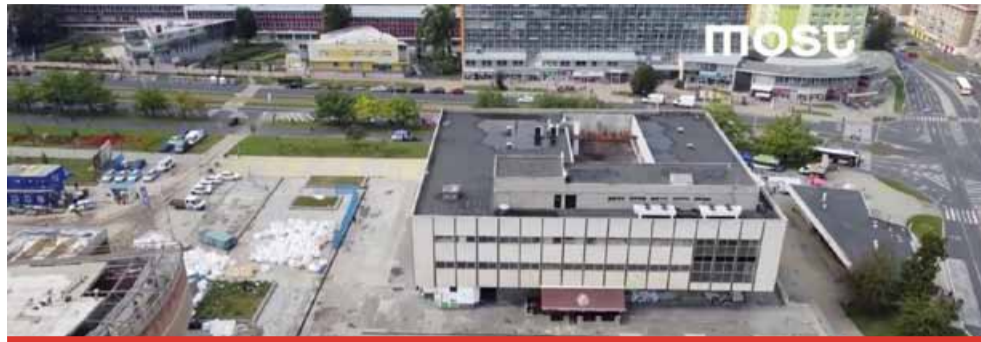
Bývalý Prior se má změnit na komunitní a kulturní centrum.

Mezi vybranými uchazeči jsou zástupci ateliérů, které předvedly reference zahrnující obdobné typy objektů, jako je Prior. Mezi vybranou pěticí jsou jak menší, tak i větší studia, která mají zkušenosti a své návrhy také reálně praktikovala. Jedná se mnohdy o významné stavby. Jsou tu jak zástupci ze zahraničí, tak i čeští architekti.