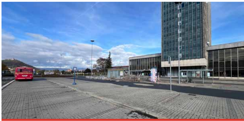
Modernizace přednádražních prostor vyžaduje uzavírky pro MHD i osobní vozidla. Ty potrvají až do poloviny příštího roku, kdy by měla být celá akce dokončena.

Modernizace však vyžaduje uzavírky pro MHD i osobní vozidla. Ty potrvají až do poloviny příštího roku, kdy by měla být celá akce dokončena. Občané, kteří se potřebují dostat k nádražní budově, ale nemusejí zoufat. Město vyjednalo dočasnou náhradní příjezdovou cestu s omezeným stáním, a to v místě bývalého autobusového nádraží. Cestující MHD se také k nádraží dostanou blíže než z Rudolické ulice, kde nyní autobusy parkují. „Kladli jsme důraz na to, aby k nádraží mohl co nejdříve zajíždět autobus. Ačkoliv zhotovitel trval na tom, že k nádraží nebude zajíždět ni-