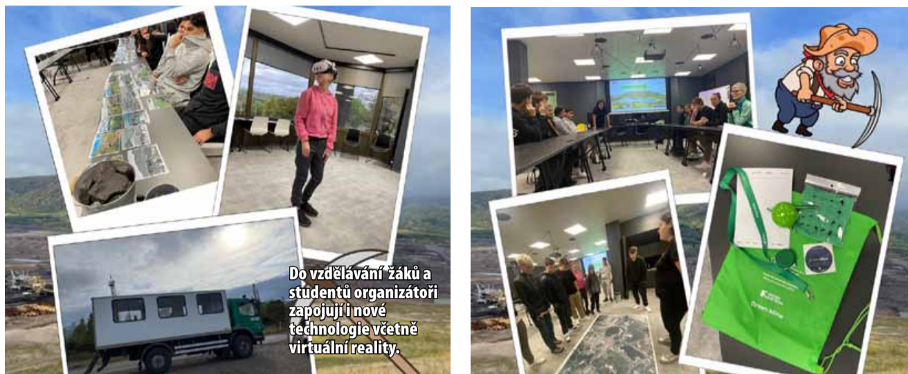
Do vzdělávání žáků a studentů organizátoři zapojují i nové technologie včetně virtuální reality.