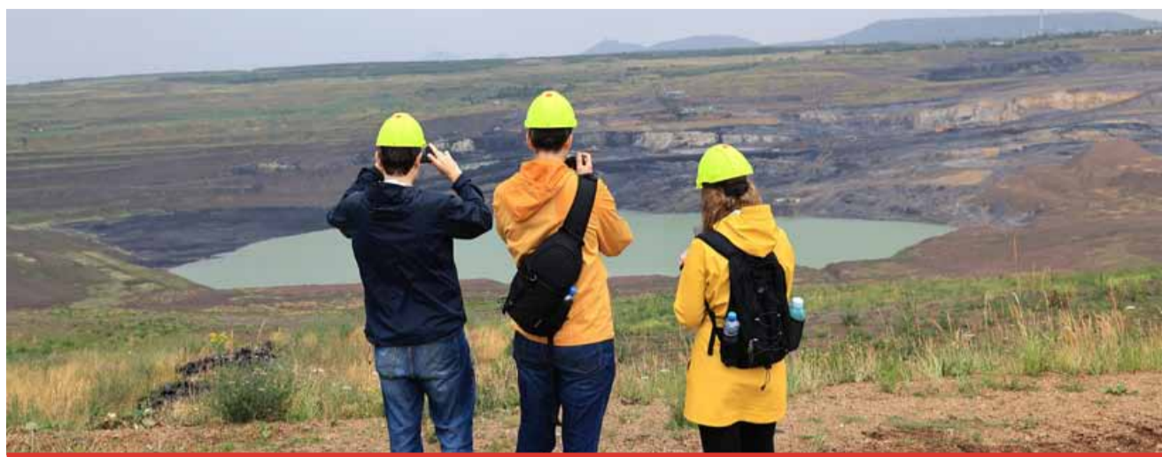
O unikátní procházky v nevhodném prostředí mají zájem nejen místní, ale i návštěvníci ze vzdálených měst republiky.

Výzkumníky zajímá každá i zdánlivě nepodstatná informace, například odkud se o možnosti navštívit lokalitu ČSA dozvěděli, odkud sem přicházejí a jaká je jejich motivace. „Zajímá nás, zda jsou z regionu, už jsme zaregistrovali návštěvníky z vy-