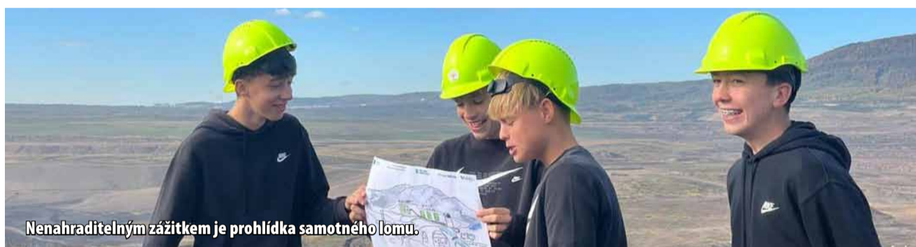
Nenahraditelným zážitkem je prohlídka samotného lomu.