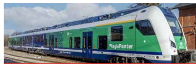
Provoz bateriových vlaků začne nejpozději v roce 2032, ale práce začíná už teď. Ústecký kraj vybírá dopravce i výrobce souprav.

trasy Most – Louny – Rakovník, Most – Litoměřice, Žatec – Lovosice – Ústí nad Labem a Děčín – Česká Lípa – Liberec. „Přidělení dotace na dva projekty Ústeckého kraje pokládám za velký úspěch. Nejen pro kraj, ale hlavně pro železnici a naše cestující. Díky dotaci se i na vedlejší tratě dostanou moderní, tichá a rychlá vozi-