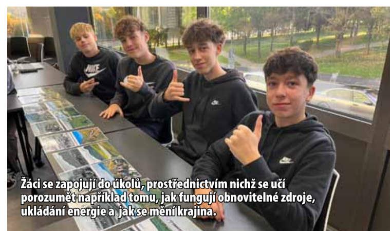
Žáci se zapojují do úkolů, prostřednictvím nichž se učí porozumět například tomu, jak fungují obnovitelné zdroje, ukládání energie a jak se mění krajina.

Pro školní rok 2025/2026 bylo vypsané 20 termínů vzdělávacích kurzů, aktuálně je zaregistrováno 11 škol z okresů Most a Chomutov. Každý z kurzů je pro 28 dětí. Do konce školního roku 2025/2026 jsou již všechny termíny plně obsazené. Další registrace škol bude možná opět v roce 2026.